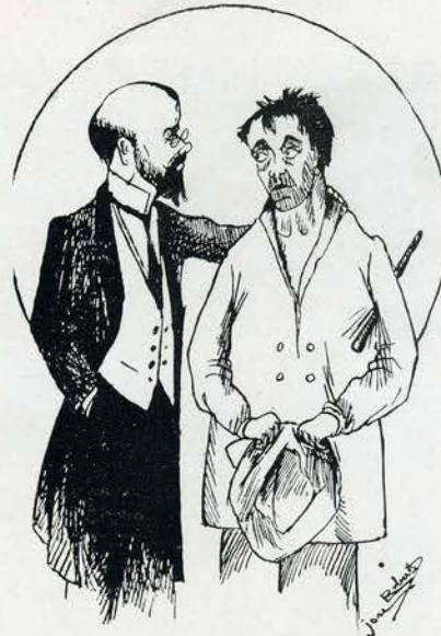
— Você ha de vêr. Vou defendel-o

Em seguida, narrou-nos que, desde que fôra servir de testemunha, co neçaram pa-