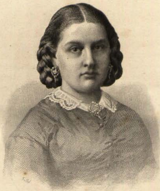
S. A. A SNRA INFANTA D. ANTONIA PRINCEZA DE PORTUGAL.