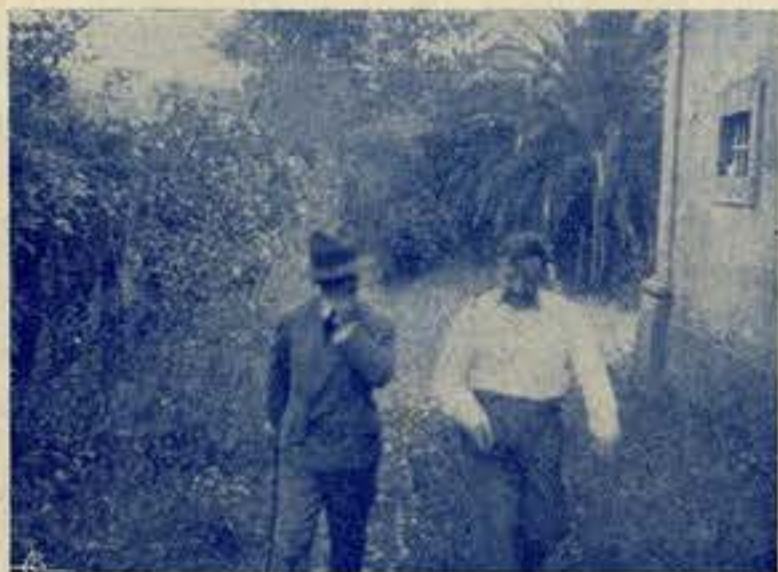
«Gulando» a vítima para a emboscada

Autopsiando uma carta de alguém, que não deseja a revisão do processo. ¡Verdades, e só Verdades!