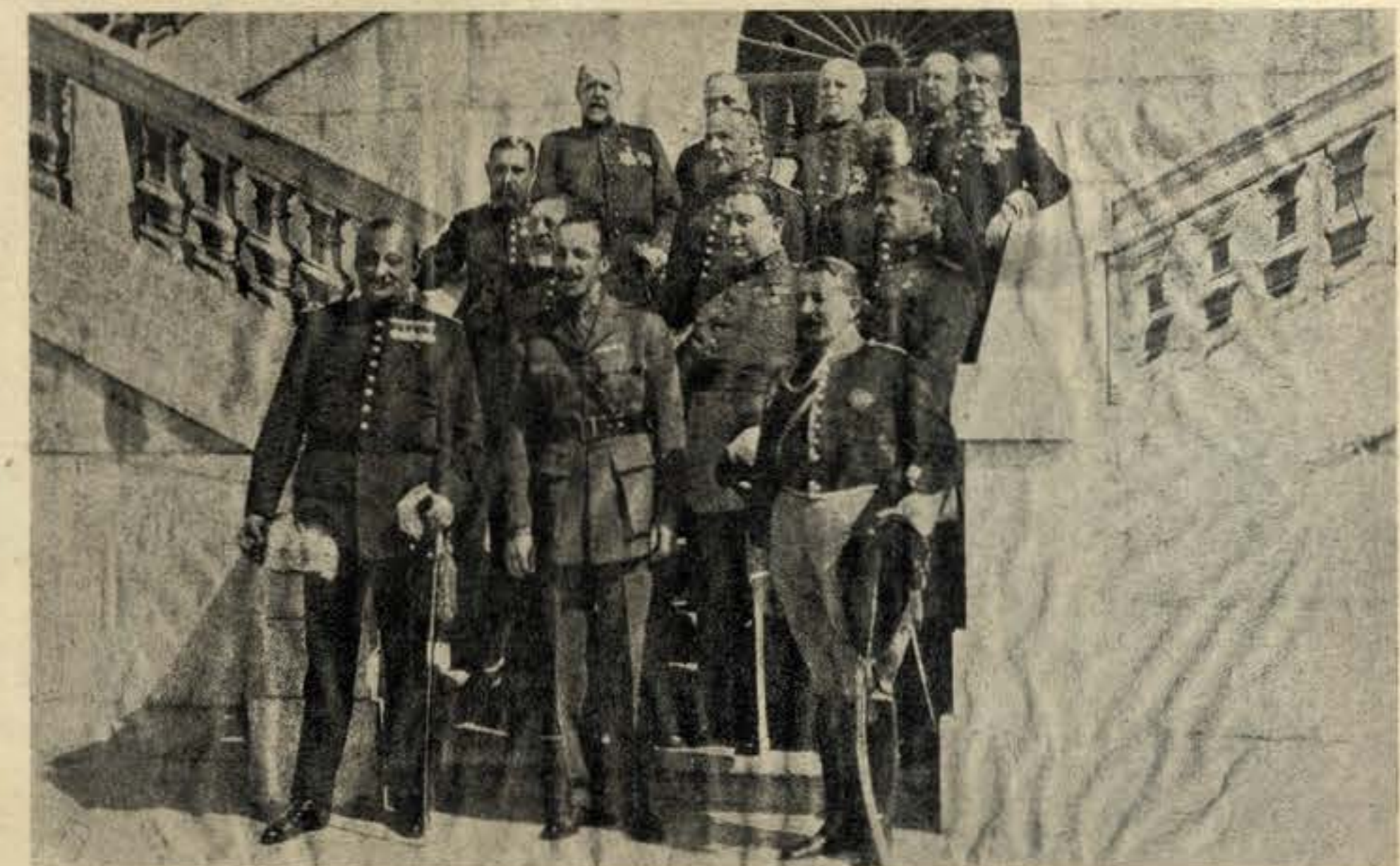
UMA FOTOGRAFIA HISTÓRICA: O Directório militar, que dirigiu os destinos da Espanha, nos últimos tempos da monarquia.