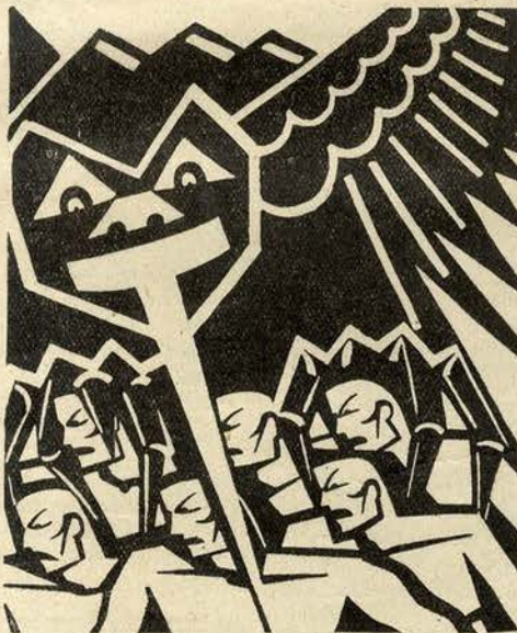
...mergulhando-lhes no coração «o bico curvo e as unhas fortes» de ave de rapina

roubar-lhe a esfarrapada camisa, que é tudo quanto possui, de sugar-lhe o sangue, que é a vida e a última probabilidade de emancipação.