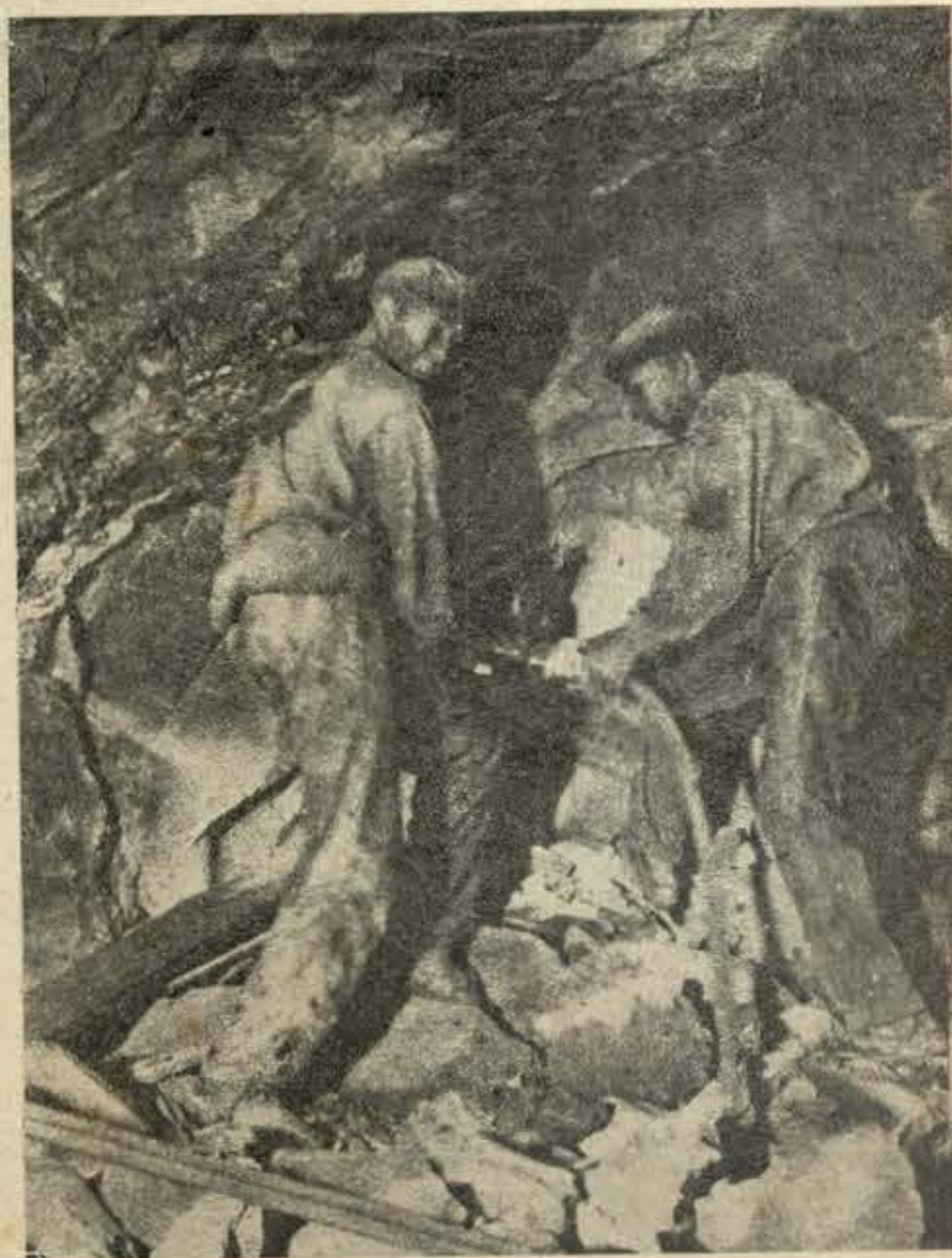
... e atiraram-se ao trabalho nas entranhas das montanhas