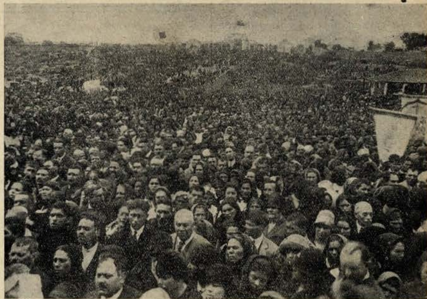
Foram a Fatima, na esperança dum milagre — e no meio da multidão dos crentes...

«—Este drama — explicou ele — tem dois grupos de personagens: com a que pertencem as victimas; outro, em que domina o algoz. Vamos ao primeiro grupo: havia um pae, enobrecido — com um titulo, de merito ou não, ignoro — mas titulo. Casado e... (dizem que os reis e os ricos teem direitos a todas as levandades, e os proprios maridos, que sejam victimas deles devem resignar-se — quando não honrarem-se — senão leiam o processo dos Tavoras...) amancebado teve do matrimonio uma filha e do padrasto um filho. Este filho — o celebre Visconde de C... (cadastrado em Lisboa, usurpador do titulo, e especie de Arsenio Lupin adaptado ao calão rufia). A filha senhora ilustre e educada entre as melhores prendas — parecia dirigida a um futuro fofô, luminoso