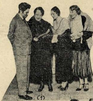
O «kodak» do X nos ensaios

Para que os nossos leitores façam uma pequena ideia do misterio e emoção desta peça