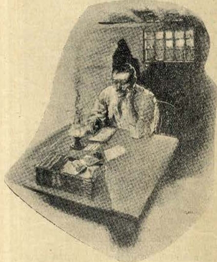
...levava consigo um guarda livros para o seu repugnante negocio

LER NO PROXIMO NUMERO: A origem da fortuna do sr. O... M...; a historia dum bilhete de loteria; o timpa calhas nababo, etc.