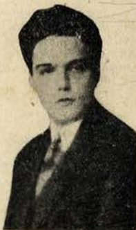
O principe Otto de Habsburgo

se chama casa de penhores. Era um sabado e havia bicha estando todos os cacifos occupados por mais dum cliente. Entrei naquêl que me pareceu menos congestionado. De facto só lá estava um joven de rosto iluminado, olhos enormes, cabelos encaracolados e atitudes aristocraticas. Ao vêr-me o joven aconchegou à volta do rosto a gola do sobretudo. Èle ia empenhar um anel de pouca valia e como lhe oferecessem cento e cinquenta florins, insistiu para que lhe dessem duzentos.