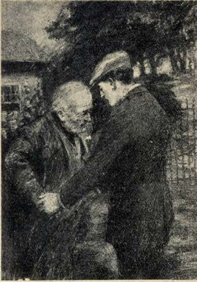
Beijou o santo velhote