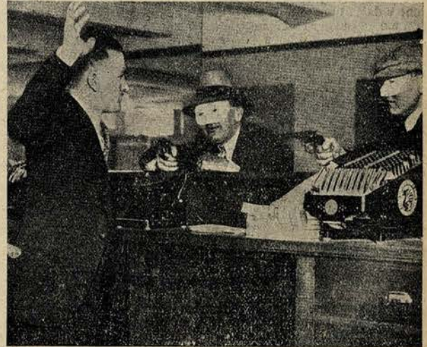
O seu retrato estava nas fichas policiaes da America, como especialista em assaltos á mão armada