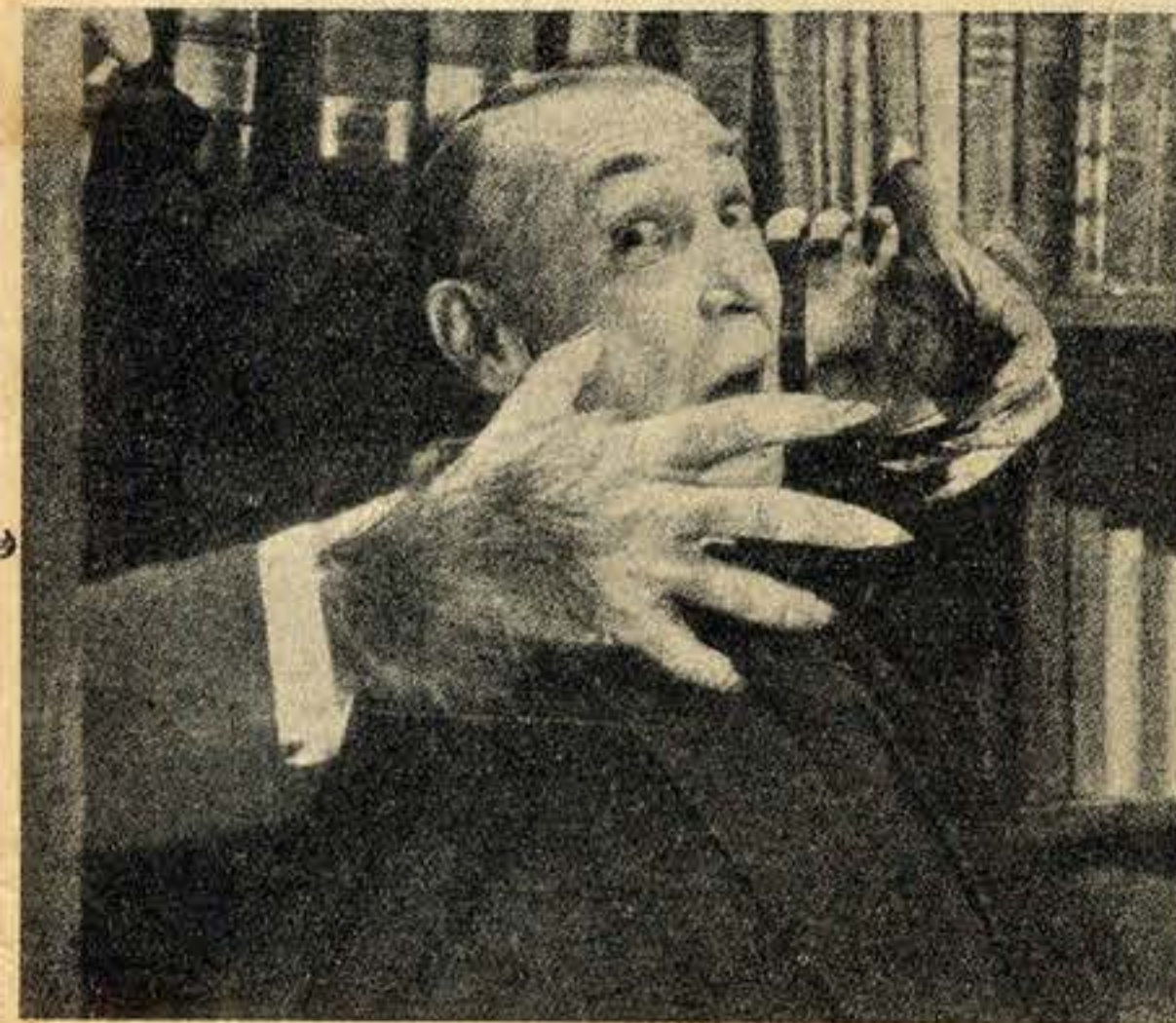
Sempre que pronunciam este nome «Fantomas» sinto como que um arrepio de terror