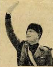
Benito Mussolini saudando as «centurias» fascistas

Um dia, o reformador resolveu quebrar as jaulas, abrir os harems, acabar com a bigamia, rasgar os veus — que as poucas que saiam á rua eram obrigadas a usar e a conceder-lhes todos os direitos sociais: o do voto, o da igualdade no lar, o de exercerem qualquer profissão, etc., etc., etc. Mas... ai! Quantas não se terão arrependido do alvorço com que applaudiram a sua propria liberdade. E' que, no tempo da escravatura os tribunais não eram feitos para elas: os juizes nunca as podiam condenar, fosse qual fosse o seu delicto — porque o unico responsavel dos seus actos, maus ou bons, eram os pais, os maridos, visto que estes dispunham de toda a autoridade sobre os filhos, sobre as esposas... Mas Kemal Pachá, ao conceder-lhes todos os direitos — sujeitou-as á responsabilidade plena das