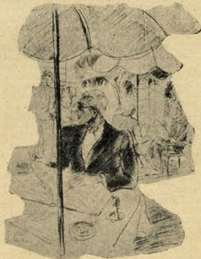
Vou Bros era o prototipo do alemão elegante