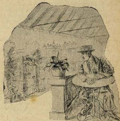
O Z... teve conhecimento dum concurso...

Quando chegou o momento do intermedio do negocio, organisador do concurso e seu responsavel abrir as cartas — declarou a todos os concorrentes que a encomenda ia ser entregue ao sr. Z... que era quem oferecia o oleo em melhores condições e a uma