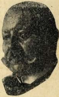
O marechal Hindenburg

Ouvi um dia, em Berlim, alg. em contar um episodio inedito da carreira de Hindenburg, e é ao recorda-lo — que faço estas afirmações. Antes de mais nada Hindenburg é o mais — plebeu dos marechais do imperio — e daí o apoio da grande massa popular alemã. O seu plebeismo é tão nobre que o obrigou a servir com suprema fidelidade o imperador — e só aceitou a presidencia da Republica quando o Kaiser o desligou de todos os compromissos morais, politicos e militares; e uma vez livre desses compromissos Hindenburg não deixará nunca derrubar a Republica, por amor á Republica, por dignidade e porque detenta o imperador! Inverosimil? Paradoxal? Ah! Não! Eu conto o episodio. Por ser plebeu, os seus meritos de militar foram sempre espesinhados pelos aristocratas que o imperador protegia, imerecidamente. Nas manobras de 1908 coube, por acaso, a Hindenburg, o comando das