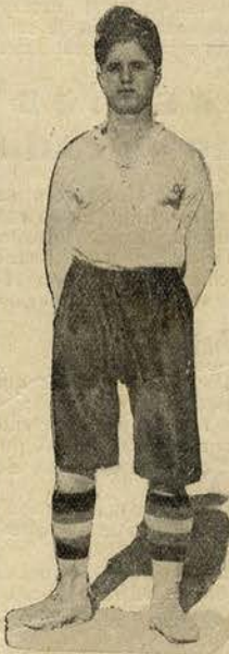
«Pepe» com a «equipe» do «Belenenses»

Se, na verdade, a morte de «Pepe» se deve ao