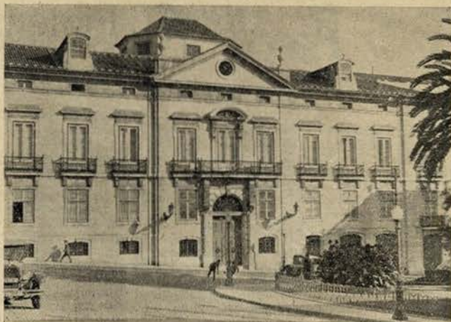
A casa do «Monteiro dos Milhões», no Largo Barão de Quintela

O «Monteiro dos Milhões» foi um dos tipos mais característicos e populares da Lisboa ancien regime , da Lisboa do Chiado, de S. Carlos, do rei D. Carlos e talvez do rei D. Luiz. Partira muito novo para o Brasil, em princípios do século passado, à busca da sombra milagrosa da árvore das patacas, e à força de inteligência e de trabalhos, e provavelmente de influência divina, a fortuna, feita dum golpe, cresceu, multiplicou-se, aumentou até alcançar proporções nababescas. A lenda tomou conta dele... Chamavam-lhe o... «Monteiro dos Milhões», dizendo-se que a própria alimentação se lhe transformava, por uma misteriosa metamorfose operada no seu aparelho digestivo, em ouro, em muito ouro. Afirmava-se que a cada movimento dos ponteiros as suas riquezas lhe rendiam contos de reis... O seu palácio de Sintra era afamado... Mas ele, sóbrio, discreto, bon bourgeois , fazendo uma existência cómoda e suave, frequentando S. Carlos e comprando quadros, era pouco atreito a ostentações e exibicionismos. Talvez gostasse, mas todos os plebeus enriquecidos, de pa-