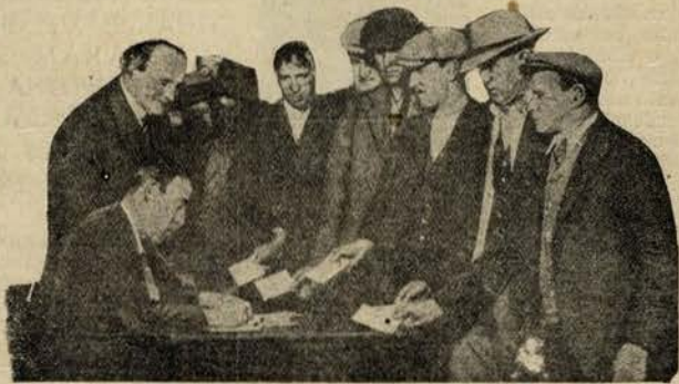
A inscrição de desempregados em um bairro de New York

Todos os países fazem um esforço financeiro enorme para socorrer os desempregados. Mas o mal alastra e ameaça assumir gigantescas proporções. Uma jornalista alemã fez em Berlim um inquérito sobre o problema do desemprego e apurou coisas espantosas. Segundo as estatísticas da Prefeitura da Polícia, 60% dos roubos cometidos em Berlim não são obra de gatunos profissionais, mas de desempregados.