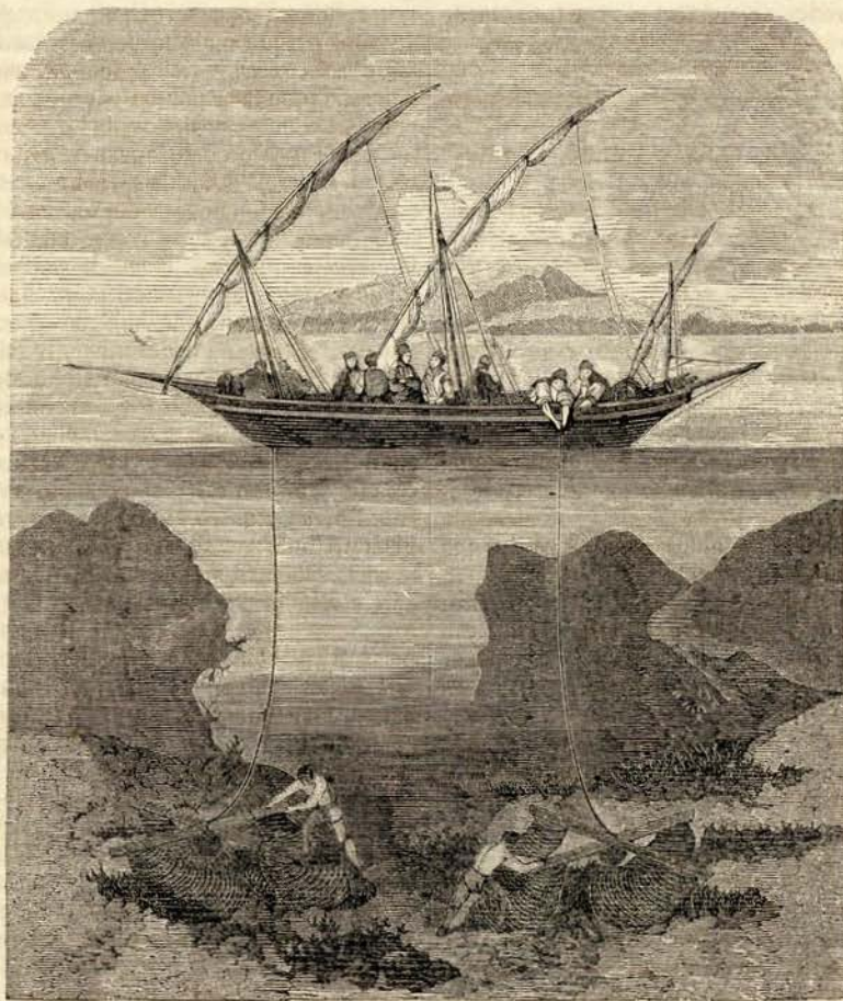
Pesca do coral

A maior parte da producção d'esta pescaria é levada a Leorne, que é o principal mercado do coral. Uma