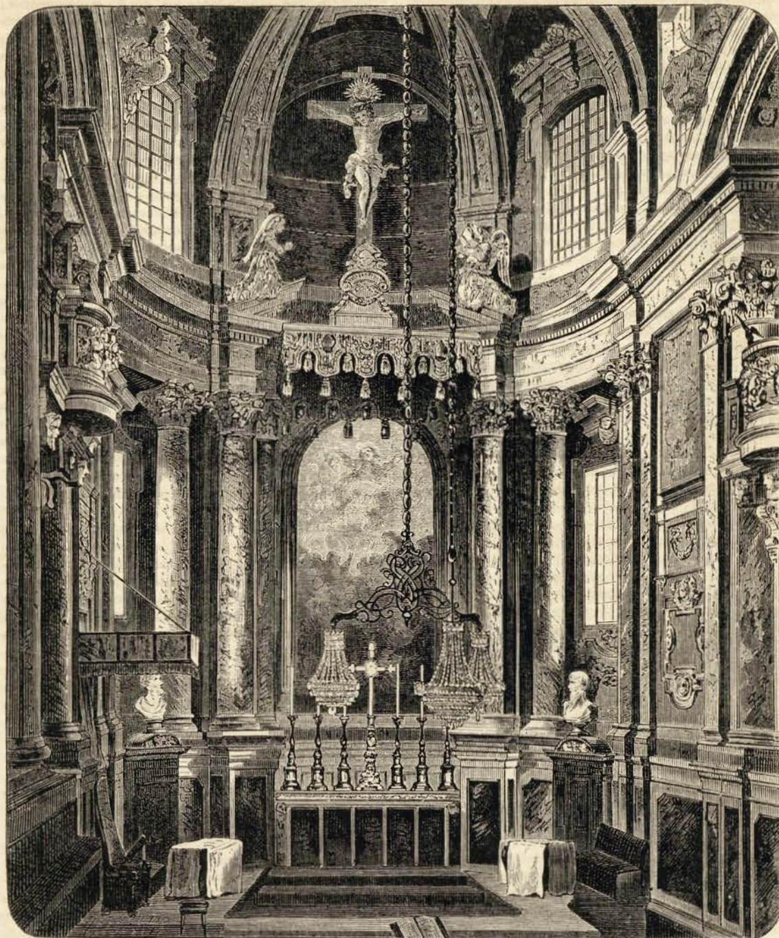
Capella-mór da sé de Evora