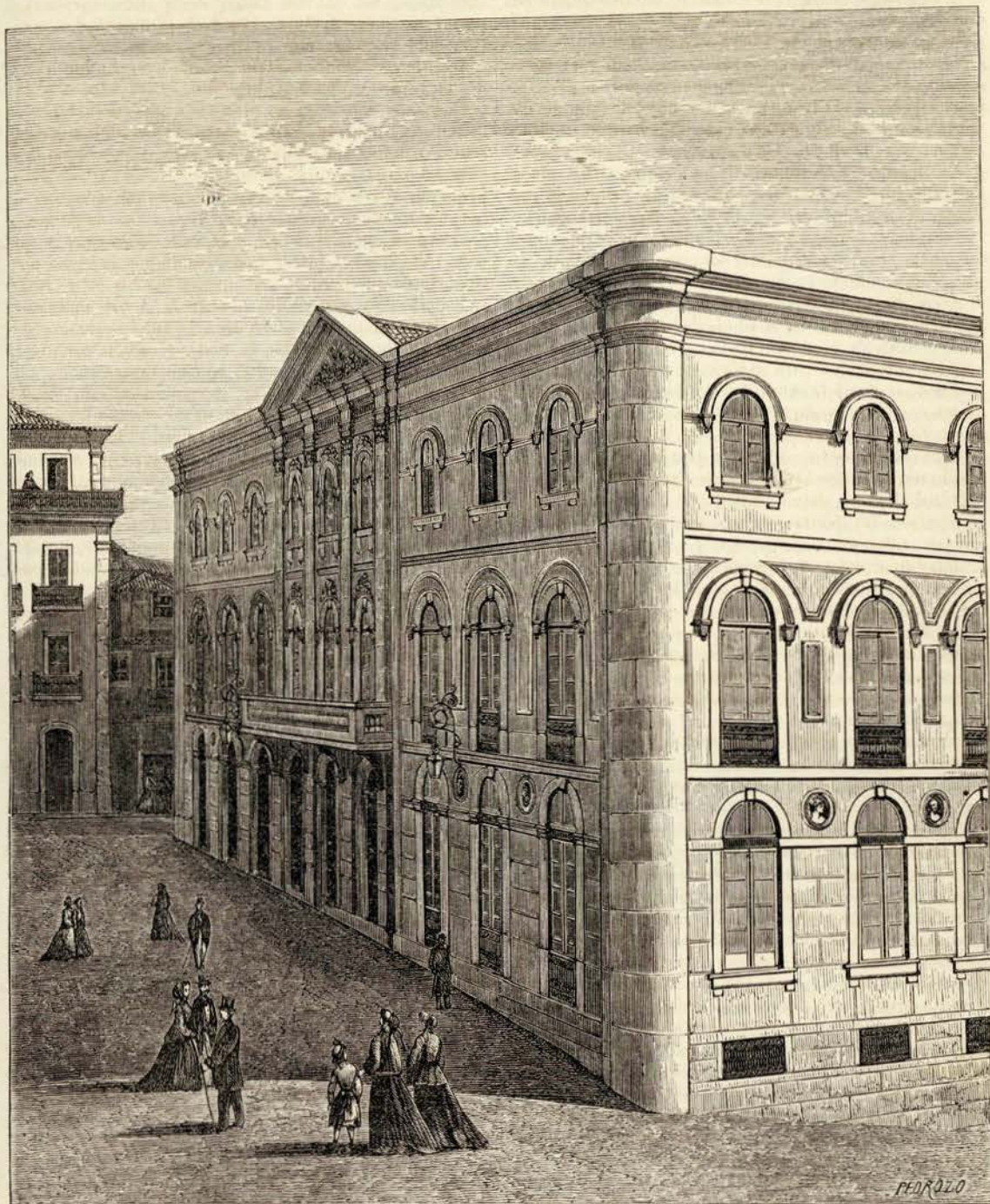
Theatro da Trindade