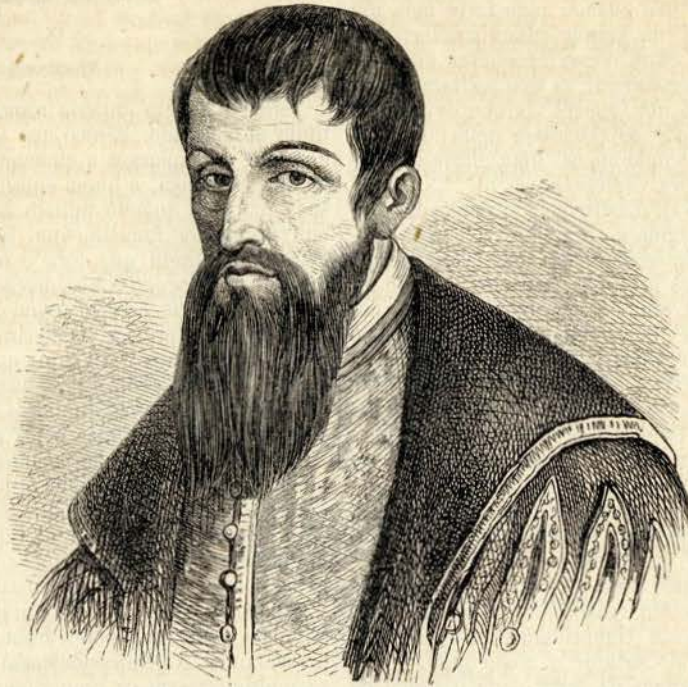
D. João de Castro