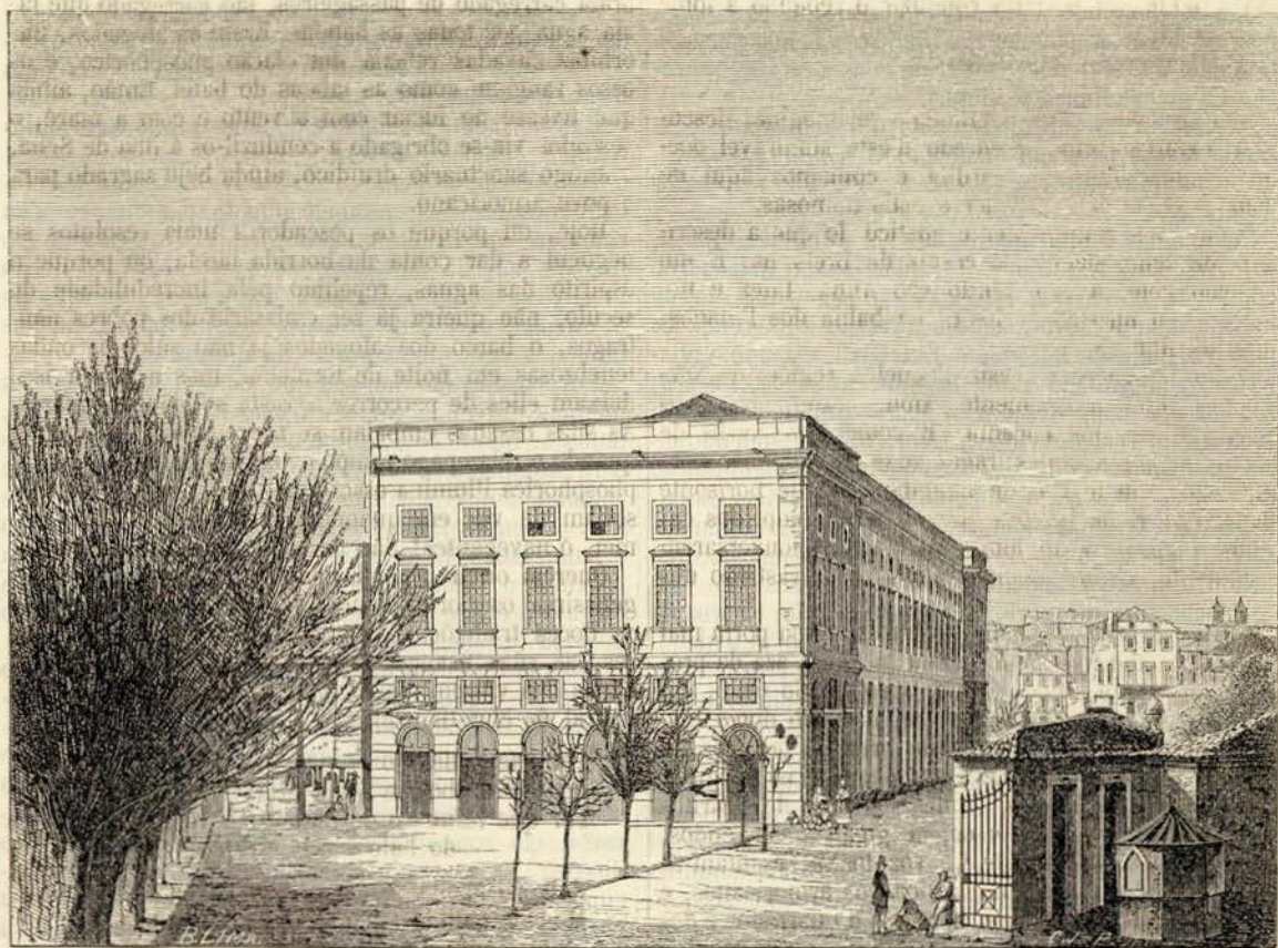
Academia polytechnica do Porto

A academia polytechnica do Porto, que até 1837 se denominou academia de marinha e commercio, foi creada por alvará de 9 de fevreiro de 1803; é em resultado de uma consulta dirigida ao príncipe regente pela companhia dos vinhos do Alto Douro. Da addição successiva de diversas aulas publicas, feita em diferentes epochas a uma aula de nautica que em 1779 já existia no collegio da Graça d'esta cidade, e da sua definitiva reunião n'um só edificio, proveu a formação d'este util estabelecimento.