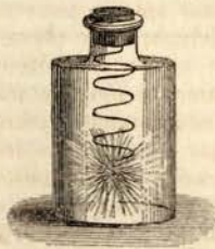
Fig. 5 — Combustão do ferro no gaz oxygeno

Hoje sabemos que a combustão é toda a combinação chimica em que ha desenvolvimento de calor e luz. Chamamos combinação chimica á combinação ou união das moleculas de dois ou mais corpos entre si, dando origem á formação de um corpo de propriedades completamente diversas d'aquellas que possuem os primeiros. Na maior parte das combustões, os corpos que ardem combinam-se com o oxygeno, gaz que existe no ar. O gaz oxygeno, misturado com o gaz azote nas proporções de 21 para 79 proximamente, constitue o ar atmosferico. Quando, por exemplo, o carvão arde no ar livre, combina-se com o gaz oxygeno do ar, e fórma um gaz denominado acido carbonico, e esta combinação é acompanhada de desenvolvimento de calor e luz, e, portanto, produz-se o fogo. Quando o gaz hydrogeno arde no ar, combina-se com o oxygeno, forma-se a agua que apparece no estado de vapor, e desenvolve-se calor e luz. Quando o phosphoro se queima ao ar livre, combina-se com o oxygeno, formando o acido phosphorico, com desenvolvimento de luz e calor, etc. Se estas combustões, em lugar de se fazerem no ar, se fizerem no oxygeno puro, a vivacidade da acção chimica será muito maior, porque a presença do azote no ar modera a acção do oxygeno. Assim, se introduzirmos n'um frasco de vidro, cheio de gaz oxygeno secco e puro, fragmentos de phosphoro, ou enxofre, ou uma espiral de fio de ferro, etc., tendo apenas um ponto em ignição, veremos as combustões activarem-se immensamente, produzindo-se um fogo muito intenso e brilhante.