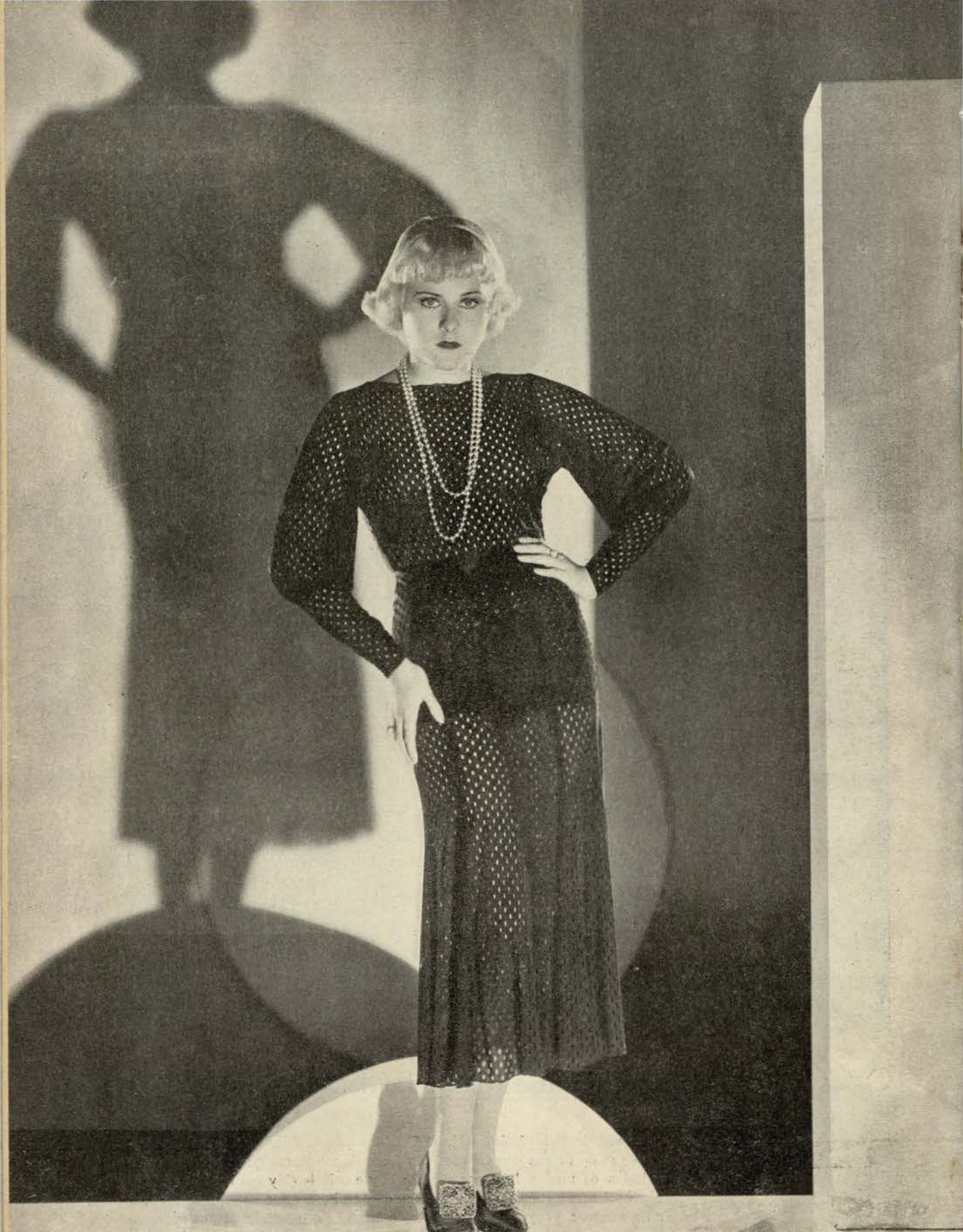
CONSTA EM HOLLYWOOD QUE PAULETTE GODARD, DAS HAL ROACH COMEDIES, VAI CASAR COM CHARLIE CHAPLIN O QUE VAI COM CERTEZA É SER A «LEADING-LADY DO FILME DE CHARLOT.