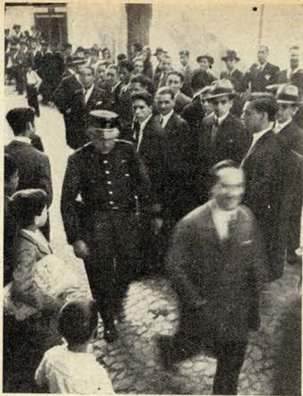
Foi tal a aglomeração de curiosos á porta do Automóvel Club que se tornou necessária a intervenção da policia

O Cottinelli, transtornado com a recordação, continuava: «E o pior, percebes tu, o pior é que as raparigas não estavam á vontade, enchiam-se de nervos e prejudicavam-se com isso. Cheguei mesmo a ficar surpreendido com algumas concorrentes que eu conhecia e tinha aconselhado a concorrer.