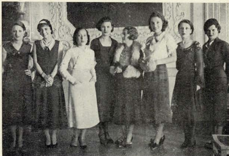
Algumas das duzentas e tantas concorrentes que apareceram no Automóvel Club