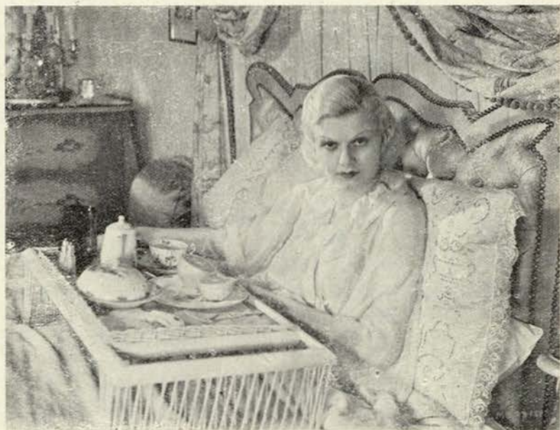
Um dos maiores prazeres de Jean Harlow é tomar o primeiro almoço na sua cama estofada