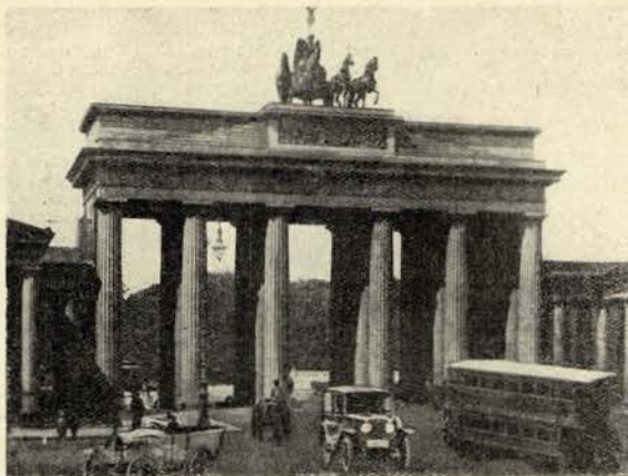
A famosa Brandenburger Tor

Já repararam que os dias vão passando e que cada vez está mais perto o famoso dia 13 de Junho, famoso não só pela tradicional festa de Santo António mas, também, porque nele se realiza o sorteio dos prémios que «Animatógrafo» reuniu para oferecer aos seus assinantes.