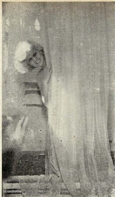
Jean Harlow surpreendida no seu «show-bath-matinal». Garantimos que, por detrás do véu, Jean está tal qual veio ao mundo — em mais desenvolvido

Perguntámos a Jean Harlow se voltaria a casar... Eis o que ela nos disse além do publicado no nosso número anterior: