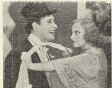
Monroe Owsley, Joan Crawford e Pauline Frederick no cine drama americano «Esta idade moderna!..»