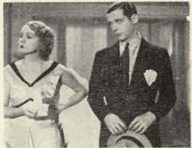
Florelle, Fernand Gravey e Baron Fils na cine-opeleta franco-americana «O Filho Improvisado»