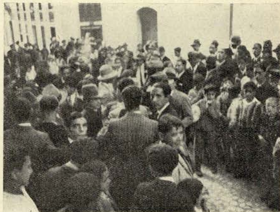
Um aspecto da multidão á porta do Automóvel Club, preparando-se para assistir á parada das cinéfilas