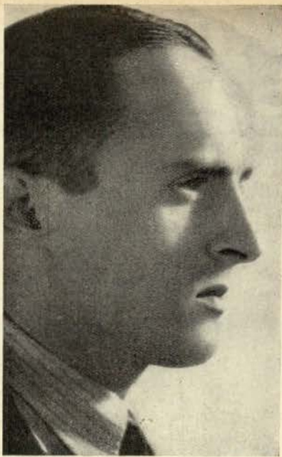
O perfil de René Clair