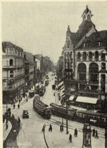
O Spittelmarkt de Berlim

Além dos prémios, descontos, etc. a assinatura reduz em 20 por cento o custo de cada número.