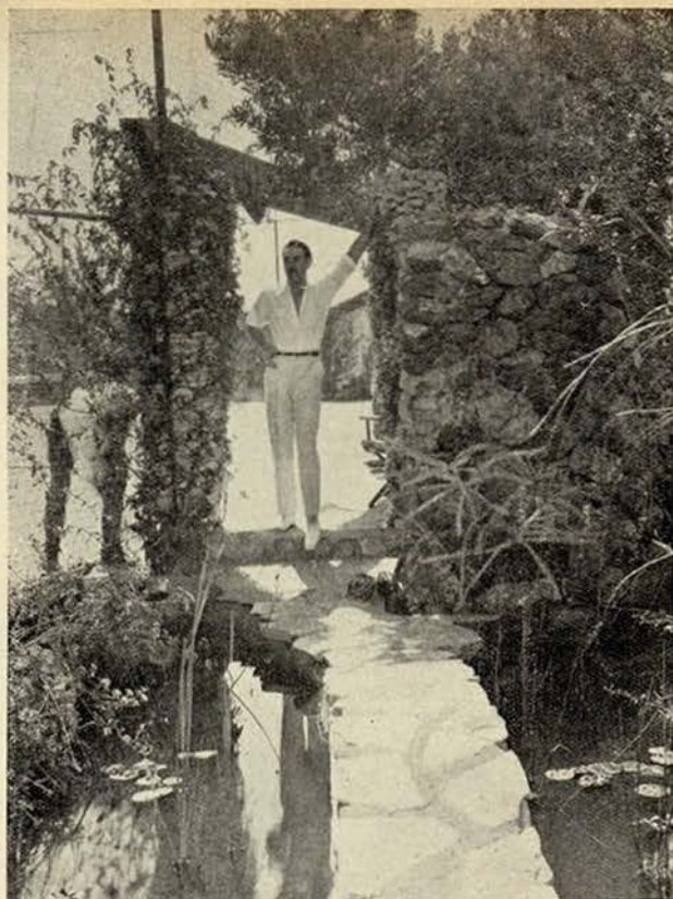
John Gilbert, homem-fatal, na sua casa de Beverly Hills

Actualmente, quer vocês queiram quer não, ainda há quem morra de amor. Bem sei, no entanto, que os cépticos, os indiferentes, os viajantes apressados da vida de hoje, recebem muito mais um atropelamento fulminante do que a na afectividade venenosa e fatal. Nem toda a gente que vive o nosso tempo, que interpreta o século XX, se decide, porém, a andar apressadamente. Ainda há contemplativos, sentimentais, viciosos incuráveis dos roubos do coração e dos deliquios românticos; ainda há vagarosos transeuntes que, nos passeios da vida, estacam embevecidos diante de uma imagem, real ou imaginária, perdendo-se no suicídio quando ela se afasta irremediavelmente.