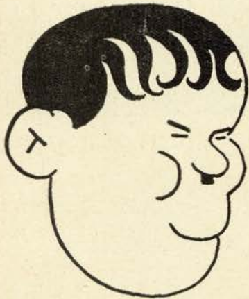
OLIVER HARDY, visto por Ex