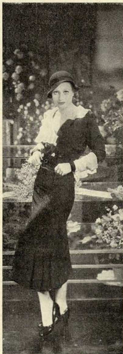
Joan Crawford também tem mortes na consciência