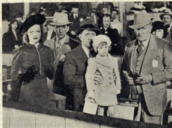
Esta é uma imagem da engraçada história duma menina que deu sorte a dois jogadores azarentos...