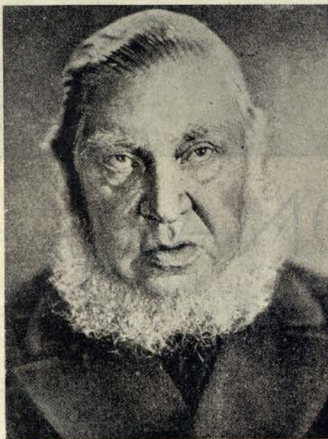
Emil Jannings na sua flagrante caracterização de Ohm Kruger, no filme do mesmo título