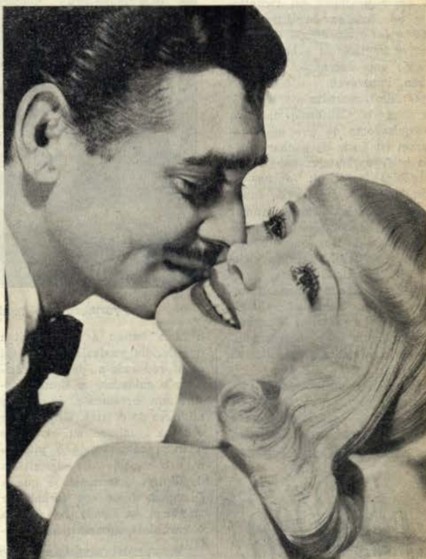
Clark Gable e Norma Shearer já tinham trabalhado juntos em «Idiot Delights», como devem lembrar-se

grande envergadura, falando-se no entanto em dois nomes, o de Clarence Brown e o do realizador de «Gone with the wind», Victor Fleming.