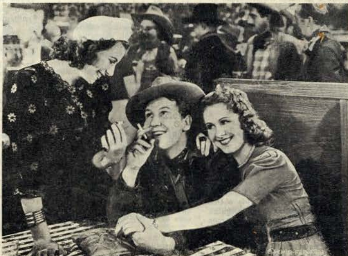
Uma cena da obra-prima realizada por Lewis Milestone e interpretada por Betty Field, Burgess Meredith e Lon Chaney Jr. que «Animatógrafos» e a Sonoro-Filme vão, brevemente apresentar ao público apreciador do bom Cinema, pois trata-se, na realidade, dum filme de excepção