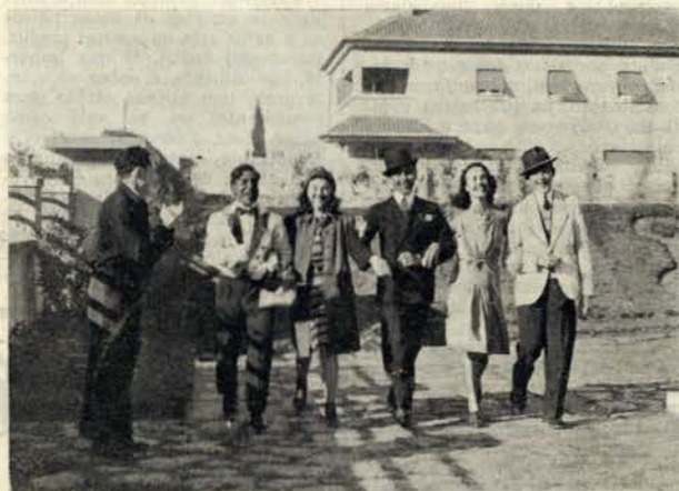
Após um dia de filmagem, os intérpretes de «Chá das Cinco» regressam satisfeitos pelo trabalho obtido