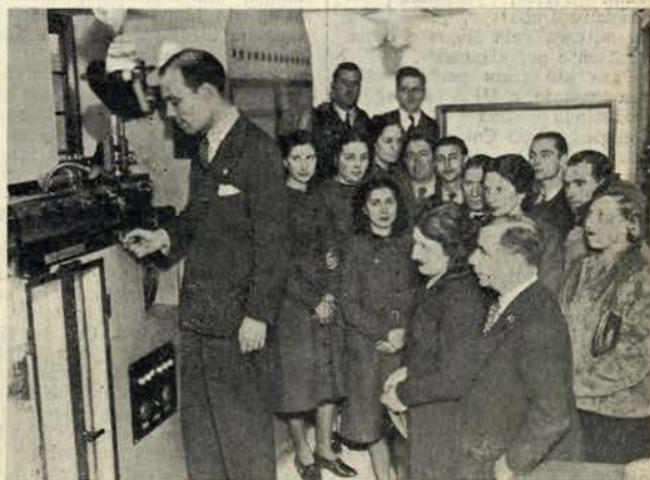
O presidente do Sindicato N. dos Profissionais de Cinema dá o impulso inaugural à máquina da Ulysses-Filme, nas suas novas instalações. No próximo número daremos o relato dessa festa.