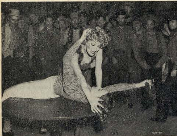
Uma cena de grande realismo que mantém em respeito não só a figuração, mas também o espectador

Há muitos anos, estreou-se, no Odéon, uma película muda, que se intitulava «A Princesinha Olálá» e que tinha por protagonista certa vedeta, nessa altura tão apreciada como hoje, por exemplo, o é Norma Shearer. Chamava-se ela Carmen Boni e era uma jovem italiana, casada com o director Augusto Genina e que trabalhava muito em estúdios alemães. Aliás, germânica também era essa «Princesinha Olálá», comédia singela, de curto fôlego.