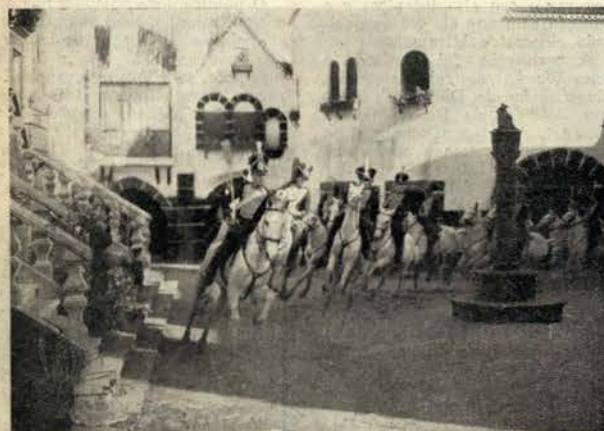
Uma das primeiras cenas filmadas foi, num cenário magnífico dum largo antigo, uma impetuosa carga de cavalaria

Damos hoje, em primeira mão, duas fotografias de cenas do filme «Maria da Fonte», que Leitão de Barros principiou há dias a dirigir. Trata-se duma primeira volta de manivela — e como tal arquivamos com satisfação estes documentos — a que se não seguirá tão cedo a segunda volta de manivela, pois Leitão de Barros vai agora tratar doutra produção, «Ala, arriba», a que «Animatógrafo» deu já todo o relêvo que merece. «Maria da Fonte», cujas primeiras cenas filmadas se desenrolam no cenário maravilhoso do Bairro Comercial da Exposição de Belem, só deve voltar à baía no fim do ano, no dizer do seu realizador. Todo o material que serviu às cenas registadas — e em que intervieram soldados de cavalaria e centenas de figurantes — ficou à guarda da Tobis Portuguesa, para servir mais tarde, quando «Maria da Fonte» entrar nos estúdios. Estas fotografias documentam o leitor sobre o filme há dias principiado. Nêe encontramos as características habituais dos filmes de Leitão de Barros que lhe deram maior popularidade.