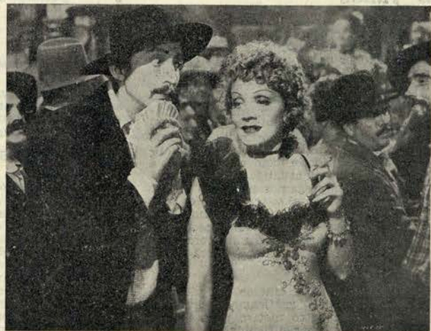
Misha Auer, o famoso cómico, tão querido das nossas plateias, tem uma excelente criação na «Cidade Turbulenta»