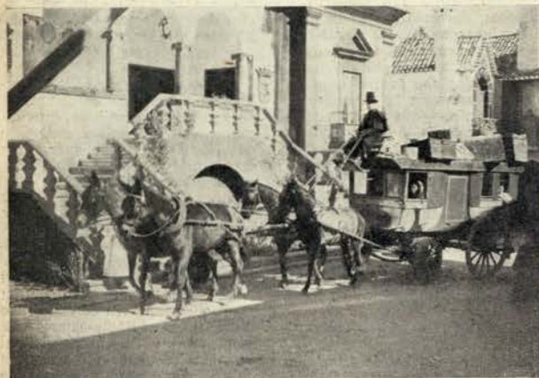
Quem parte leva saudades, quem fica saudades tem... ¿Uma diligência que chega, ou uma diligência que parte?