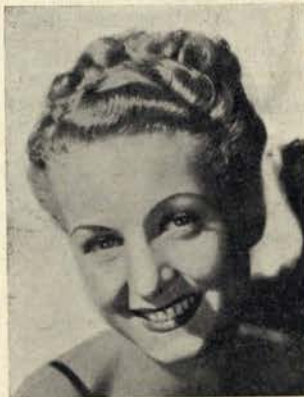
DANIELLE DARRIEUX está completamente paralizada. Os nomes dos seus artistas deixa-

Daniëlle Darrieux deve dentro de dias passar por Lisboa, a caminho da América, onde a espera um contrato com a RKO-Radio Filmes.