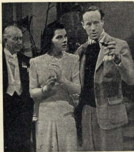
Leslie Howard dá as últimas indicações a Mary Morris

Alexander Korda mandou construir para a London Film, um novo filme.