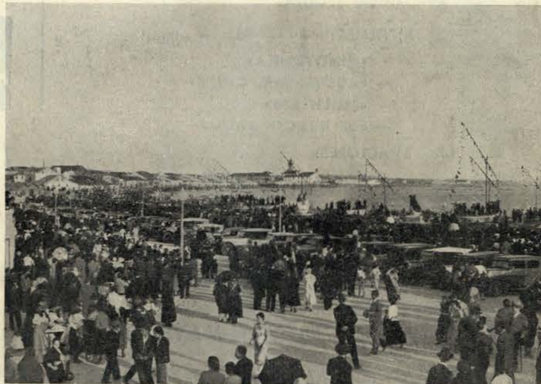
Um aspecto da Procissão da Assunção, que será reconstituída com grande esplendor pelo realizador de «Maria do Mar» e pelo dramaturgo de «Tá Mar», duas autoridades na matéria