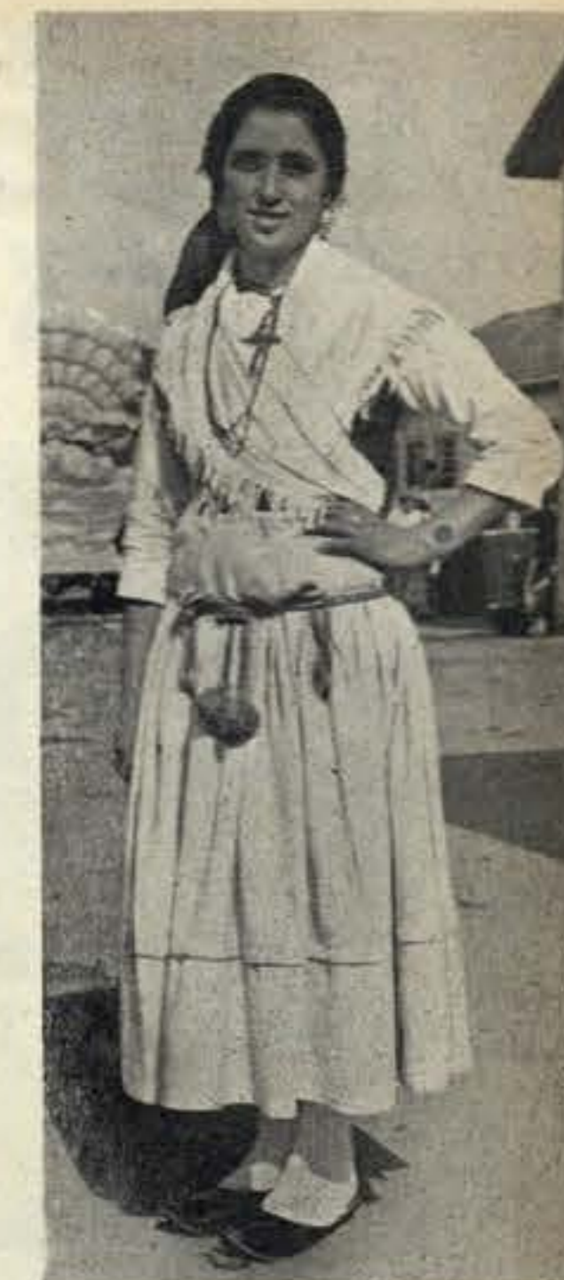
Uma rapariga do «Rancho da Póvoa», com o seu lindo traje branco

Fala-se em 15 de Março, para dar, na Póvoa, a primeira volta de manivela de «Ala, Arriba!» (não garantimos que seja assim a ortografia definitiva do título,