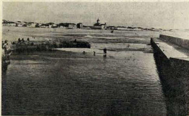
A Póvoa de Varzim, a mais «atlântica» das nossas praias, com a linda igreja da Assunção, que se vê ao centro da gravura, é o cenário principal do próximo filme de Leitão de Barros e Alfredo Cortez