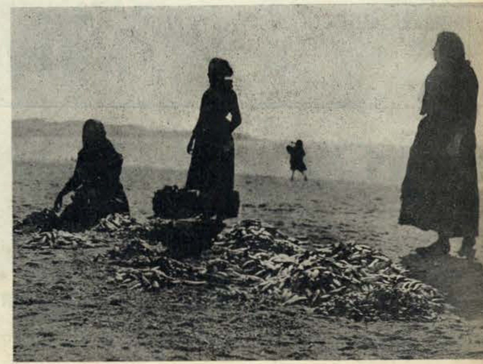
Sardinha viva! Três vultos de pescadeiras recortam-se no horizonte soberbo do Atlântico, apregoando o peixe que os maridos trouzeram do mar