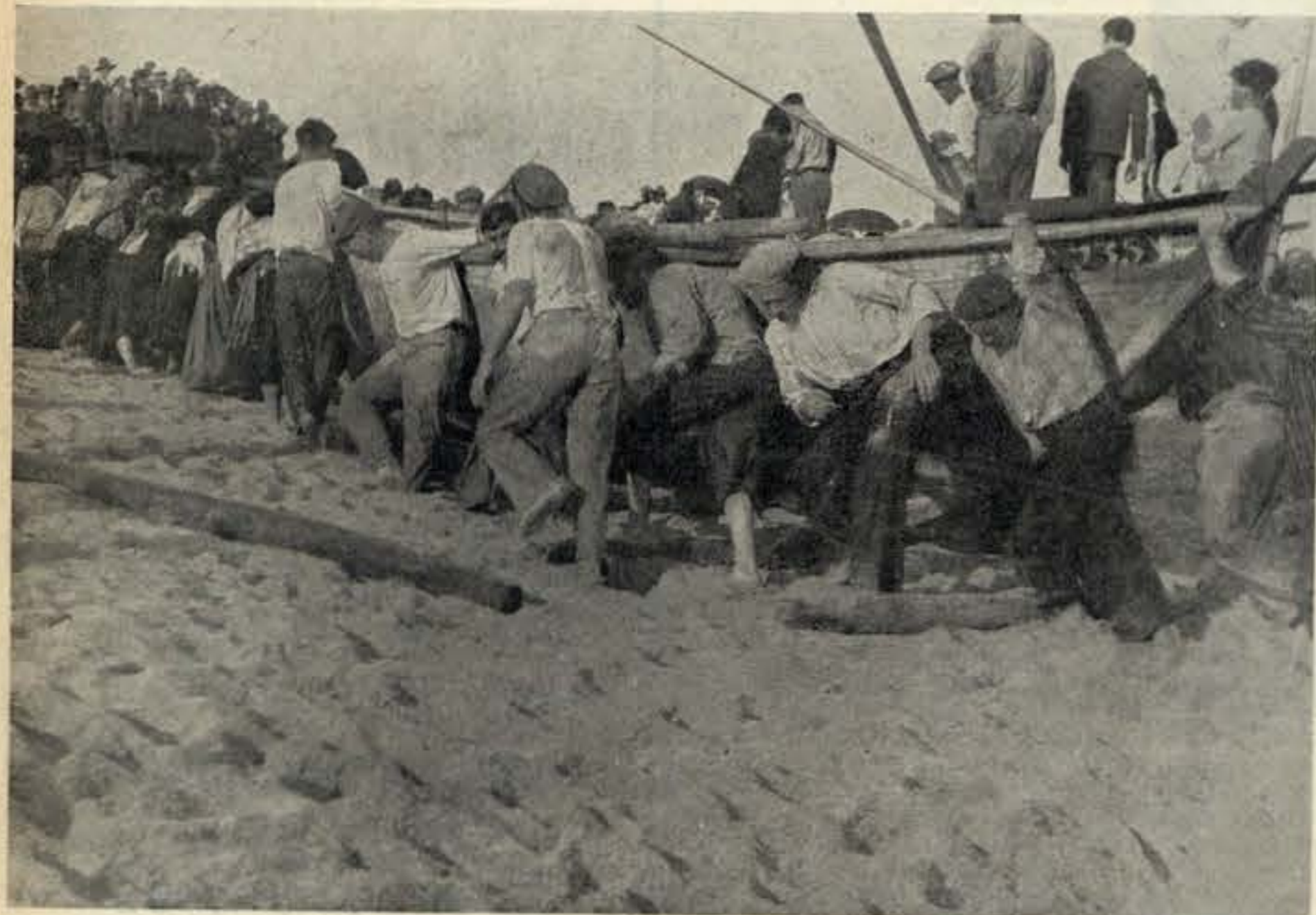
«Ala, Arriba!» É o grito poveiro que incita os homens da «companha» a levarem os barcos para a praia, onde ficam na areia, entre duas viagens

«Animatógrafo» passeia os seus leitores pelos ambientes poveiros em que decorrerá parte da nova produção portuguesa de Leitão de Barros e Alfredo Cortez, patrocinada pelo Secretariado da Propaganda Nacional