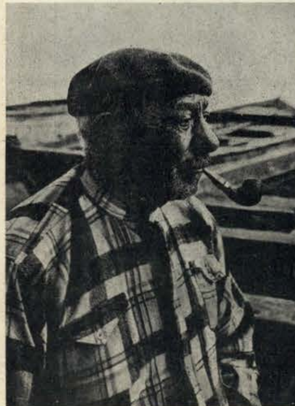
Um velho poveiro, que trocou o antigo barrete pela boina galega. Mas, se entrar no filme, usará barrete