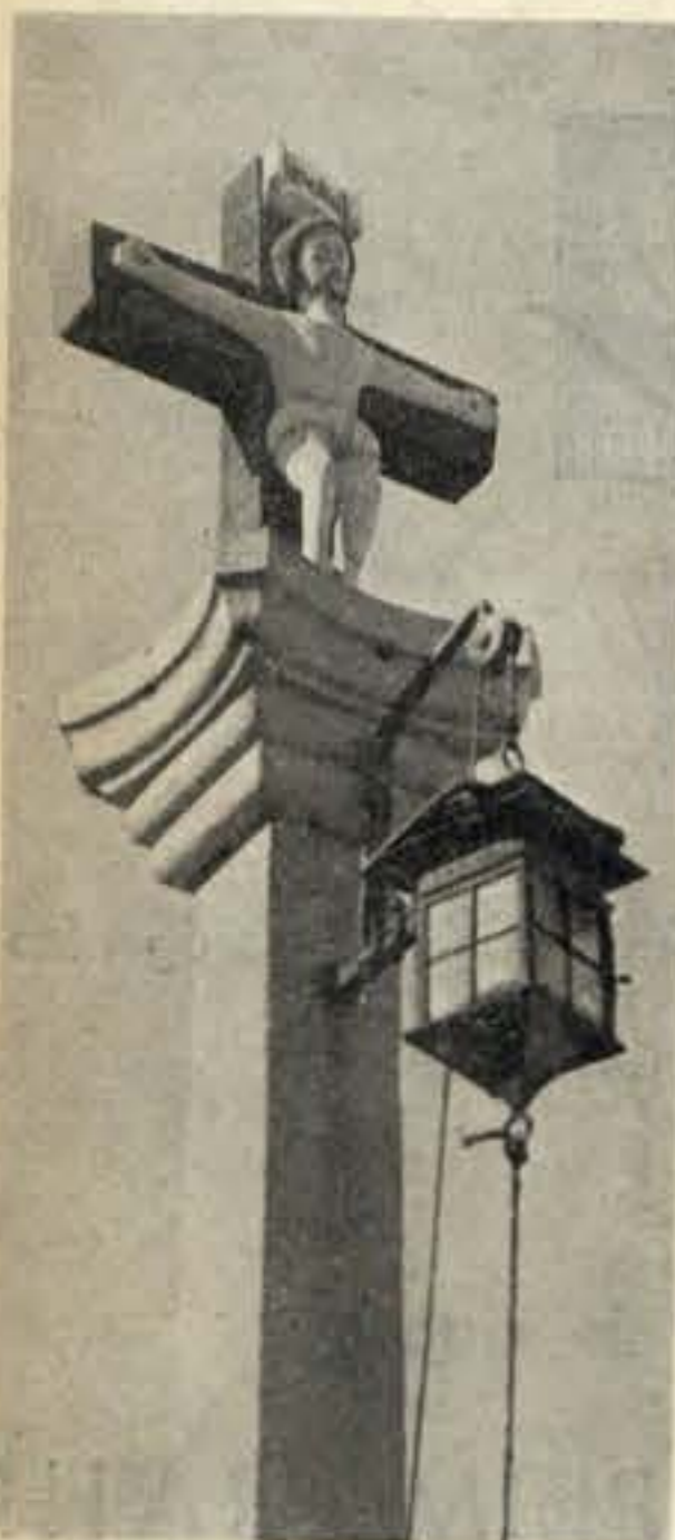
O Cruzeiro da Praia protege os pescadores poveiros na sua faina