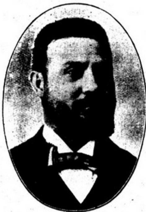
TOMÉ DE BARROS QUEIROZ ministro das Finanças

O sr. dr. Paulo Falcão é advogado muito conhecido no Porto por onde foi eleito deputado numa das legislaturas da monarchia. Foi também governador civil daquele distrito quando se proclamou a Republica.