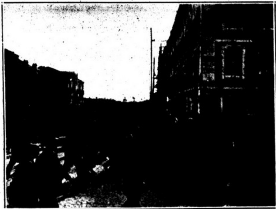
REVOLUCIONARIOS A CAMINHO DA CAMARA MUNICIPAL.