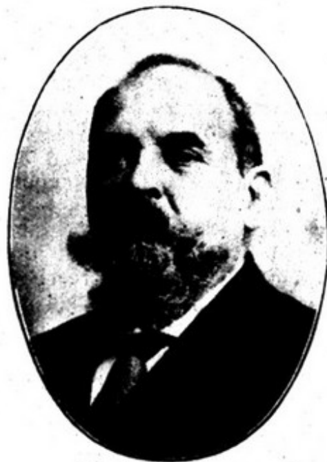
DR. JOSÉ DE CASTRO ministro da Guerra