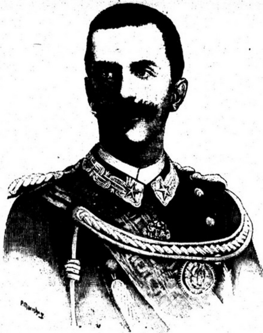
VICTOR MANUEL II, REI DE ITALIA

A Allemanha porém tenta deter a marcha italiana. O Chanceller do imperio, no Reichstag, diz que possuido do desejo de manter as relações amigaveis com a Italia, a Austria tinha feito as seguintes amplas e importantes concessões; 1.º Cederia a parte italiana do Tyrol; 2.º Igualmente a Morgan de Oeste do Isonza, com Gradisca, em quanto a população fosse italiana; 3.º Trieste seria elevada a cidade imperial, recebendo municipalidade com caracter italiano e universidade italiana; 4.ª seria reconhecida a posse de Vaulona e ficaria considerada esphera de interesse italiano a região pertencente; 5.º a Austria declararia o seu desinteresse politico na Albania; 6.º receberiam consideração especial os interesses nacionaes italianos na Austria; 7.º Amnistia para todos os crimes militares e politicos nos districtos cedidos; 8.º teriam tomado em benevola consideração os mais desejos italianos quanto aos assumptos que se ligam com o conjuncto de convenio; 9.º Depois de concluido o convenio a Austria declararia solemnemente a cedencia; 10.º Formar-se-hiam commissões mixtas para regular sobre os particulares da cedencia; 11.º Depois da cedencia, os soldados naturaes dos districtos cedidos não continuariam combatendo na actual guerra. O leal cumprimento d'este convenio seria expressamente garantido pela Allemanha. O Parlamento e o povo italiano poderão