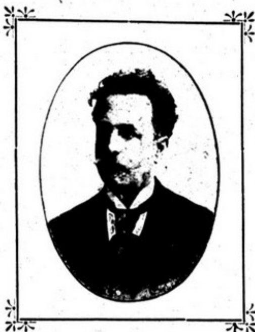
DR. SEBASTIÃO DE MAGALHÃES LIMA ministro da Instrução