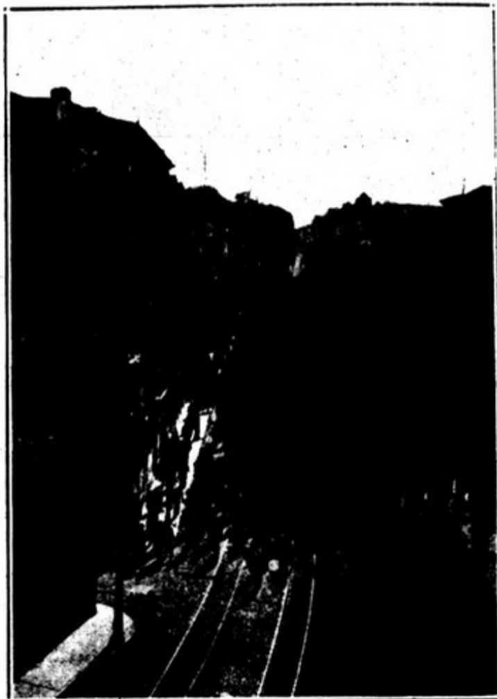
REVOLUCIONARIOS PASSANDO NO LARGO DO CONDE BARÃO

Resultaram varias mortes, muitos ferimentos e grandes estragos nos predios circunvisinhos do Alto de Santa Catarina.