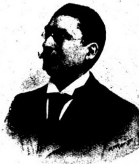
DR. TEIXEIRA DE QUEIROZ ministro dos Estrangeiros