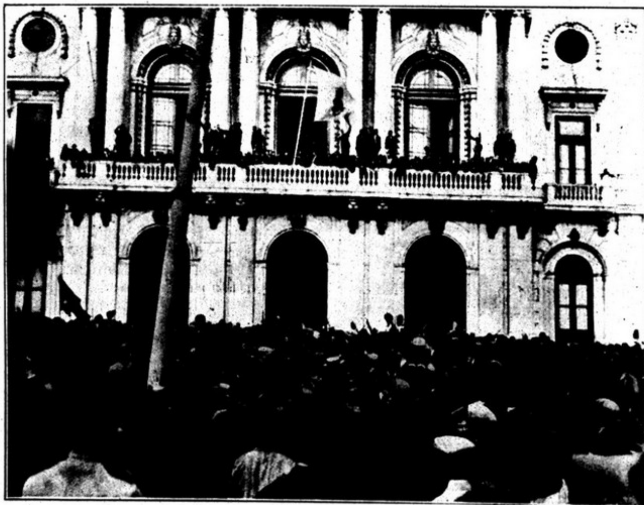
PROCLAMAÇÃO DO NOVO-GOVERNO NA CAMARA MUNICIPAL.