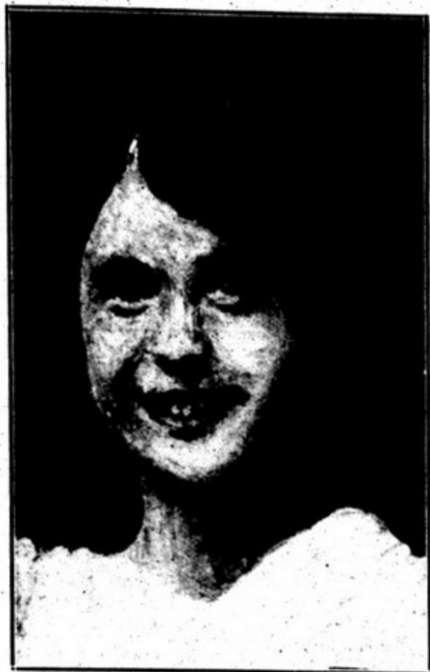
Quadro de Julio Victorino