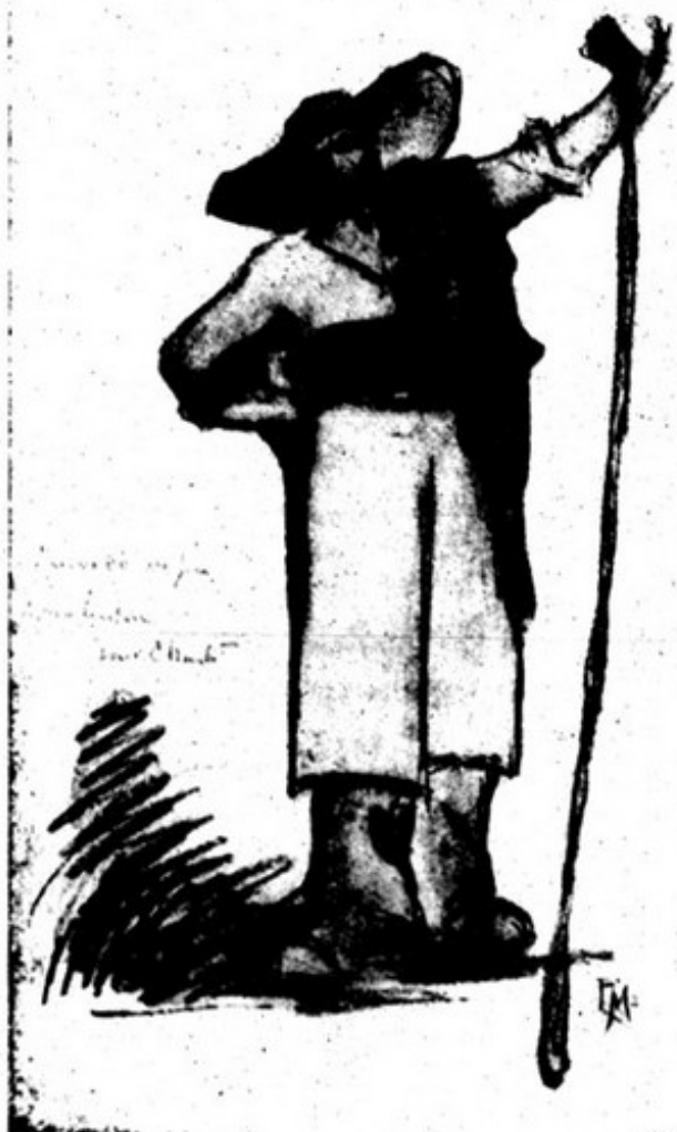
(Desenho de José Pacheco)

E n'aquella magnificencia de festim pagão que os envolvia, n'aquellas vertigens da Altura, — trepando, trepando, té parecia que era o Ceu a descer para