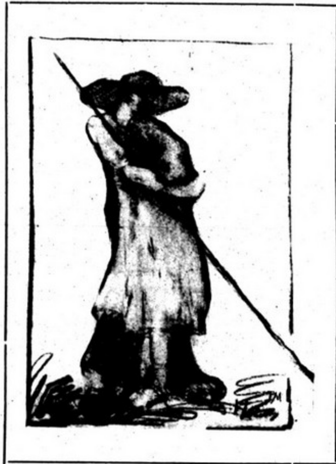
(Desenho de José Pacheco)

elles. Enchiam se-lhes os peitos de infi- nito.