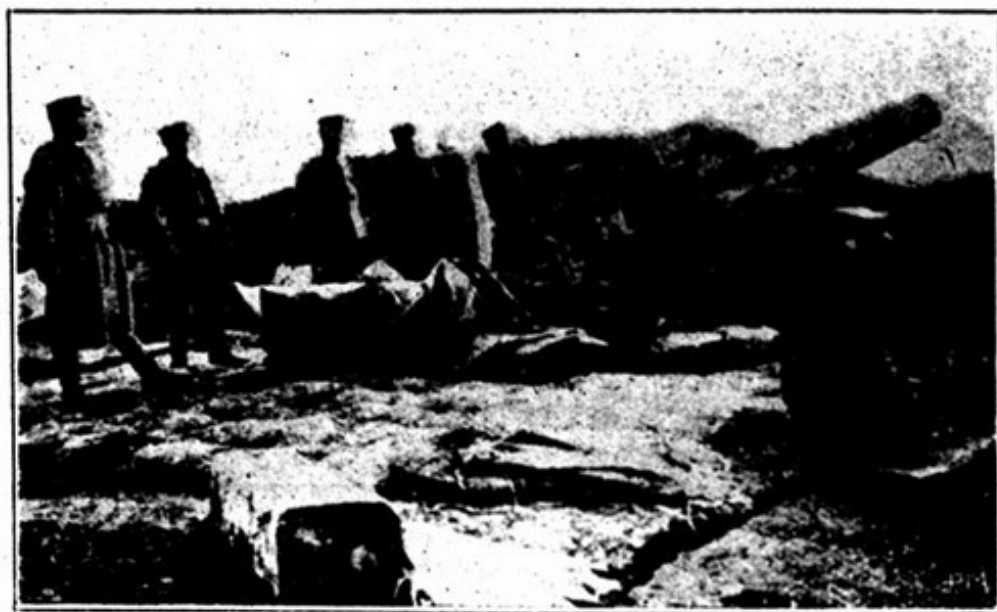
DEANTE DE TSING-TAO — BATERIA JAPONESA RECEBENDO ORDEM PELO TELEGRAPHO DE COMEÇAR FOGO