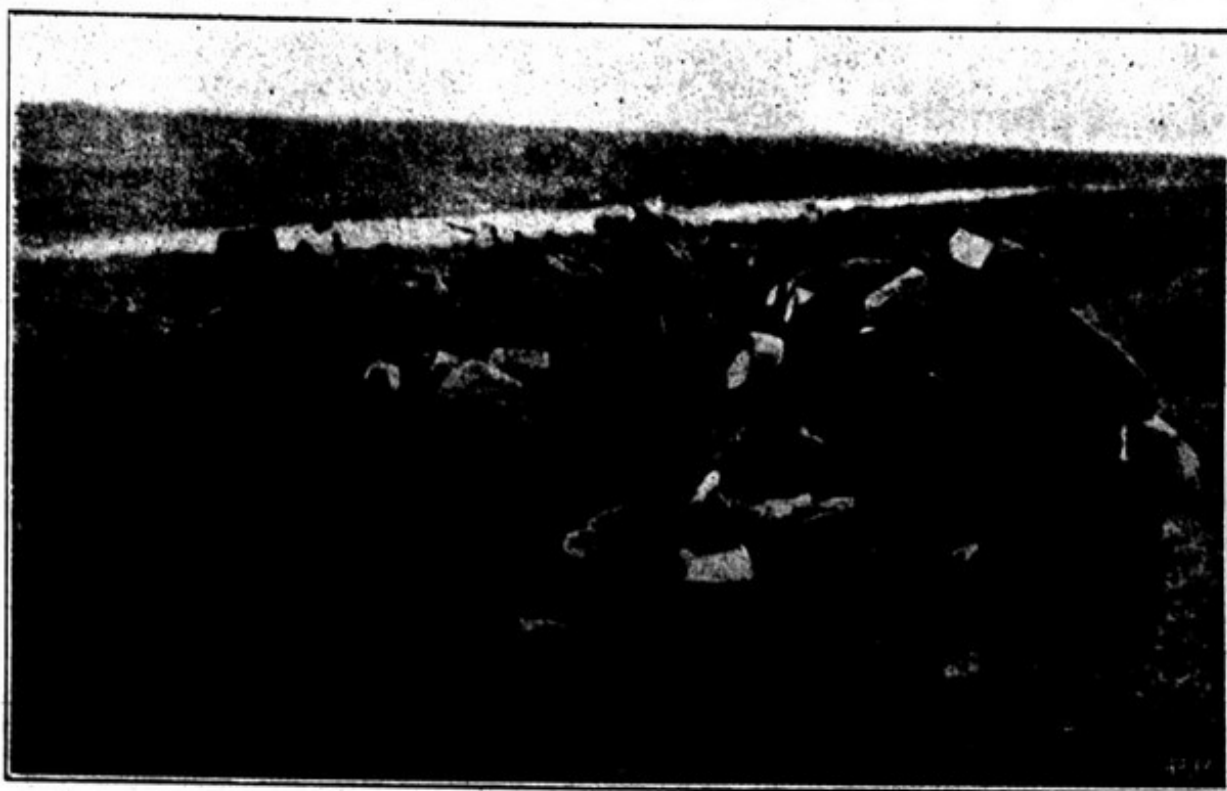
NATAL NAS TRINCHERAS. FRANÇEZAS. PUDING DO NATAL

Este plano da Alle-manha determina o es-forço gigantesco da In-glaterra empenhando-se em evitar que os al-lemães estabeleçam a base definitiva e efficaaz para os seus emprehen-dimentos, submarinos em Ostende e Zeebru-gge , os pontos de apoio navaes de que carecem para levarem por dian-te o seu plano de ata-que e bloqueio á Ingla-terra.