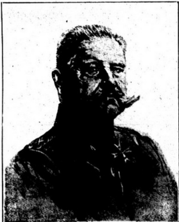
MARECHAL-DE CAMPO ALEMÃO VON HINDEMBURG

victórias foram entusiasticamente anunciadas pelo gran duque Nicolau ao general Joffre.