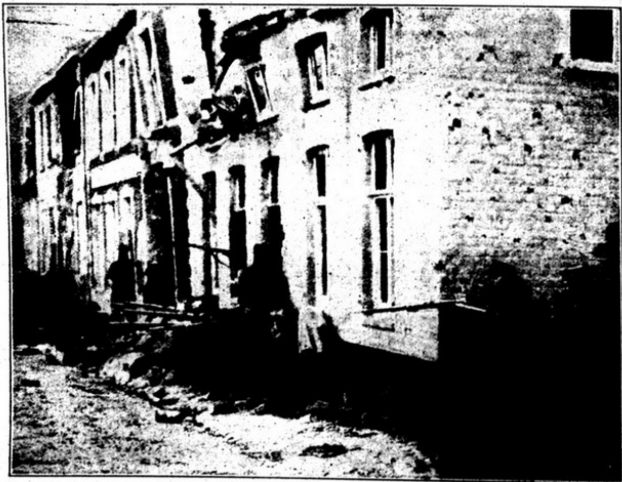
EM LOMBAETZIDE, A N. E. DE NIEURPOT, OS SOLDADOS DEFENDEM, CASA POR CASA, A ALDEIA BELGA

Wilm , está disposto a obrigar a Inglaterra a respeitar as reclamações justas que os Estados Unidos lhe forçam.