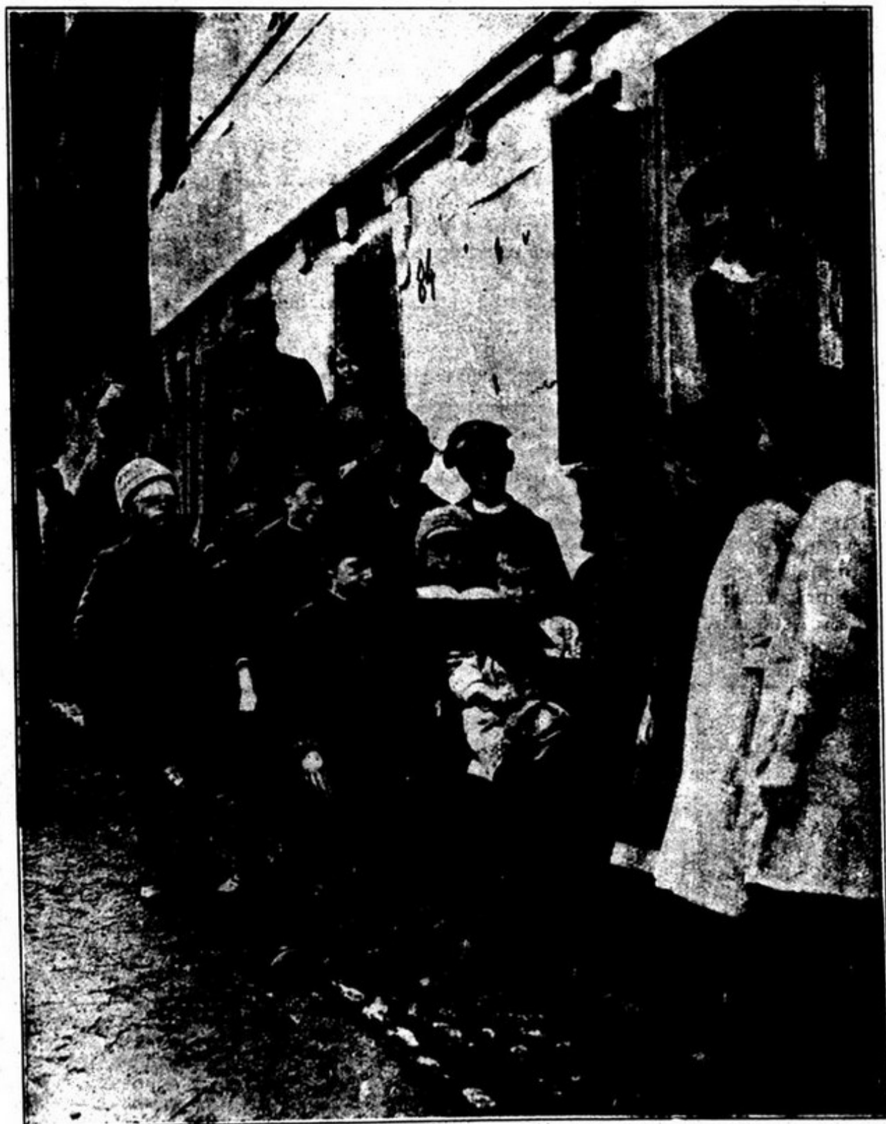
LICÇÃO DE FRANCÊS A CRIANÇAS DA ALBACIA ( Em Soppe-le-Bas )