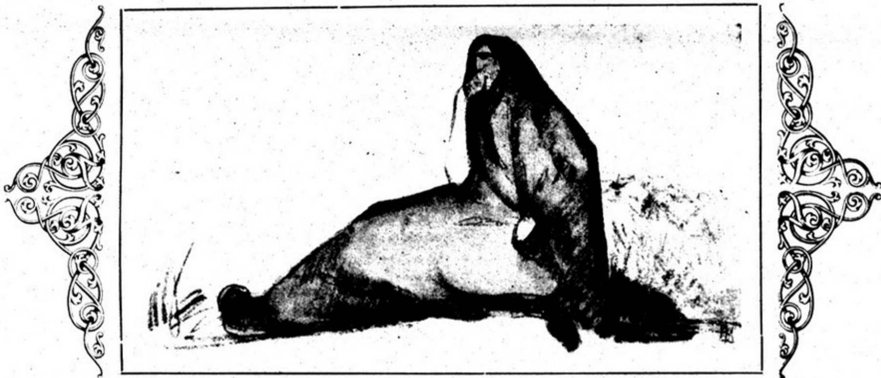
(Desenho de Jose Pacheco)