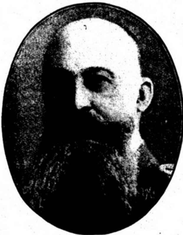
ALMIRANTE VON TIRPITZ

2.º — Os navios neutros tambem correm perigo de serem atingidos por ataques destinados aos navios inimigos por causa do emprego indevido de bandeira neutra, ordenado pelo governo inglês,