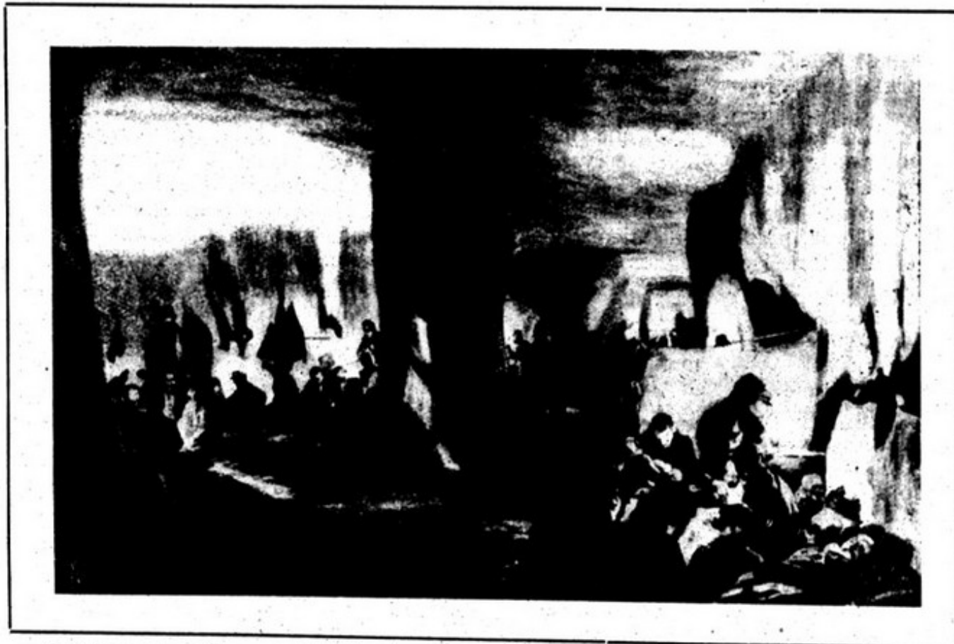
«TROGLODITAS DO AISNE» — Soldados francezes habitando galerias subterraneas, perto de Soissons, que tinham sido primeiramente ocupadas pelos allemães.

attitude d'aquella nação, talvez por que receie o levantamento dos arabes da Tripolitana e porque lhe não desagradem os offerecimentos da Austria em satisfação das aspirações irridendistas . O coronel Ricciotti Garibaldi , que já perdeu dois filhos nesta tremenda lucta, disse ao Temps :