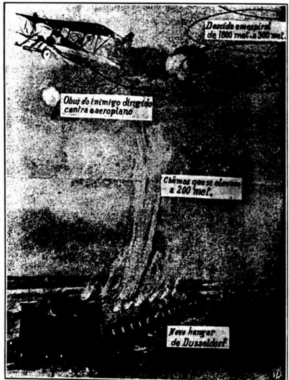
UM HANGAR DE DUSSELDORF INCENDIADO POR UM AVIÃO INGLÊS

Outra diversão favorita dos Viennenses era o passeio á tarde nos jardins e sobretudo no Pratter . Archi-duquêsas,