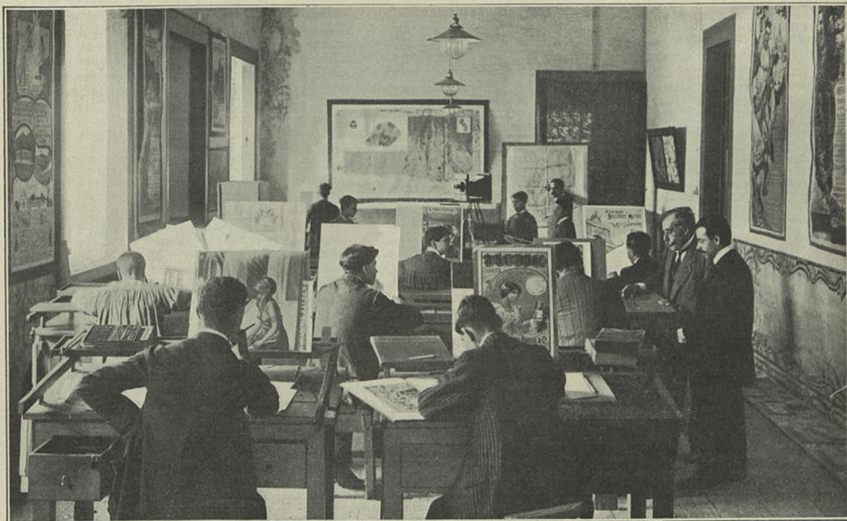
EDITORIA LIMITADA — ATELIER DE DESENHO