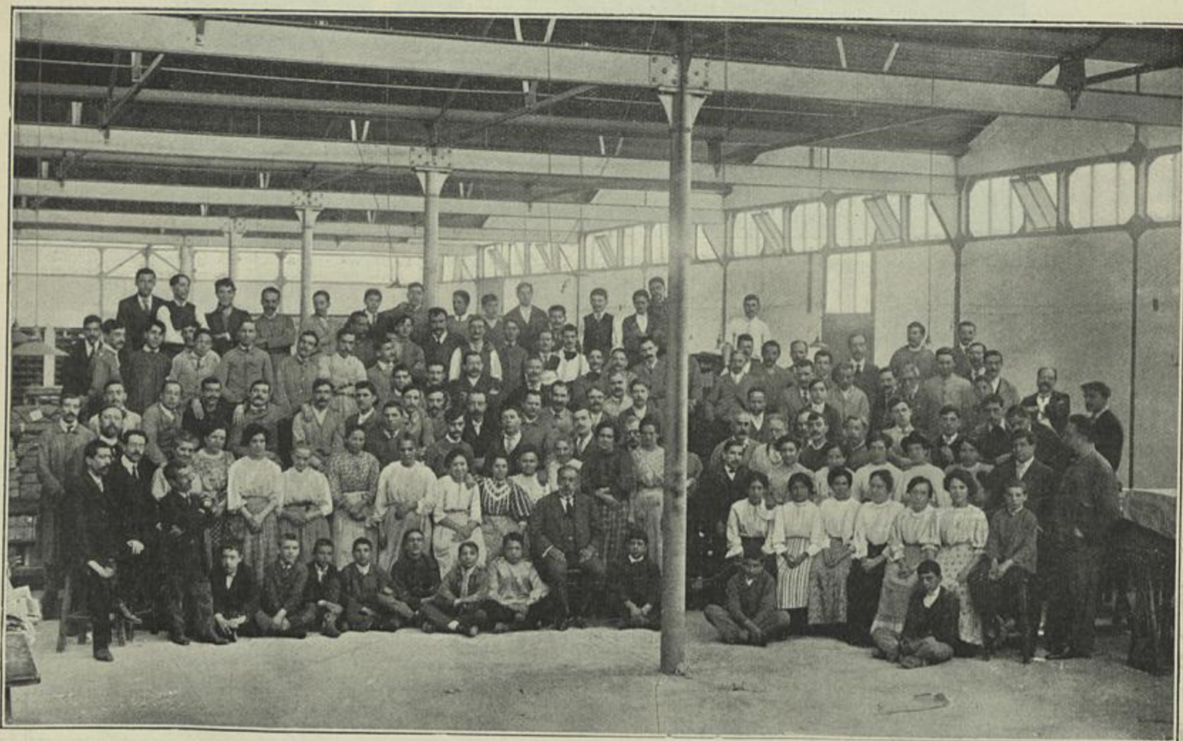
PESSOAL DAS OFICINAS DA EDITORA LIMITADA