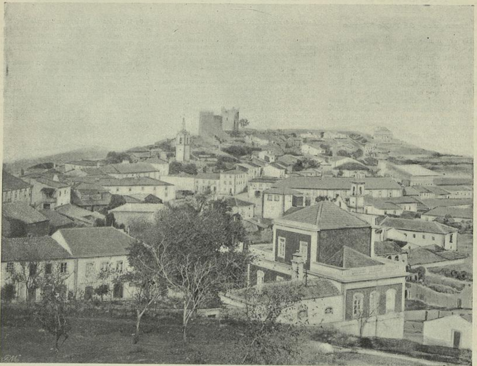
VISTA GERAL DA CIDADE DE PINHEL