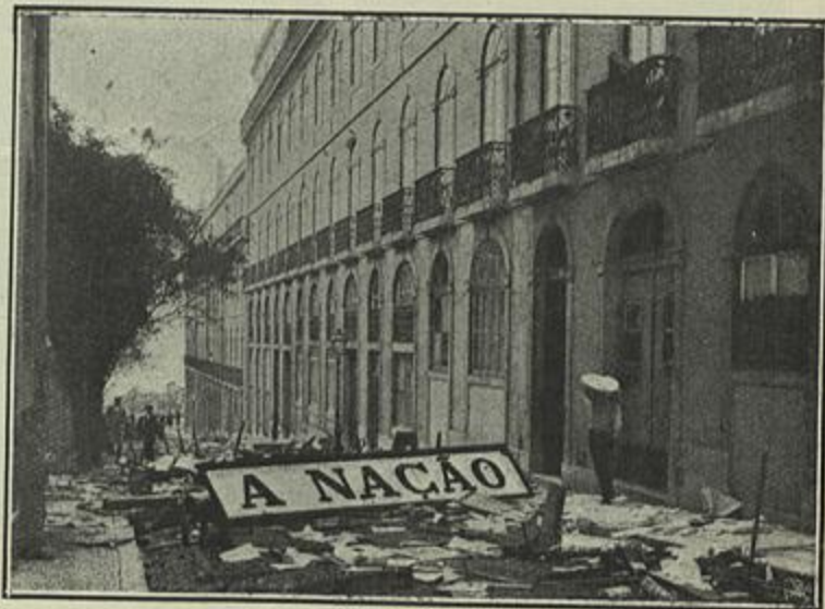
ASSALTO AO JORNAL «A NAÇÃO»

No momento, uma restauração monarchica seria uma imposição da velha monarchia que não soube usar da sua força para defender-se. Como quererá ela agora