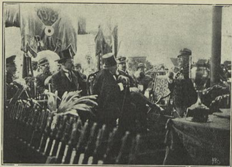
O SR. PRESIDENTE DA REPUBLICA ASSISTINDO AO CONCURSO NACIONAL DE TIRO