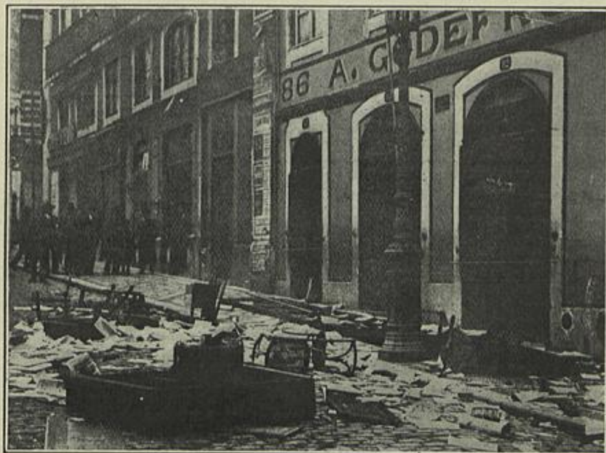
ASSALTO AO JORNAL «O DIA»

«A ideia da criação da Associação Internacional para a reforma e codificação do direito das gentes, que depois de 1894 passou a denominar-se «International Law Association», nasceu nos Estados Unidos dentro de cuja união, pela orga-