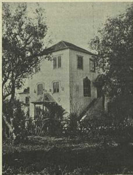
FACHADA DO NASCENTE

Eis, nos seus traços geraes, o enredo da peça: Estamos no anno de 216 antes de Christo em Roma. O povo lamenta-se, e cada dia que nasce mais horas são de profunda tristeza; Anibal tinha infligido ao exercito romano varias derrotas e avançára quasi até junto das portas da cidade.