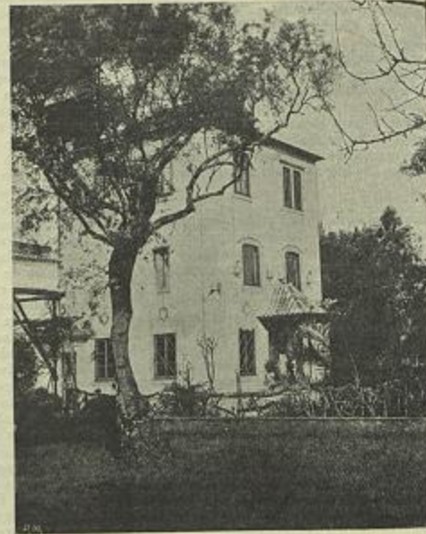
FACHADA DO SUL