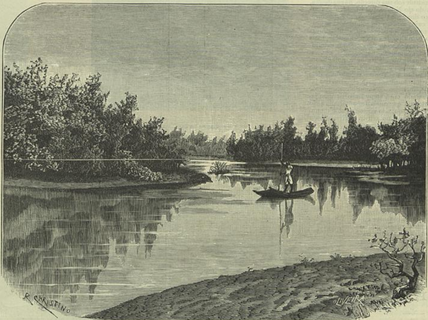
UMA VISTA DO RIO LOBITO