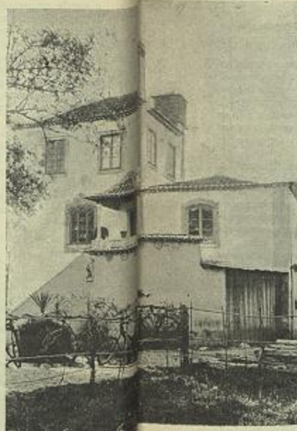
FACHADA DO NORTE