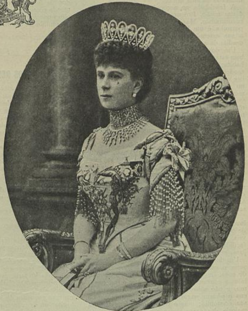
SUA MAGESTADE A RAINHA MARIA