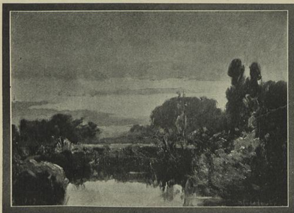
AO FIM DA TARDE — Quadro de Candido da Cunha

portas, no dia do funeral de Eduardo VII, tendo o governo portuguez decretado feriado para todas as secretarias e mais estabelecimentos do Estado, e que os serviços militares e de policia fossem feitos de grande uniforme e as bandeiras em funeral.