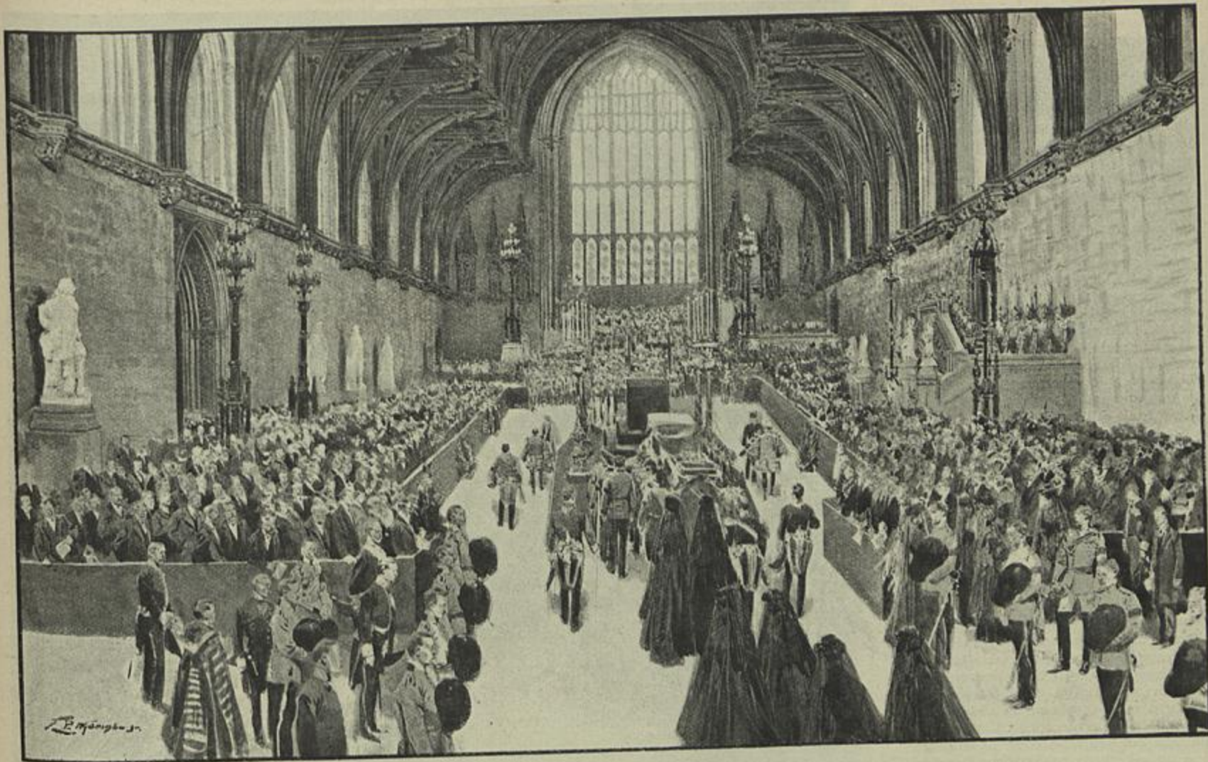
EXPOSIÇÃO DO CORPO DE EDUARDO VII NA ABADIA DE WESTMINSTER HALL, CHEGADA DO CORTEJO FUNEBRE