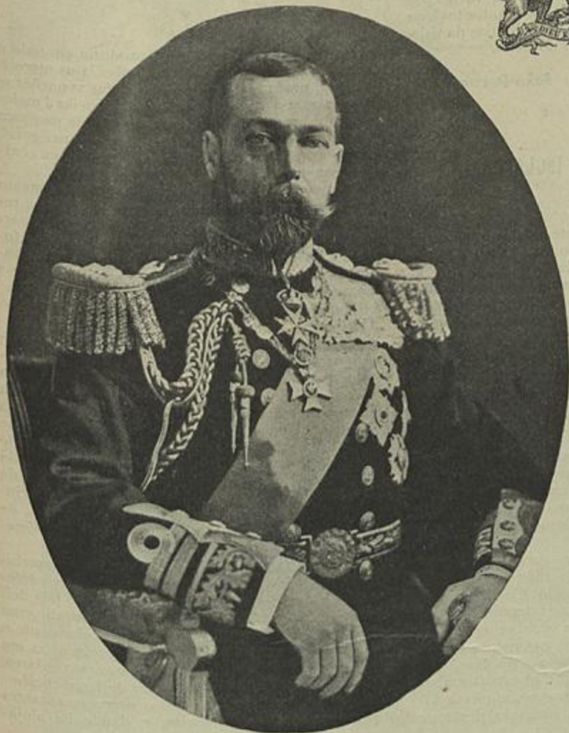
SUA MAGESTADE O REI JORGE V