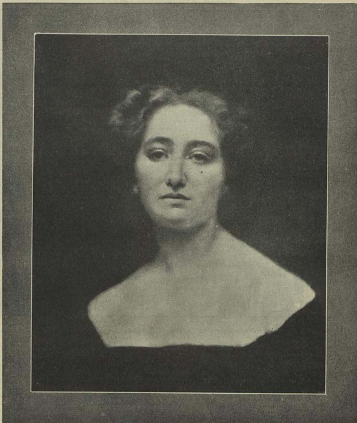
RETRATO DE MADEMOISELLE BRAMÃO — Quadro de João Augusto Ribeiro