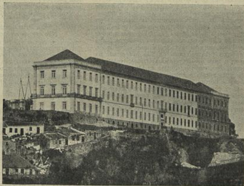
DESCERRAMENTO POR EL-REI, DA LAPIDE COMEMORATIVA NO COLEGIO DOS ORFÃOS — O COLEGIO DOS ORFÃOS ONDE FOI COLOCADA A LAPIDE COMEMORATIVA

Sua Magestade El-Rei D. Manuel partiu de Lisboa para o Porto, no dia 3, acompanhado pelos srs. presidente do conselho, ministros da guerra e da fazenda, membros da comissão executiva do centenario, etc.