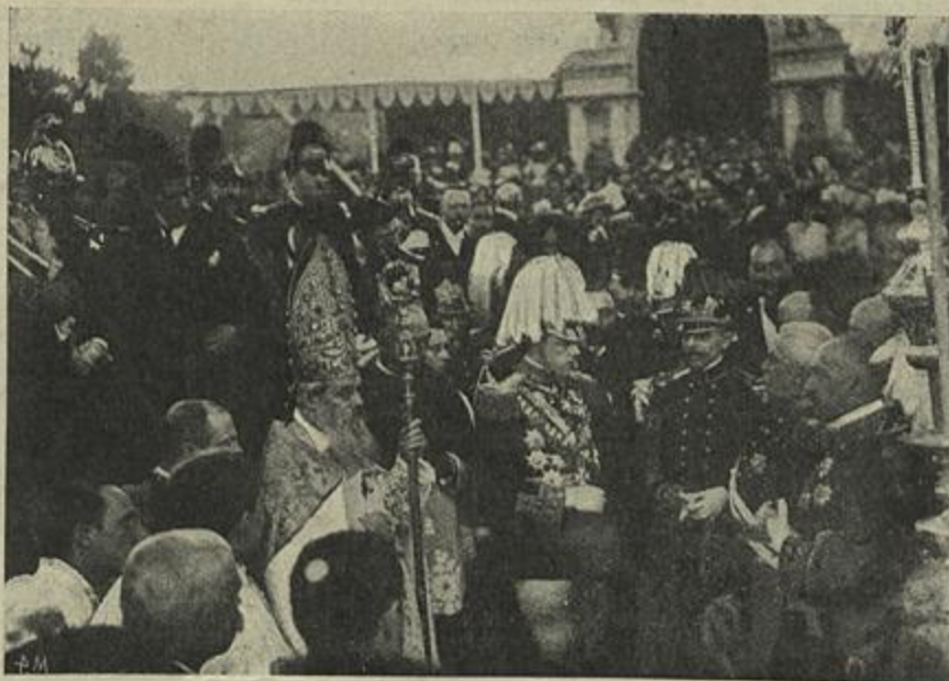
A CERIMONIA DE LANÇAR A PRIMEIRA PEDRA DO MONUMENTO AOS HEROES QUE EXPULSARAM OS FRANCESES DO NORTE DE PORTUGAL — ASSISTENCIA DE EL-REI, BISPO DO PORTO, MINISTROS E COMISSÃO EXECUTIVA.

Sob um sol ardente chegou El-Rei no seu automovel, seguido dos mais que lhe faziam cortejo, e por entre as aclamações delirantes dos amarantenses, percorreu as ruas até aos passos do concelho, onde o presidente do municipio leu a sau-