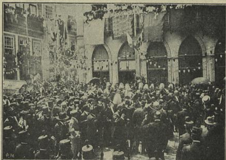
EM AMARANTE — UMA VISTA DA VILA — O ANTIGO CONVENTO DOMINICANO E EGREJA DE S. GONÇALO — A PONTE DE AMARANTE — A LAPIDE COMEMORATIVA NO OBELISCO DA PONTE — CHEGADA DE EL-REI A AMARANTE.