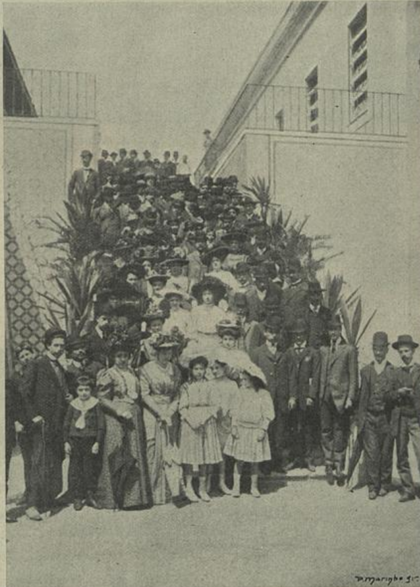
CONGRESSO PEDAGOGICO — VISITA DE CONGRESSISTAS AO ASILO «MARIA PIA»

«O congresso municipalista, inspirando-se num alto sentimento de solidariedade social e patriótica, alheio a qualquer orientação politica partidaria, saúda o chefe do Estado e as côrtes geraes representantes da nação portugueza.»