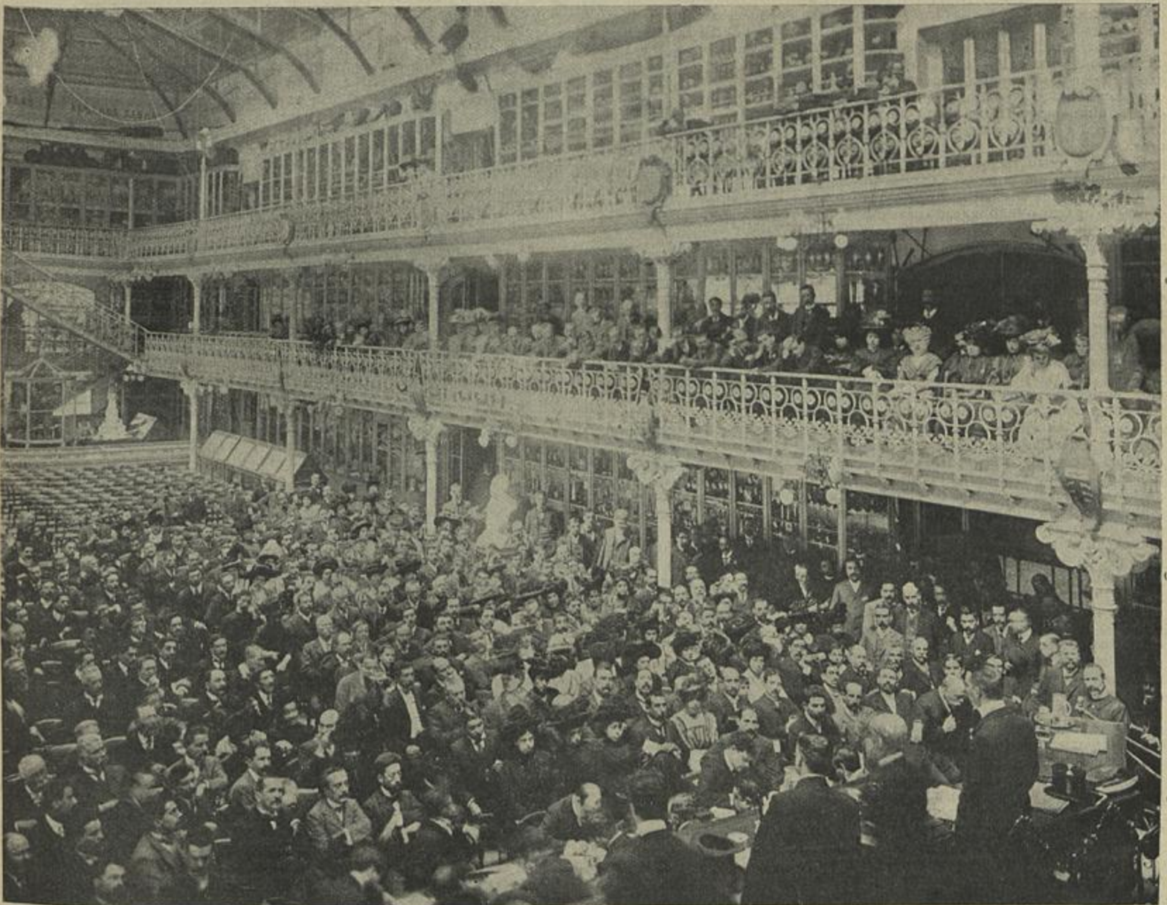
INAUGURAÇÃO DO CONGRESSO NA SALA «PORTUGAL» DA SOCIEDADE DE GEOGRAFIA