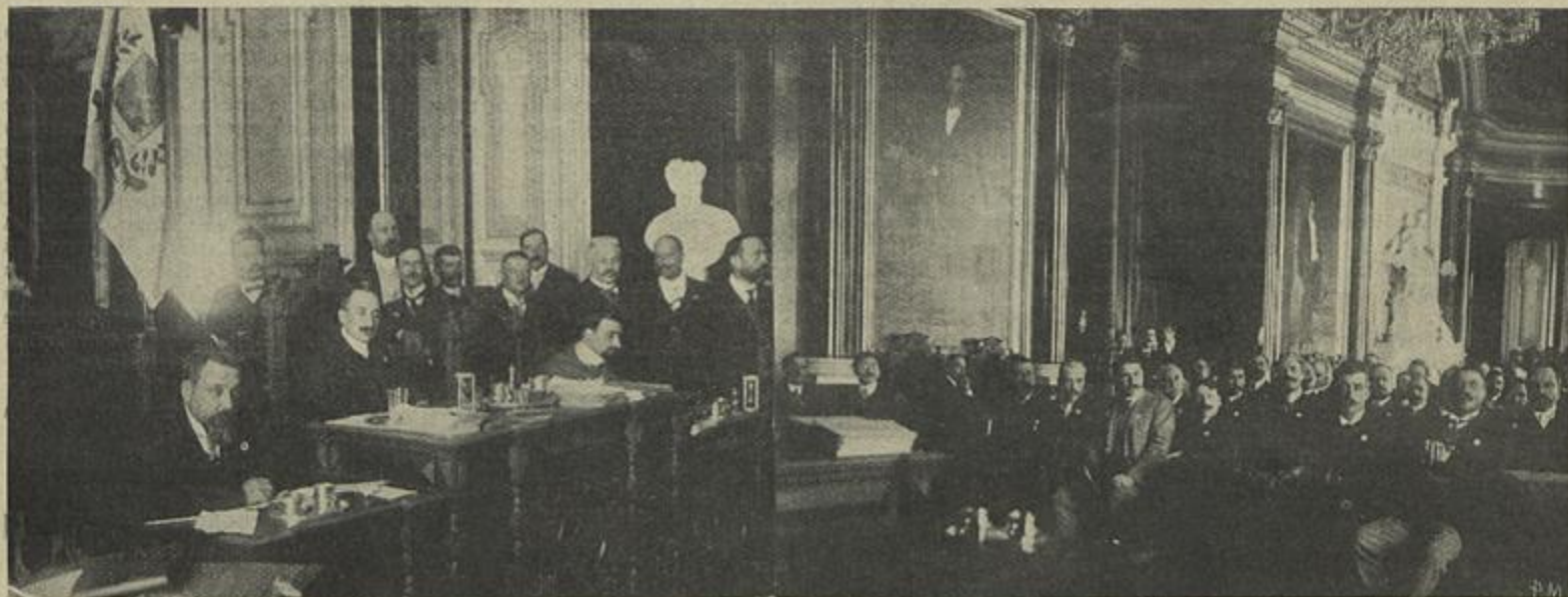
UMA SESSÃO DO CONGRESSO NAS SALAS DOS PAÇOS DO CONCELHO DE LISBOA