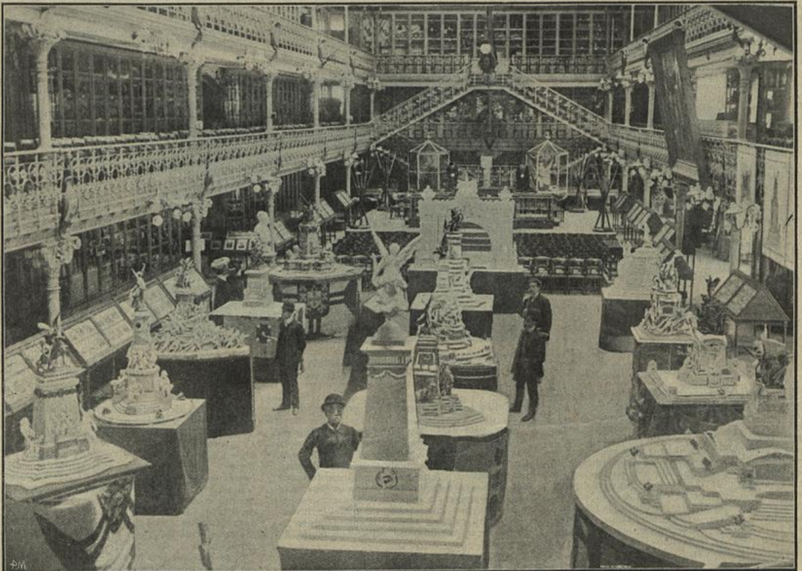
EXPOSIÇÃO DAS «MAQUETES» DO MONUMENTO, NA SALA PORTUGAL, DA SOCIEDADE DE GEOGRAFIA

vações sobre o seu retrahimento, que uns attribuem a uma paixão sentimental pela burguezinha de Faubourg Saint-Martin, outros a amores com a demi-mondaine Flamina, retrato vivo da burguezinha. Entra o marquez, que fica surprehendido de ver os seus amigos; estes convidam-no para uma passeata no dia seguinte a Saint-Germain. Ha uma aposta entre Amanda (uma das damas galantes) e Lingart (um dos muscadins ), asseverando a primeira maliciosamente