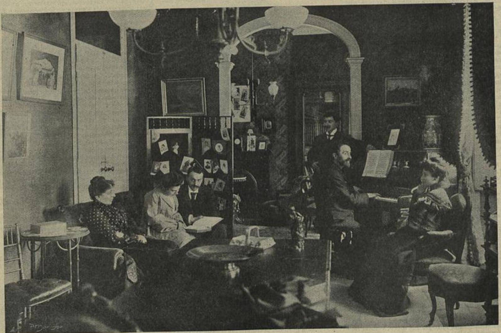
O MAESTRO AUGUSTO MACHADO AUTOR DA OPERA «BORGHESINA», EM FAMILIA