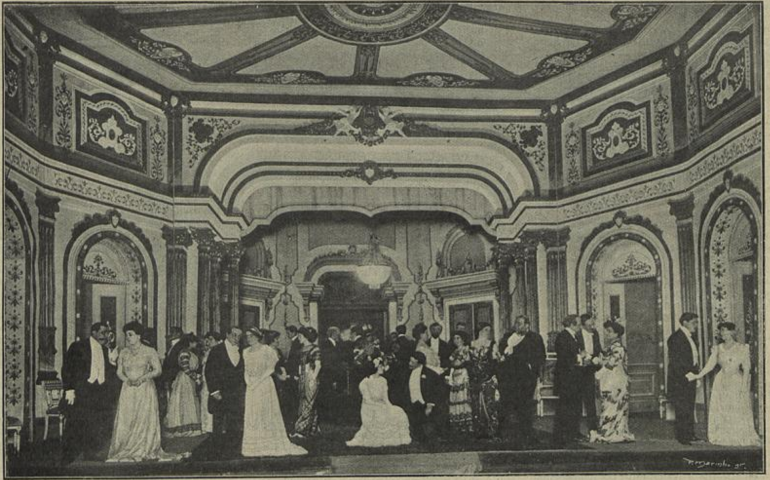
OS POSTIÇOS — UMA CENA DO 4.º ACTO — COMEDIA DE EDUARDO SCHWALBACK