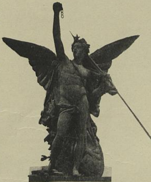
GENIO DA INDEPENDENCIA EMBLEMA DE «A NACIONAL»

Para a sua applicação é ainda necessaria a collaboração de medicos, juriconsultos, contabilistas, etc.