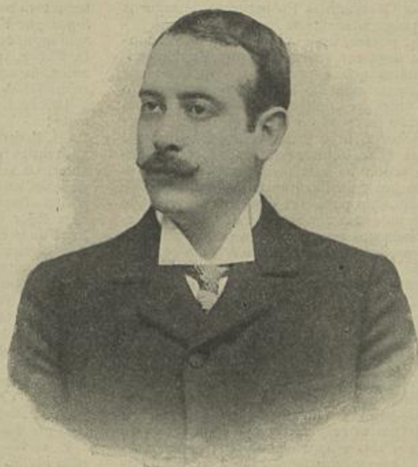
DR. EGAS MONIZ — MEDICO CHEFE DA COMPANHIA

desempenha o medico chefe é da maior responsabilidade, por isso que do seu parecer depende a admissão ou recusa dos Segurados nos contractos em caso de morte.