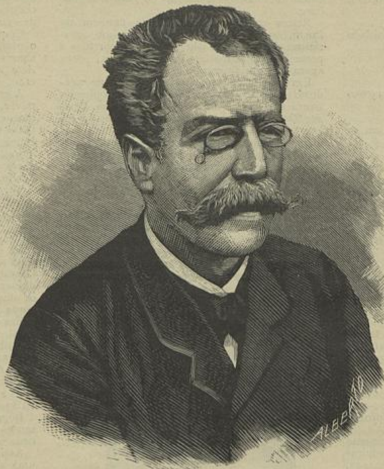
O AFRICANISTA GENERAL HENRIQUE DE CARVALHO

cida pelo Atheneu Commercial uma bandeira portugueza bordada em seda por umas senhoras, a qual foi benzida solemnemente na egreja de S. Domingos com a assistencia de muitos officiaes do exercito de mar e terra e um representante do sr. ministro da marinha.