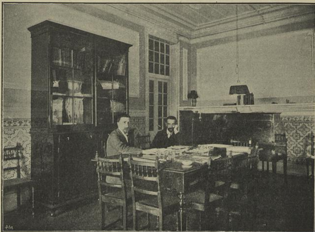
GABINETE DA DIRECÇÃO — DIRECTOR E SUB-DIRECTOR

O serviço medico das Companhias de Seguros constitue hoje em dia uma especialidade que demanda conhecimentos adequados e o papel que