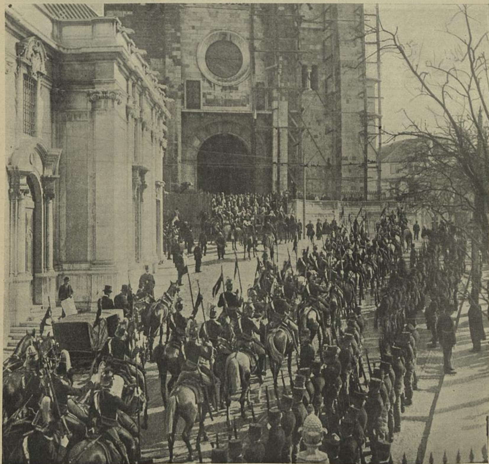
CHEGADA DE SUAS MAGESTADES EL-REI D. MANUEL E RAINHA D. AMELIA, AO TEMPLO DA SÉ