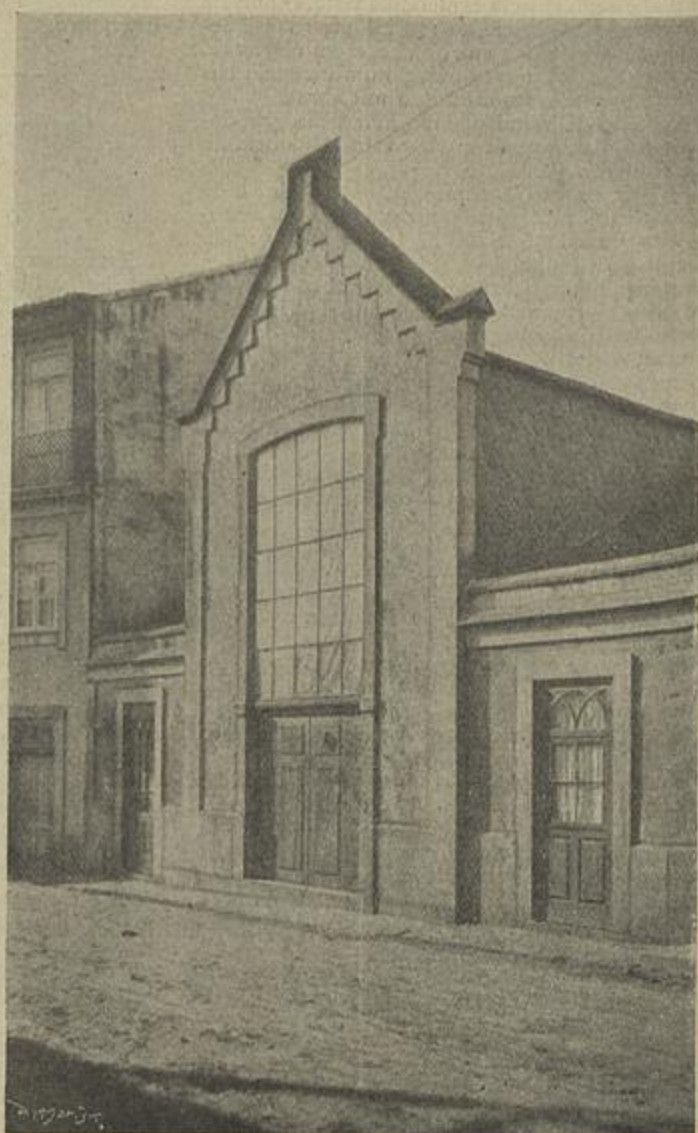
O «ATELIER» DE SOARES DOS REIS