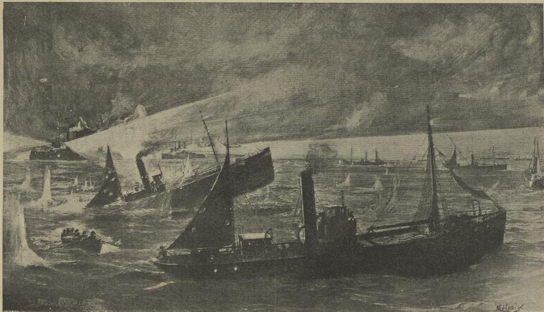
O INCIDENTE DE HULL.—A ESQUADRA RUSSA DO BALTICO FAZENDO FOGO CONTRA OS BARCOS DE PESCA INGLEZES Cópia de um desenho de Norman Wilkson, feito conforme apontamentos de testemunhas presenciaes