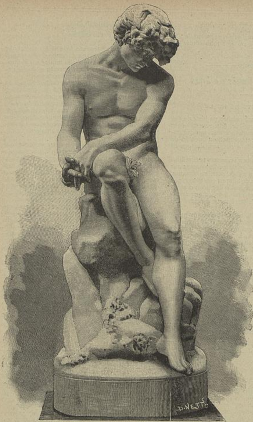
O DESTERRADO — Escultura de Soares dos Reis