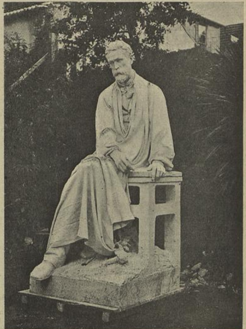
ESTATUA DE SOARES DOS REIS — Esculptura de Teixeira Lopes

Assumptos não nos faltavam hoje para a chronica, desde a viagem de El-rei, marcada para o dia 12, até outra viagem bem differente, final d'uma comedia grotesca, a dos 59 emigrantes portuguezes fugidos da cadeia de Vigo. Mas descançaremos um dia d'essas viagens de bicho fantastico, insecto meio borboleta, meio besoiro, adejando sobre flôres perfumadas e quanta vez tambem sobre as podridões que despertam curiosidade. O noticiario deve ser de todas as côres; mas a chronica