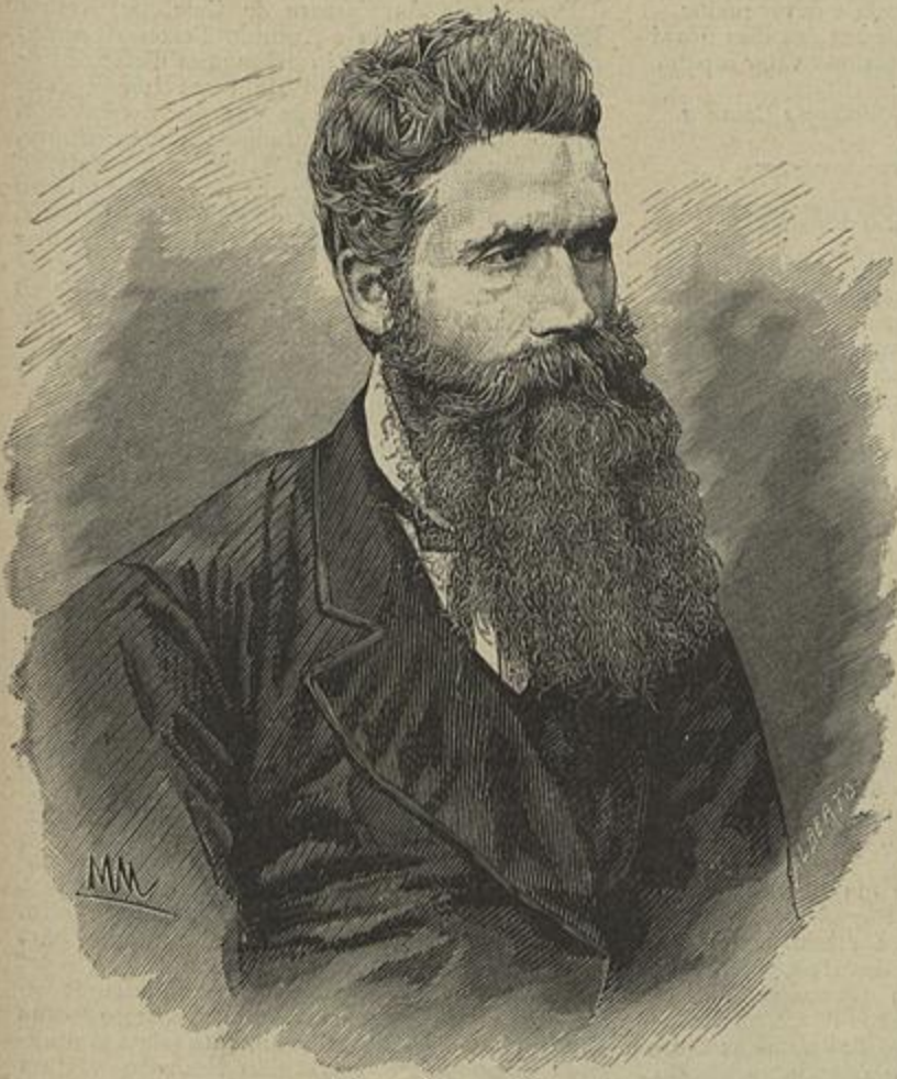
SOARES DOS REIS

de merito, verdadeiras glorias nacionaes, um devotadissimo á sciencia em que foi mestre, Sousa Martins, o outro tamanho quanto desgraçado, artista genial, o auctor do Desterrado , obra prima com que se apresentou na patria logo depois da sua volta de Roma, artista sem emulo no seu tempo em Portugal, o escultor Soares dos Reis.