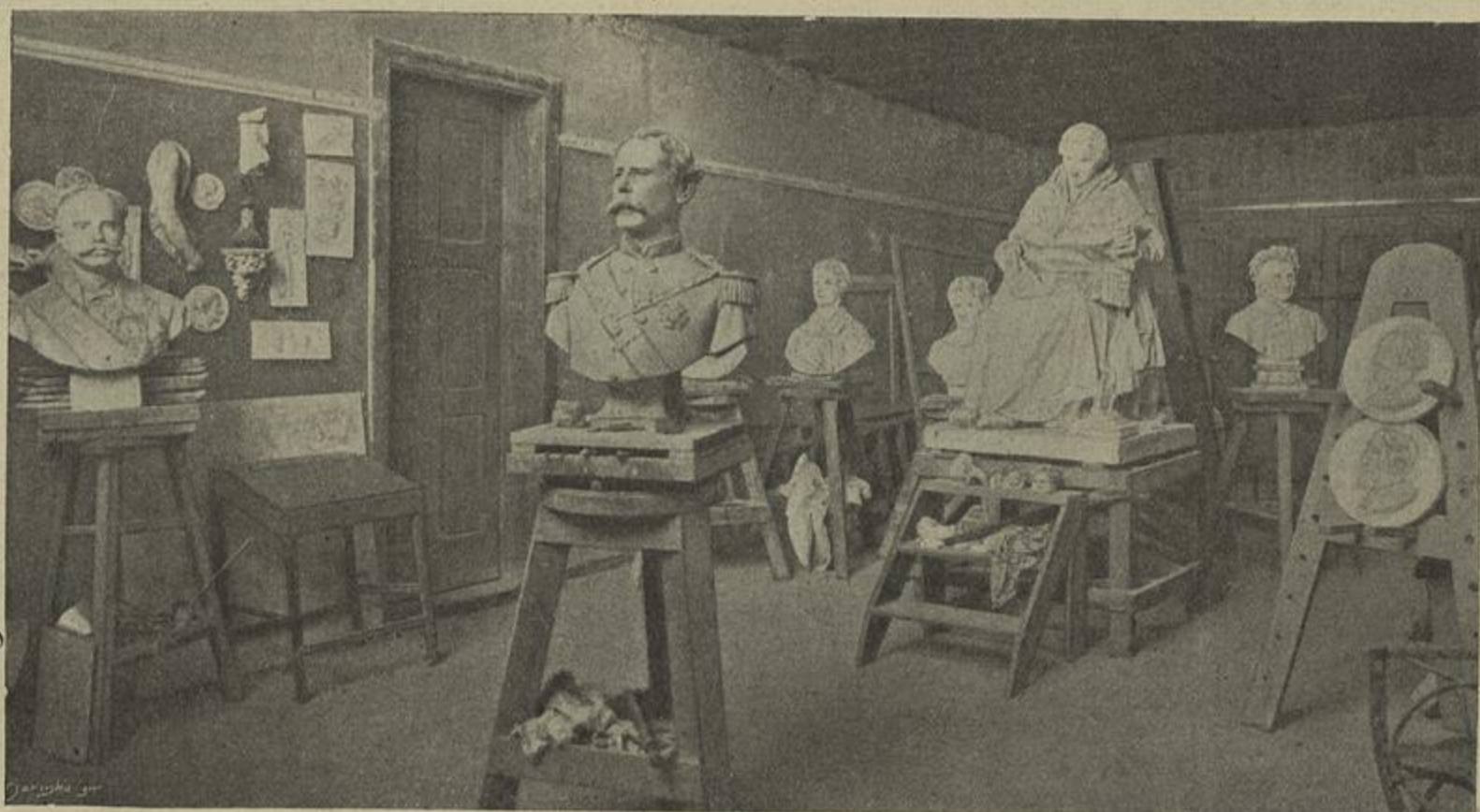
OBRAS DE SOARES DOS REIS EXPOSTAS NO «ATELIER» Á DATA DO SEU FALLECIMENTO