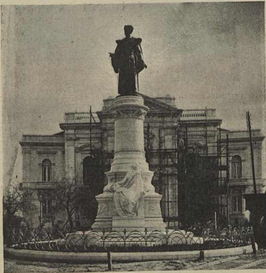
O MONUMENTO A SOUSA MARTINS — INAUGURADO EM 7 DO CORRENTE