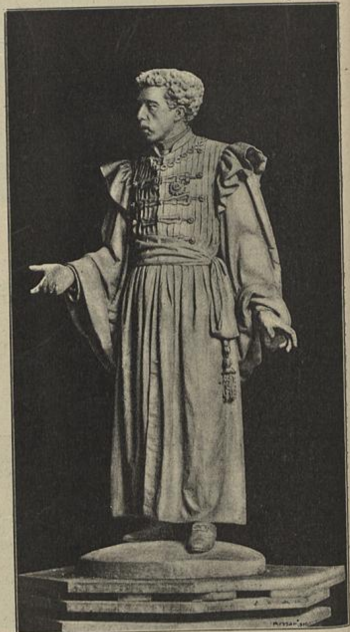
ESTATUA DE SOUSA MARTINS — ESCULPTURA DE COSTA MOTTA