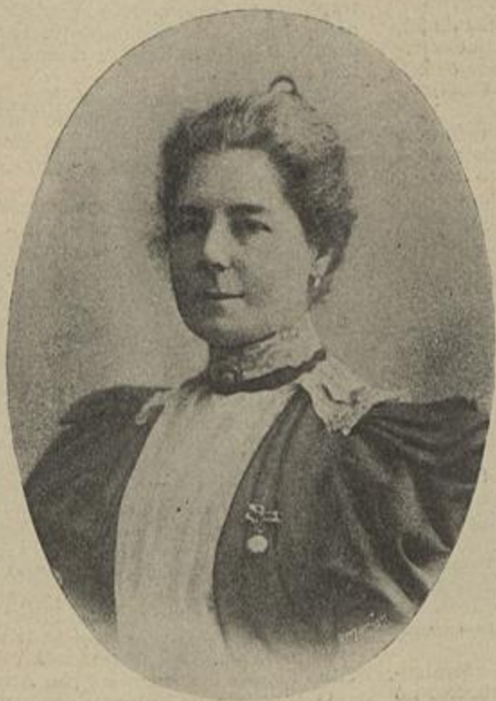
MARQUEZA DE UNHÃO