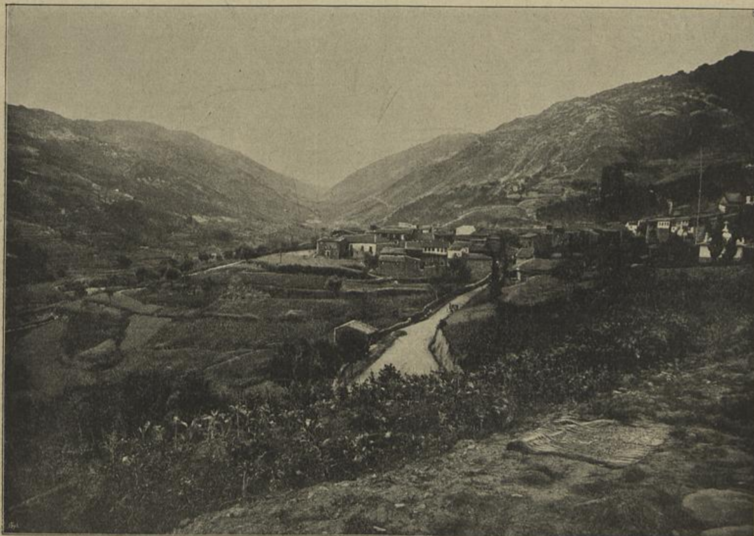
UM VALLE CULTIVADO NA SERRA DA ESTRELLA — (Parte primeira — Capitulo II — O solo aravel e o clima)