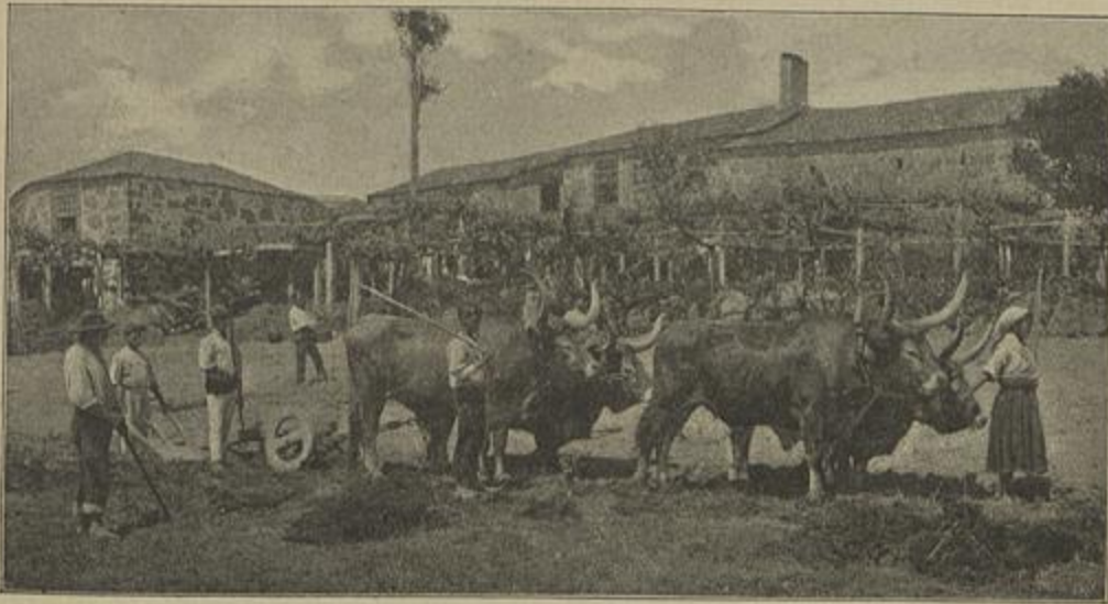
LAVOURA MINHOTA — (Parte primeira — Capitulo IV — Os gados )

soins sans se l'approprier, comme il ne peut s'approprier que ce qui doit s'appliquer à ses besoins, être consommé.»