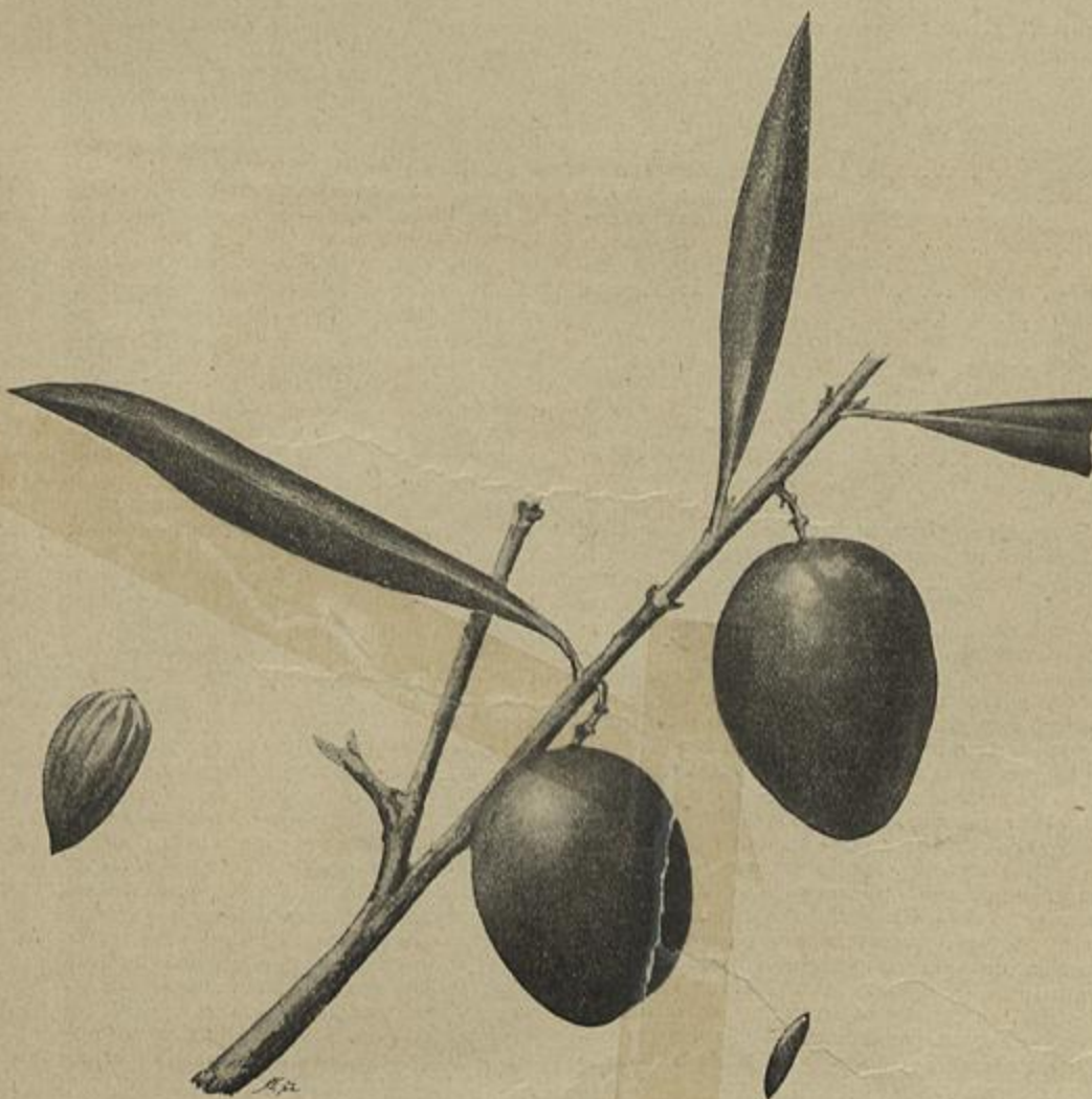
AZEITONA SEVILHANA — (Parte segunda — Capitulo II — Os olivae e os azeitos )

No principio d'esta epocha o governo tinha mandado forrar de papel os camarotes. O governador civil occupou por algum tempo o camarote n.º 29 da 1.ª ordem, em lugar da sua frisa habitual.