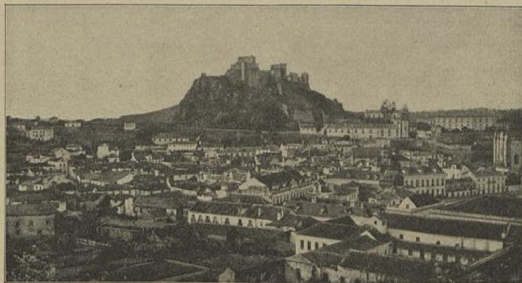
VISTA DE LEIRIA — AFFLORAMENTOS DE OPHITE NOS MARNES INFRALIASICOS (Parte primeira — Capitulo I — A geologia de Portugal )

A propriedade não vem de filiação inconfessavel, nem se iniciou vergonhosamente, foi um acontecimento coevo do berço do genero humano, que resiste invulneravel a todos os tramas do sophisma, como a toda a cegueira das paixões desordenadas e a todas as remettidas do materialismo ignaro.