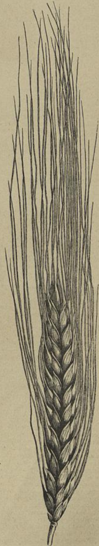
TRIGO VERMELEJOILO — (Parte segunda — Capitulo III — Os cereaes )