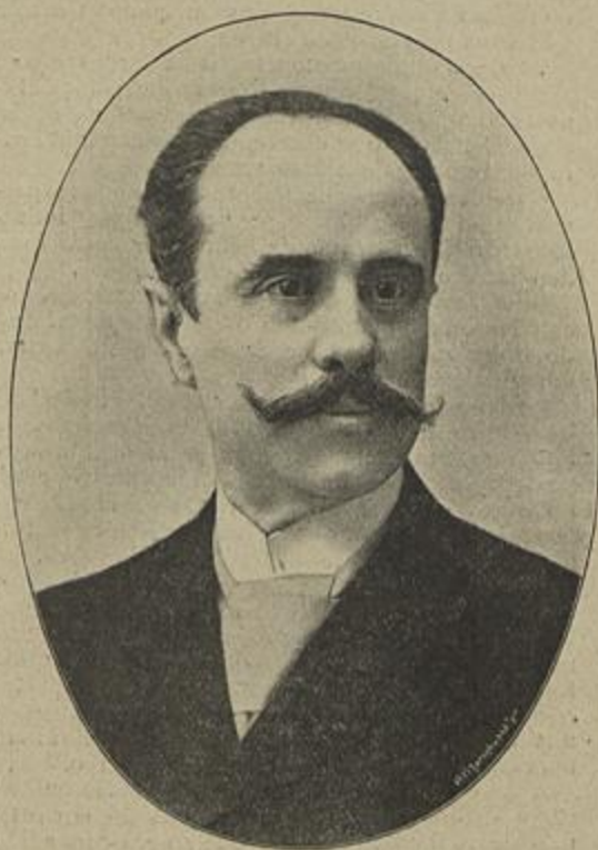
CONSELHEIRO ERNESTO RODOLPHO HINTZE RIBEIRO Presidente do Conselho e Ministro do Reino