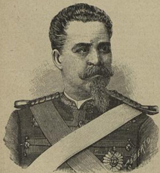
CONSELHEIRO GENERAL LUIZ AUGUSTO PIMENTEL PINTO Ministro da Guerra