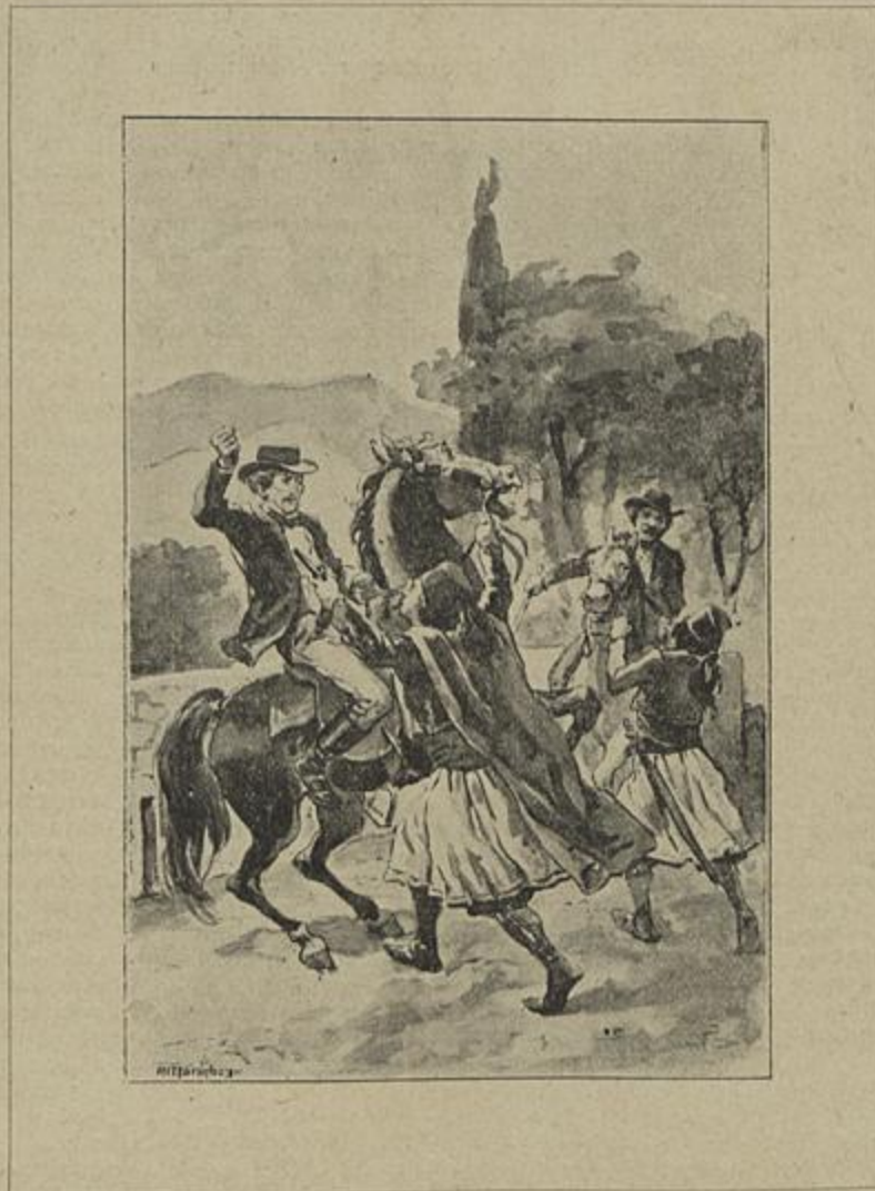
«O REI DAS SERRAS»... e logo dos magnificos soccos caem sobre a cabeça dos homens

O plano d'esta monumental obra foi approvado com caloroso elogio pelas principaes corporações industriaes e commerciaes de Portugal, e a edição faz-se por fórma a merecer o mais decidi-