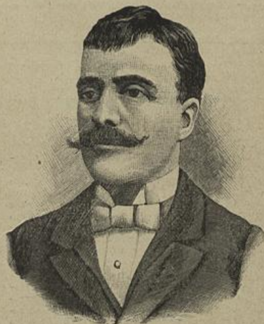
CONSELHEIRO DR. ALBERTO DE CAMPOS HENRIQUES Ministro da Justiça