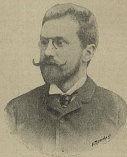
CONSELHEIRO DR. JOÃO MARCELLINO ARROYO Ministro dos Negocios Estrangeiros