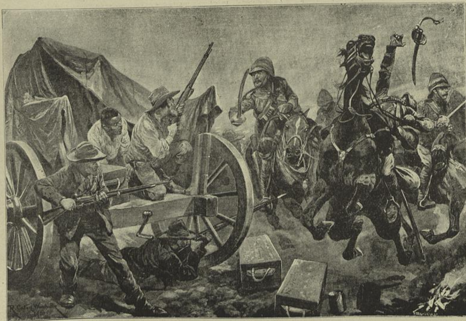
UM ATAQUE DA CAVALLARIA INGLEZA