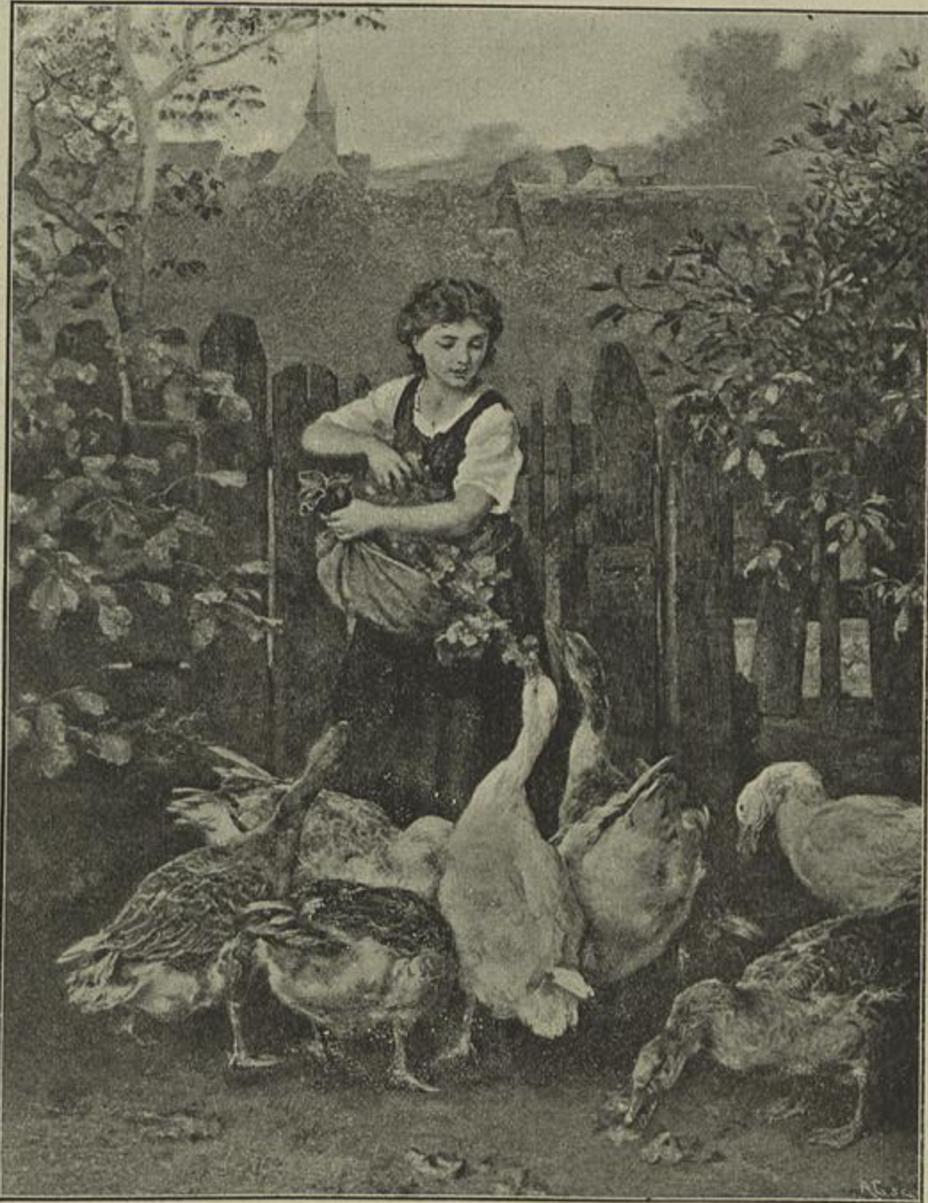
HORAS DE JANTAR

O relativo desenvolvimento da industria mineira não tinha comtudo equivalente nos outros ramos affins.