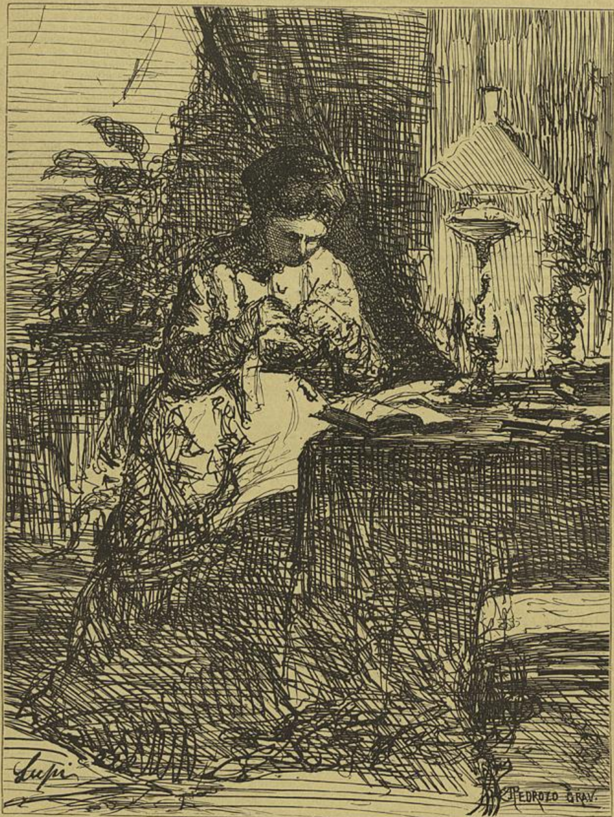
O SERÃO — Desenho á pena do fallecido pintor Lupi