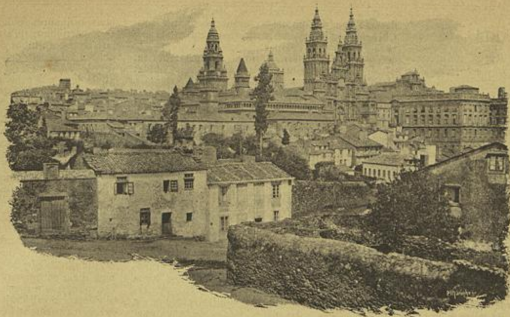
SANTIAGO DE COMPOSTELLA