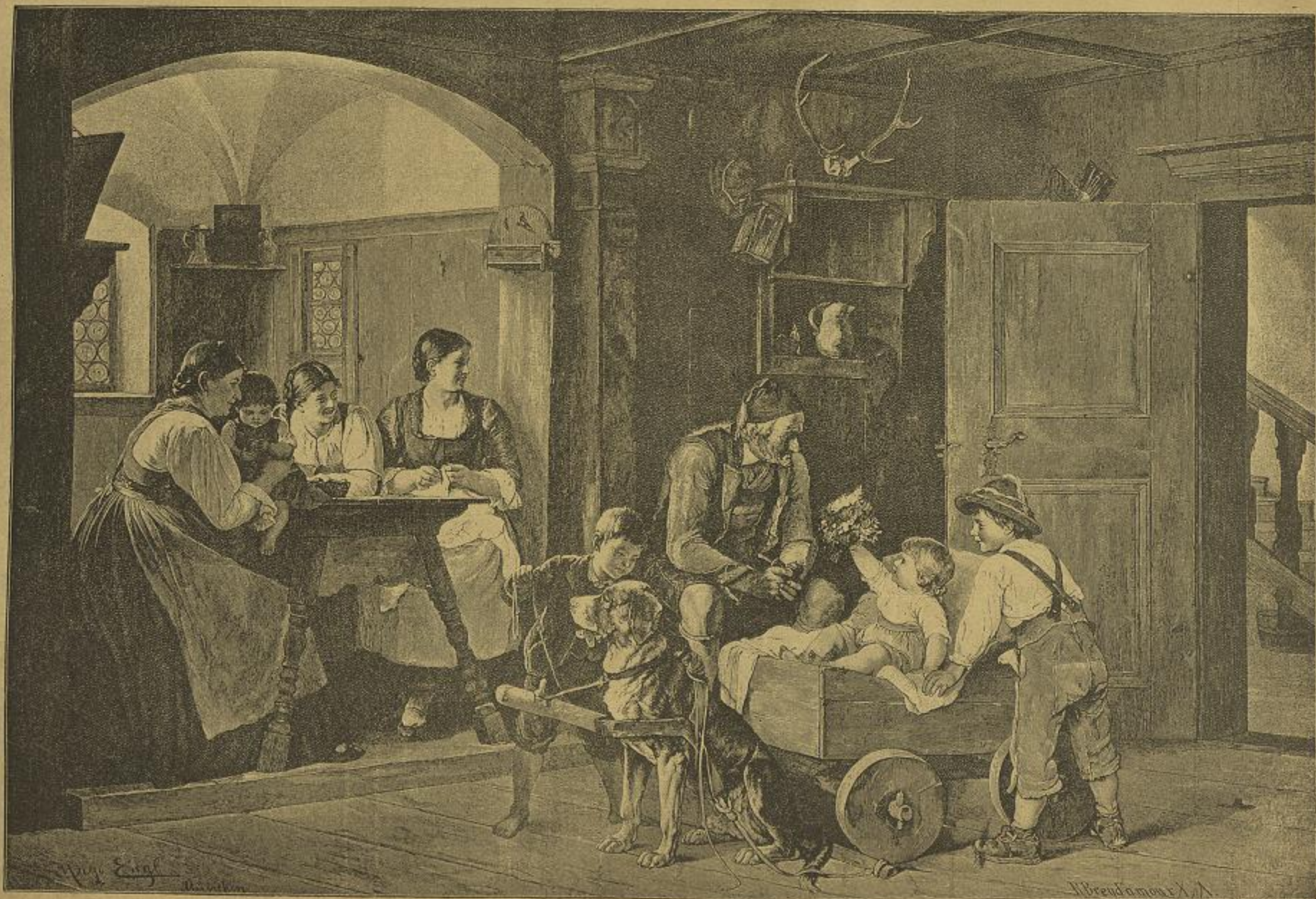
O NATAL DE MARIA — Boas festas avôsinho!...