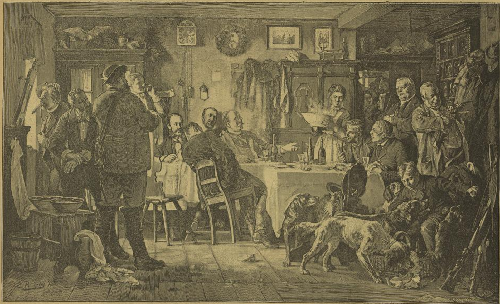
DEPOIS DA CAÇADA