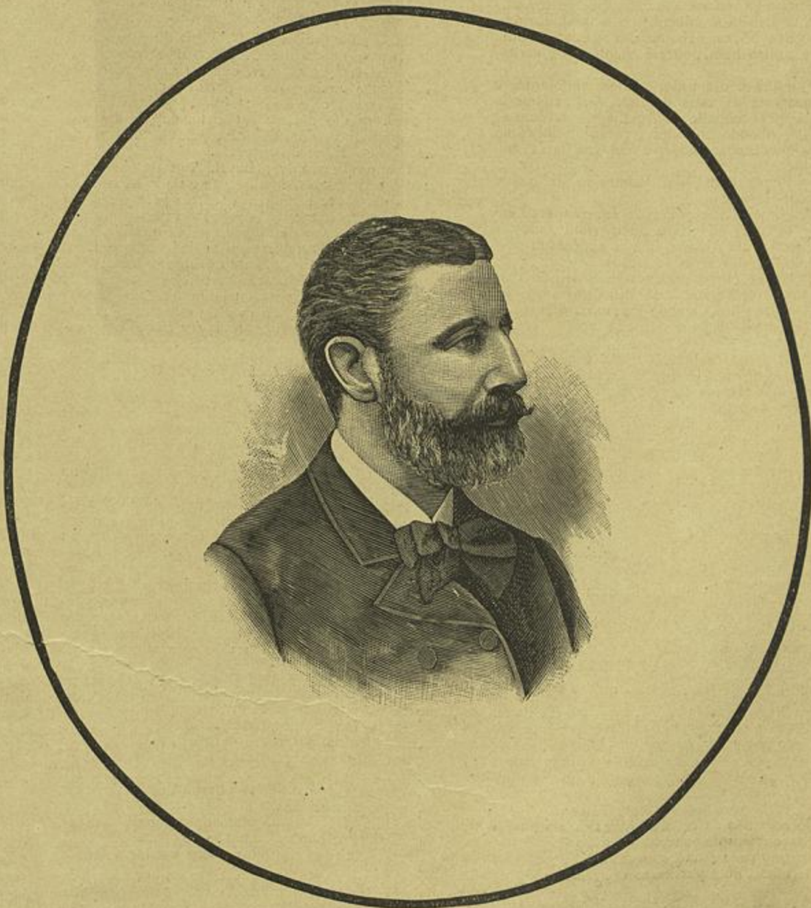
CONSELHEIRO HENRIQUE DE BARROS GOMES — FALLECIDO EM 15 DO CORRENTE

Anoiteceu. O Marquez de Pombal mandou acender as luzes. Os criados estavam esfalfados de tanto subir e descer escadas.