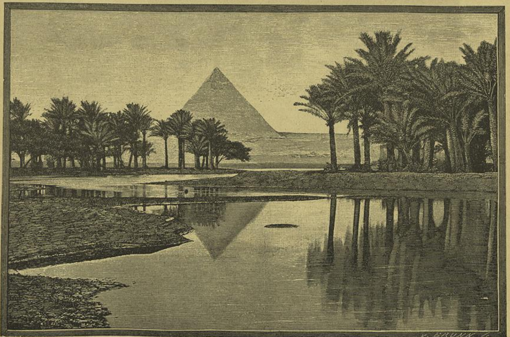
EGYPTO. — MARGENS DO NILO

vam de tedio. Um dia um rapazola novo, de bom trajar, montado n'um soberbo cavallo, luxuosa e costosa-