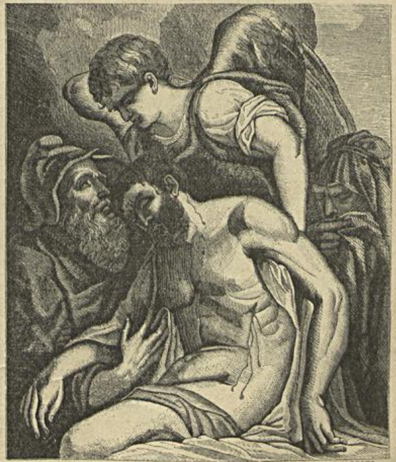
JESUS CHRISTO MORTO