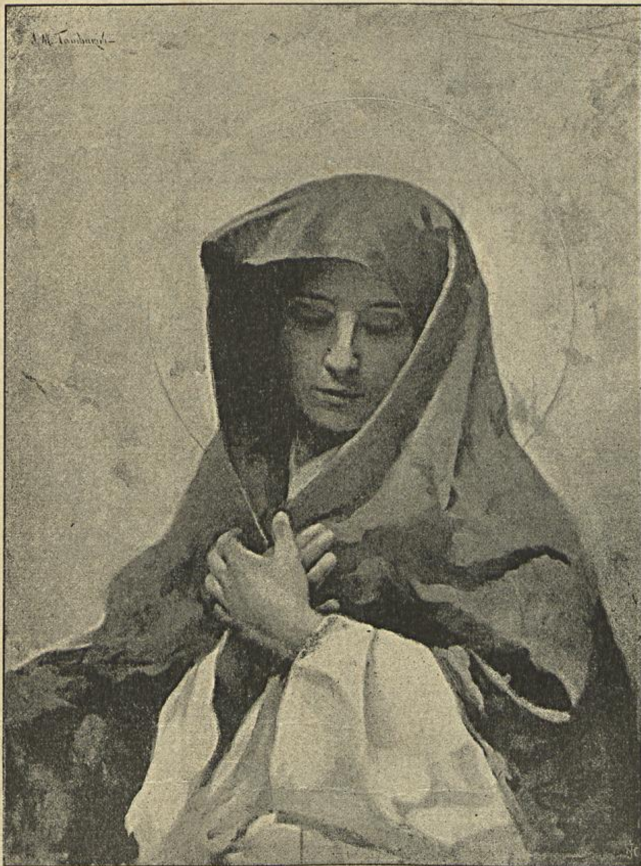
MATER DOLOROSA — Quadro de Tamburini