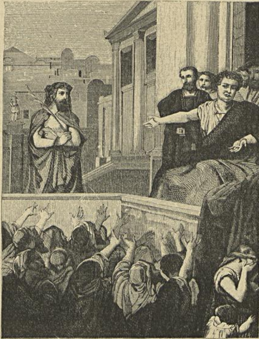
JESUS CHRISTO NA PRESENÇA DE PILATOS

Grandes são as conquistas que a humanidade tem feito guiada e illuminada pelas doutrinas do Redemptor, por essas eternas verdades pregadas desde desanove seculos, e se ella nunca deixasse de se guiar que pelas palavras do Divino Mestre, maiores seriam essas conquistas para a sua felicidade.