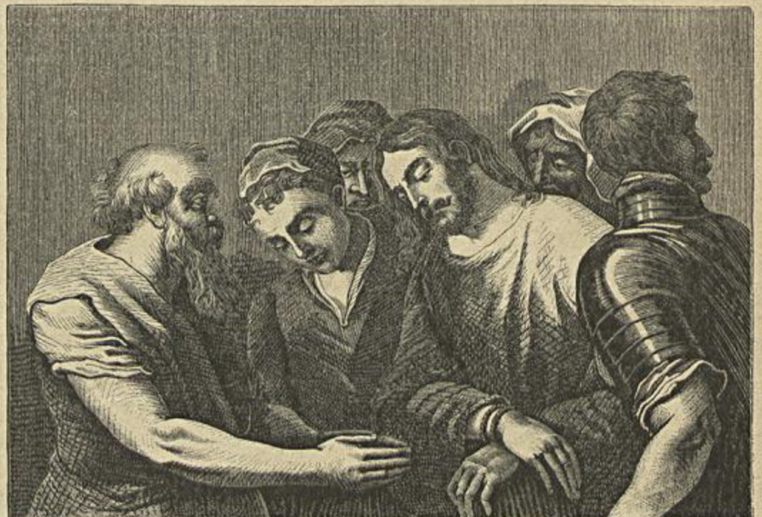
PRISÃO DE JESUS CHRISTO

«Perdoae-lhe meu pae que elles não sabem o que fazem».