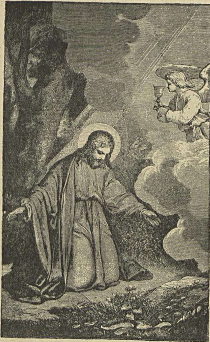
JESUS CHRISTO NO HORTO

Eis-nos chegados a mais uma comemoração da morte do Homem Deus, d'essa morte que foi vida para a humanidade pelas garantias que lhe outorgou.