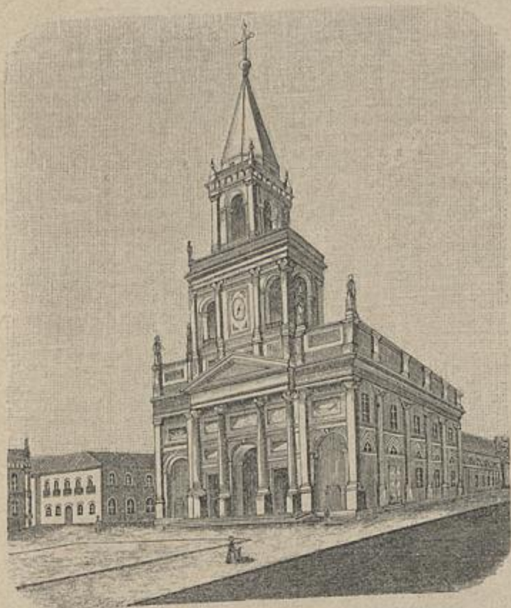
EGREJA MATRIZ DA CONCEIÇÃO