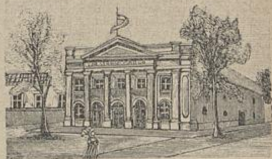
THEATRO DE S. CARLOS

partimentos terreos, sendo uma casa de entrada que tambem é casa de jantar, um quarto de cama contiguo e uma cozinha com pequeno fogão em um dos lados e duas ou tres camas no outro. A frente tem uma porta e duas janellas aos lados e na parte posterior apenas uma porta que dá para um pequeno cerrado, no fundo do qual está um