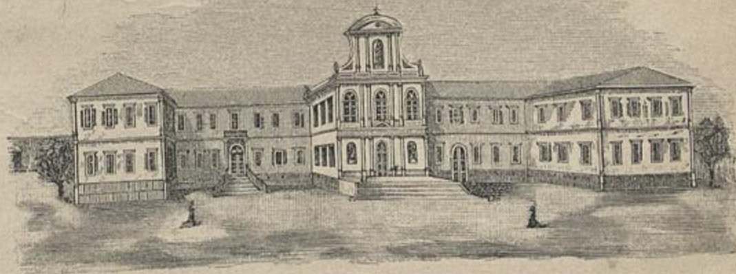
EDIFICIO DA SANTA CASA DA MISERICORDIA