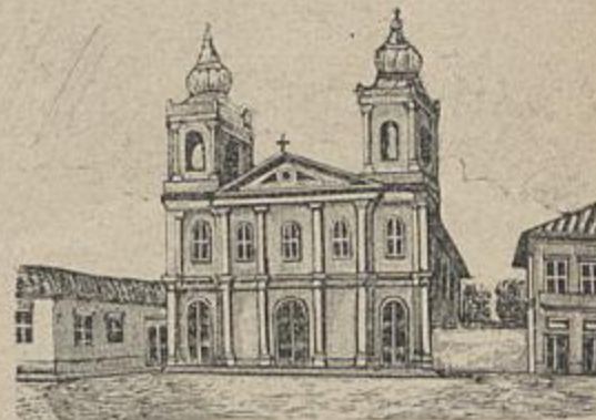
EGREJA DE NOSSA SENHORA DO ROSARIO

rancho (choupana de madeira, coberta de sape capim ou palha) que serve de paol ou celleiro gallinheiro, pocilga, etc. A mobilia consiste em uma mesa de madeira tosca, dois ou tres bancos, duas ou tres arcas e os leitos tambem de madeira tosca e sem barra.