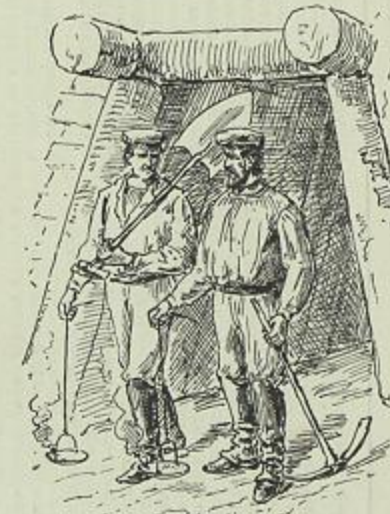
A LINHA URBANA DE LISBOA — AS OBRAS DO GRANDE TUNNEL DO ROCIO