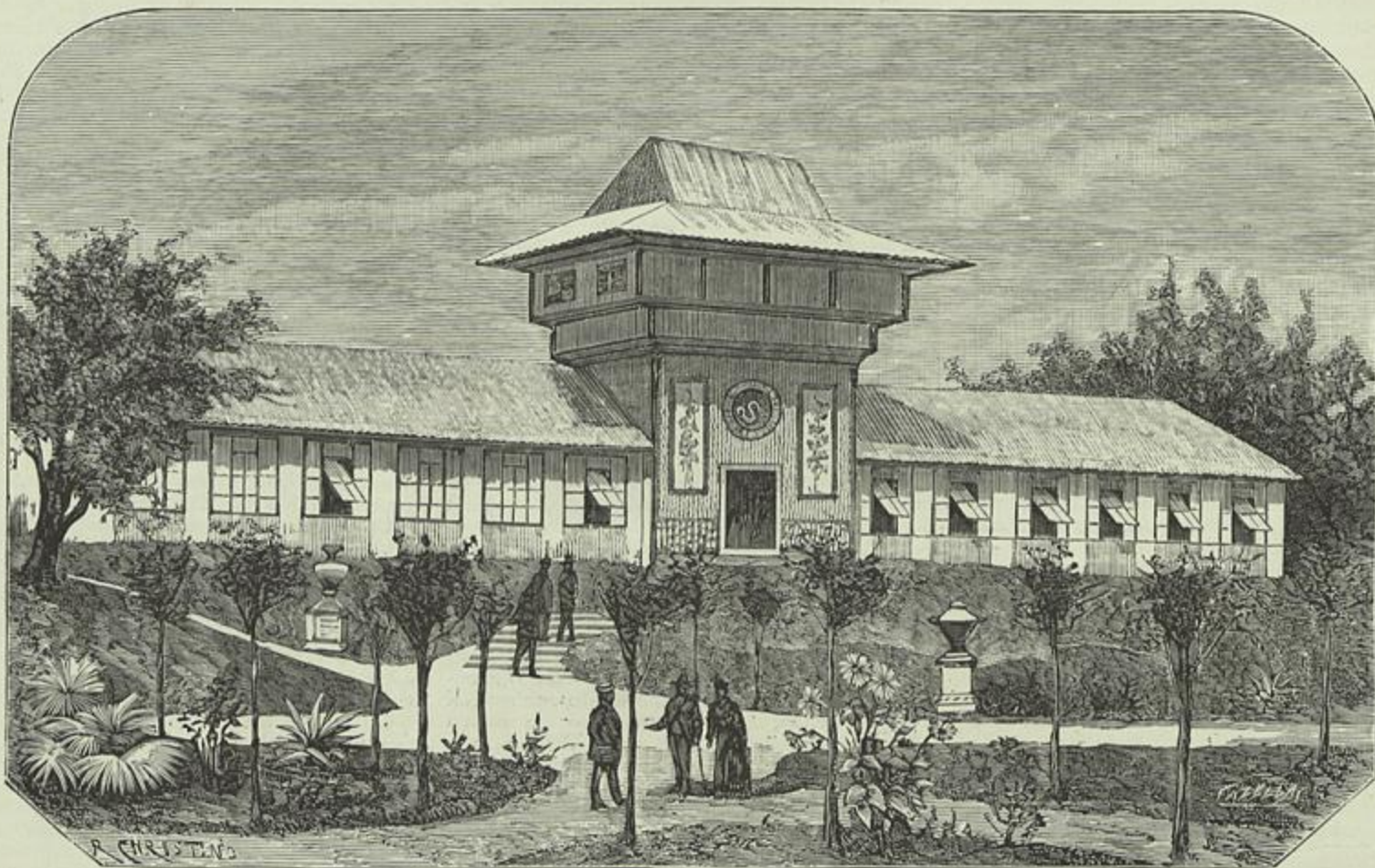
EDIFICIO PRINCIPAL DA FABRICA DE FAIANÇAS DAS CALDAS DA RAINHA