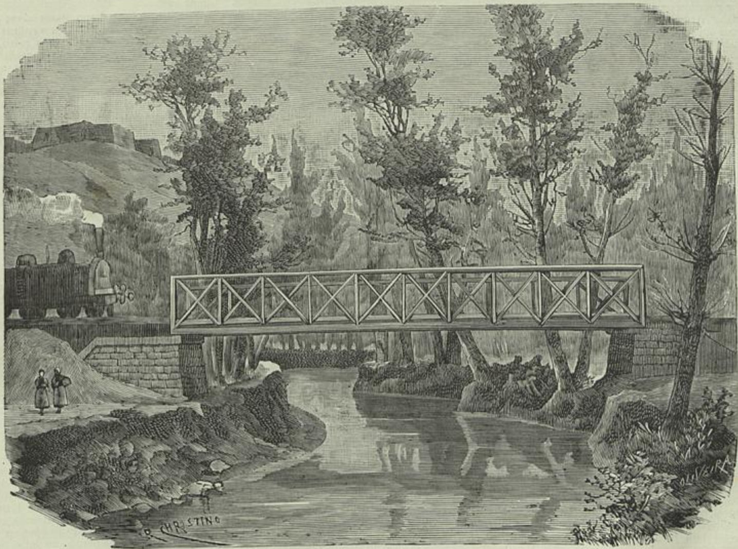
CAMINHO DE FERRO DE TORRES VEDRAS—PONTE METALLICA SOBRE O SIZANDRO (Desenho do natural por J. R. Christino)