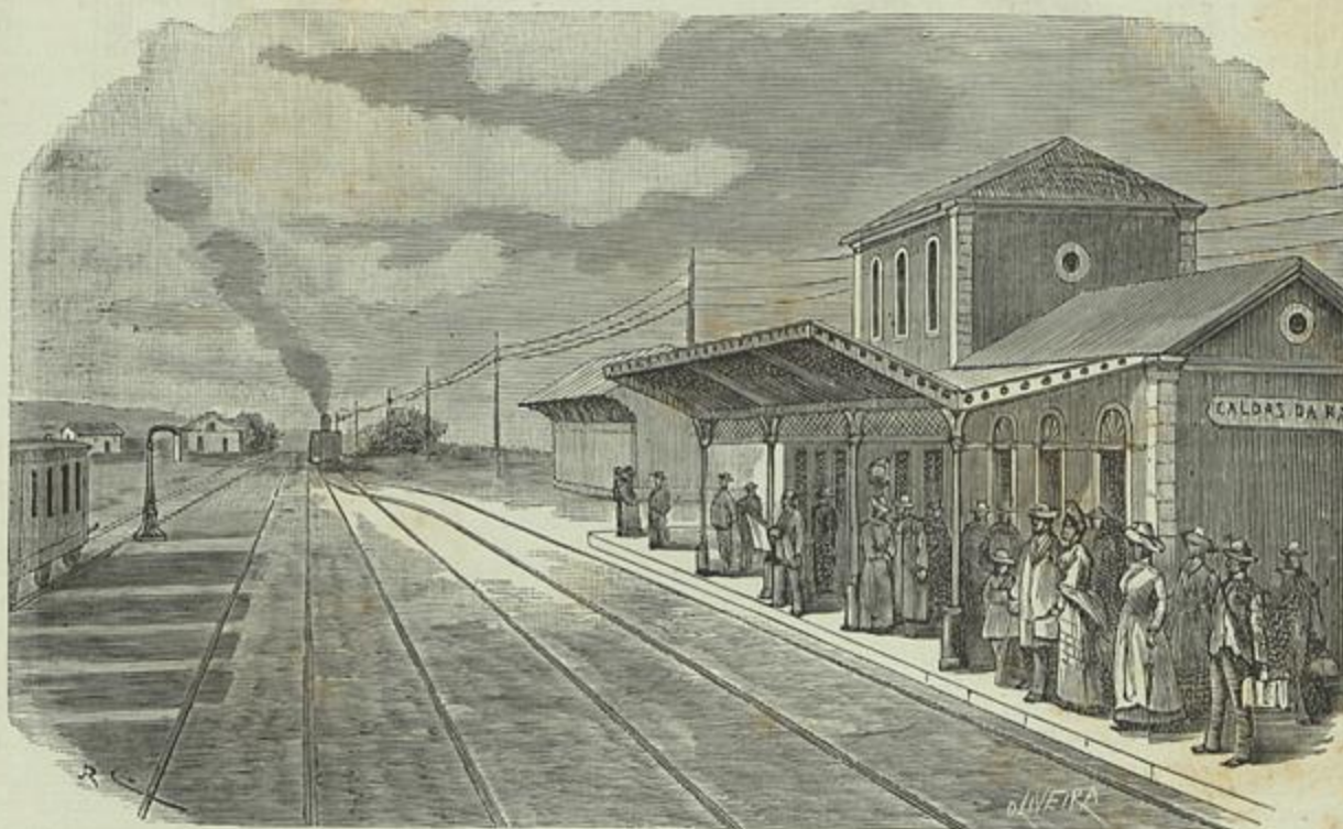
CAMINHO DE FERRO DE TORRES VEDRAS—ESTAÇÃO DAS CALDAS DA RAINHA

(Desenho do natural por J. R. Christino)