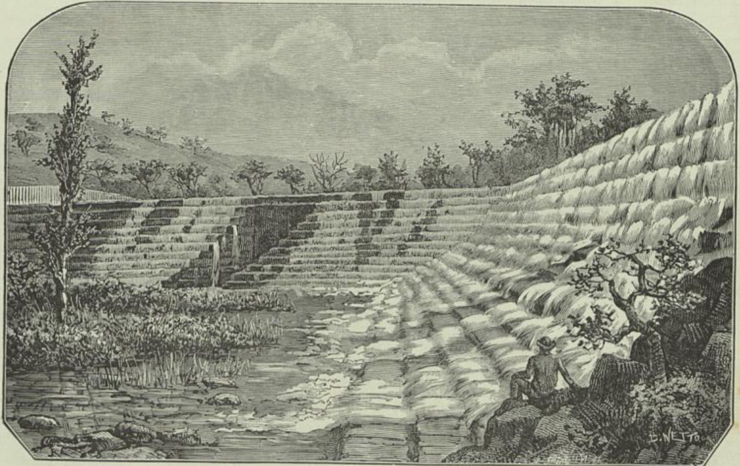
O AÇUDE DA FABRICA DE FIAÇÃO, DE THOMAR, NO RIO NABÃO

«Se me perguntassem a mim qual o romance que prefiro, de tantos que a litteratura portugueza lhe deve, eu lembrar-me-hia immediatamente d'aquelle delicioso Amor de perdição , perola iriada, perola delicada e transparente, que é um achado raro até na vida intellectual de um cerebro como o seu; lembrar-me-hia das encantadoras Novellas do Minho , nas quaes o drama mais completo encontrou a forma mais simples e mais genial, e a paizagem do norte a sua côr mais propria, a sua expressão mais viva, o desenho mais potente; mas responderia logo, sem hesitar: — Não prefiro nenhum dos romances em particular; amo-os a todos, porque são o reflexo da alma portugueza em alguns dos seus aspectos especiaes mais verdadeiros e mais nativos, porque são o repositório riquissimo de