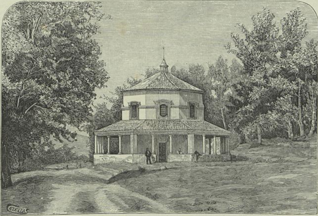
CEIÇA — CAPELLA DE NOSSA SENHORA