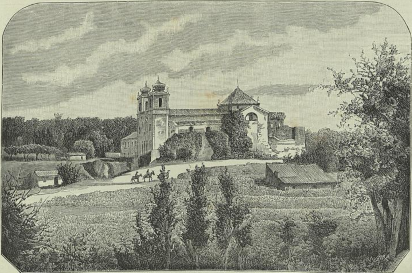
CEIÇA — RUINAS DO MOSTEIRO