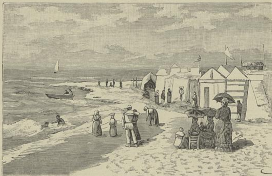
PRAIA DE BANHOS, NA POVOA DE VARZIM