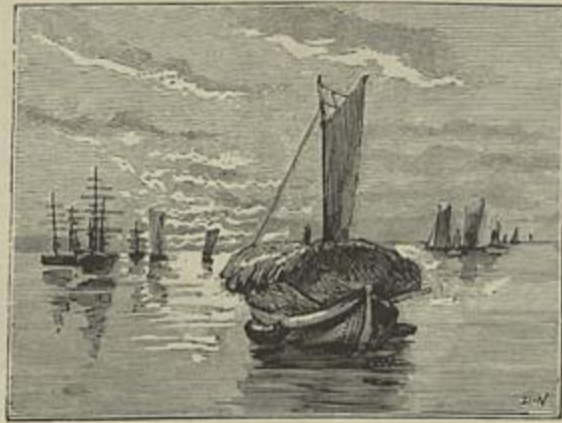
PÔR DO SOL, TEJO (Quadro de Jeronymo Banhos)