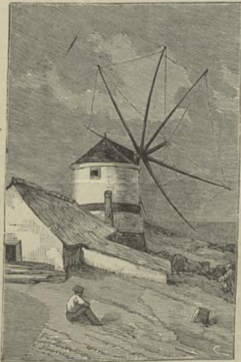
MOINHO, NO SEIXAL (Quadro de José Queiroz)