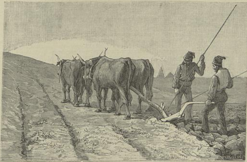
EM FINS DE DEZEMBRO (Quadro de C. Xavier)