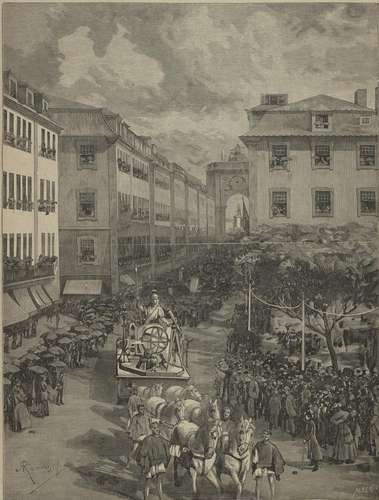
A PROCISSÃO CIVICA DESFILANDO NA PRAÇA DE D. PEDRO (8 de maio de 1882) (Desenho de A. Ramalho)