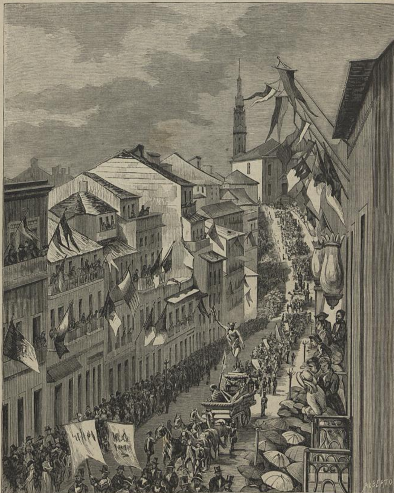
A PROCISSÃO CIVICA DESFILANDO NA RUA DE SANTO ANTONIO (1 de Maio de 1882. — Segundo um desenho de Isaias Newton)

FESTAS DO CENTENARIO DO MARQUEZ DE POMBAL, NO PORTO