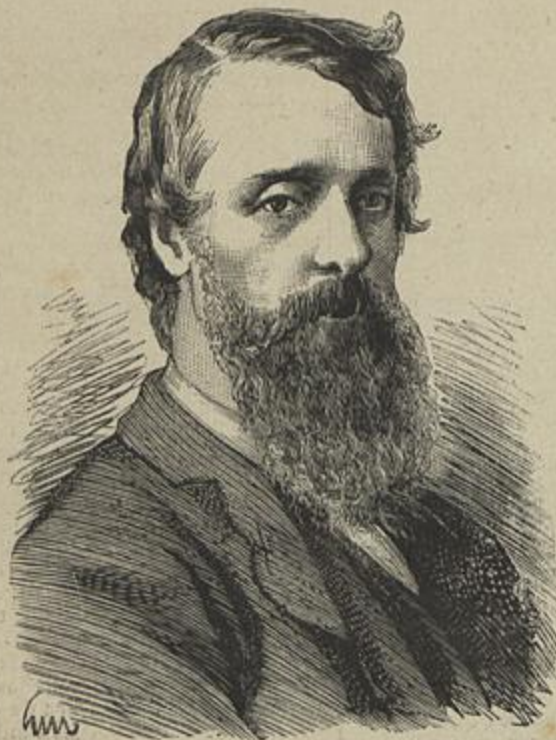
LORD FREDERICK CHARLES CAVENDISH