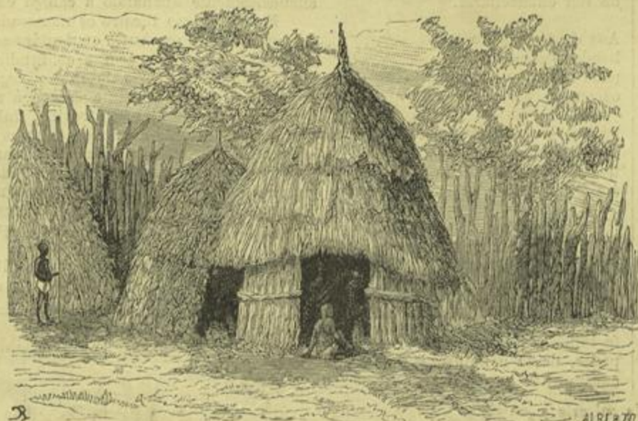
CUBATA DOS EXPLORADORES PORTUGUEZES NOS ARREDORES DO BIHÉ

(Segundo um desenho enviado pelos expedicionarios)