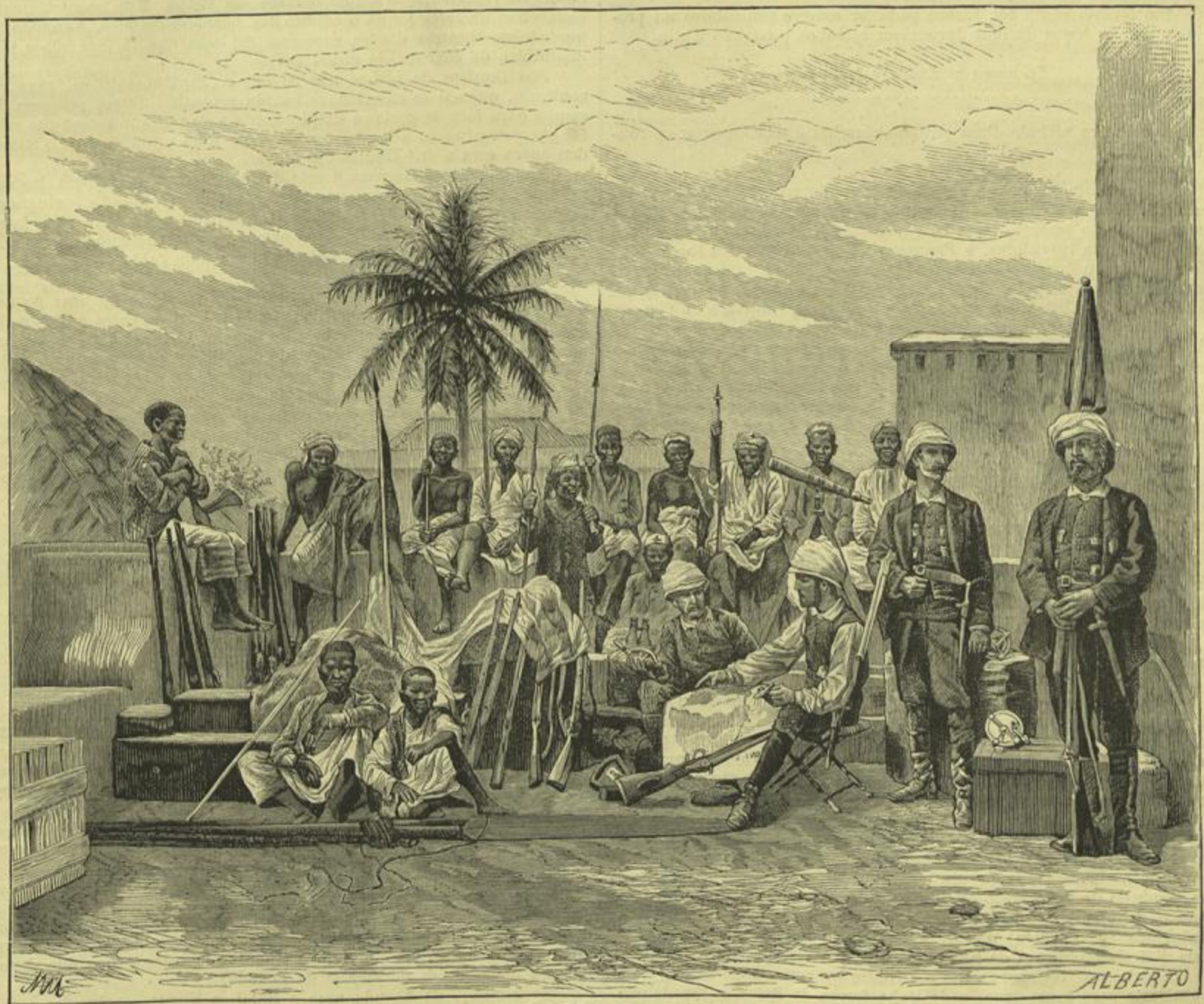
CONFERENCIA DE HENRY STANLEY E OS EXPLORADORES PORTUGUEZES EM LOANDA (Segundo uma photographia enviada pelos expedicionarios)