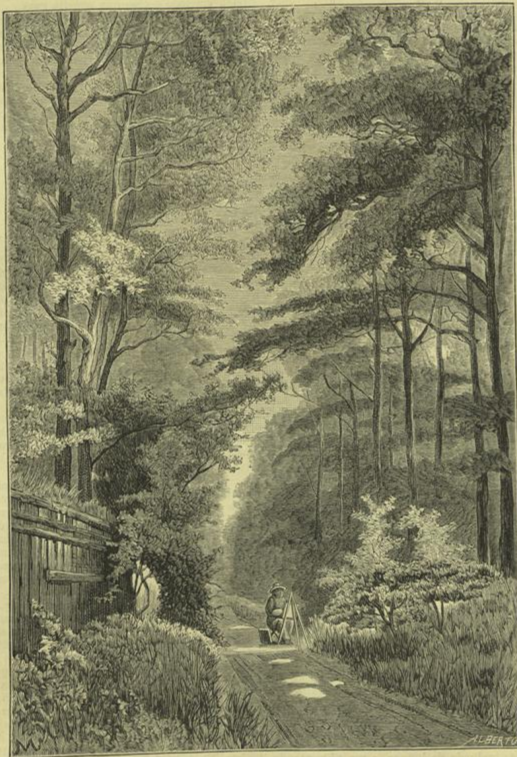
CAMINHO NA FLORESTA — QUADRO DE ALFREDO KEIL (Segundo um desenho do auctor)