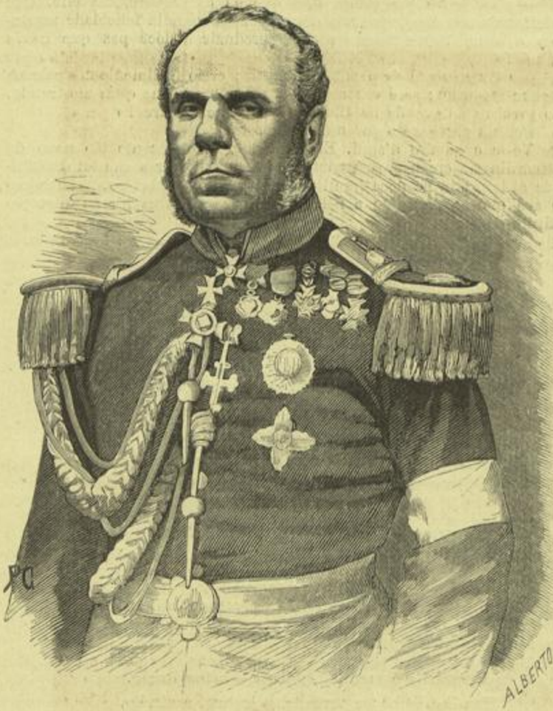
ALMIRANTE VISCONDE DE SERGIO DE SOUSA