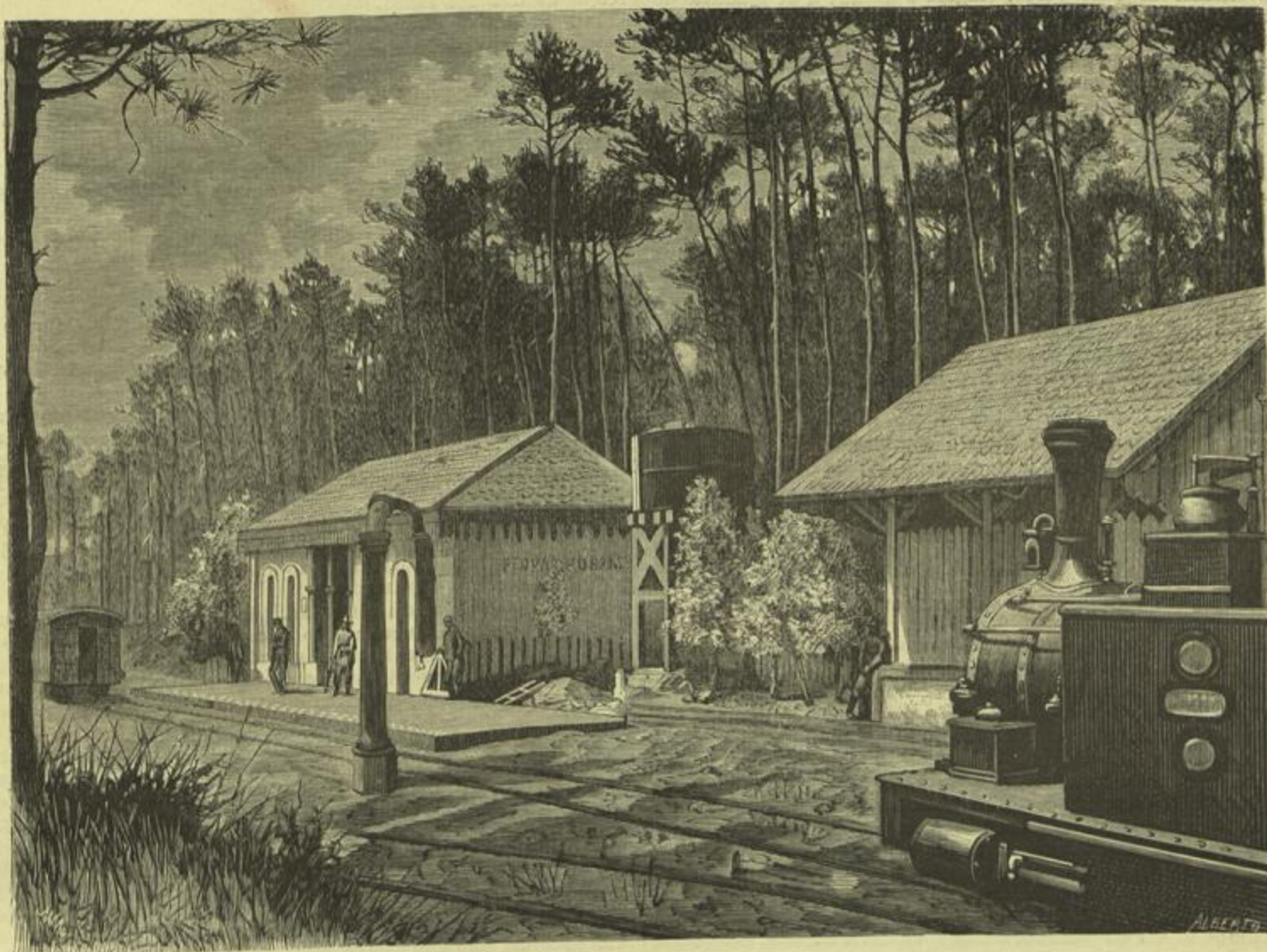
ESTAÇÃO DE PEDRAS RUBRAS NO CAMINHO DE FERRO DO PORTO À POVOA DE VARZIM