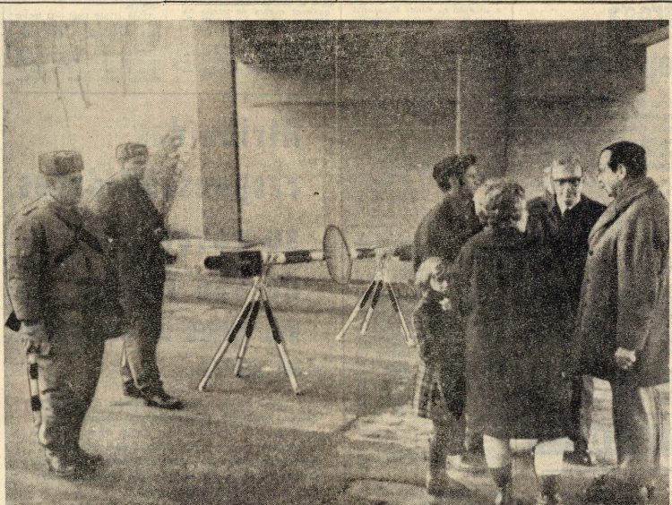
Posto de fiscalização num dos acessos a Berlim oeste, na zona de Bahelsberg. À esquerda vêem-se dois guardas fronteiriços da R.D.A.

Aqui, muitas pessoas estão fartas de tanta conversa sobre assuntos que lhes dizem respeito, como a elaboração da Constituição do país, e as intermináveis discussões sobre pormenores insignificantes e pontos de vista falhos de realismo. (CONTINUA NA 3.ª PAGINA)