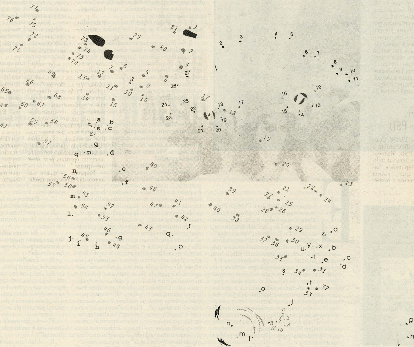
ILUSTRAÇÃO: GONÇALO RUIVO