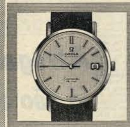
Seamaster de ville Elegante relógio de desporto, com calendário Automático, impermeável Caixa especial «monococa»

Na vasta colecção Omega há relógios a partir de 1.200$00