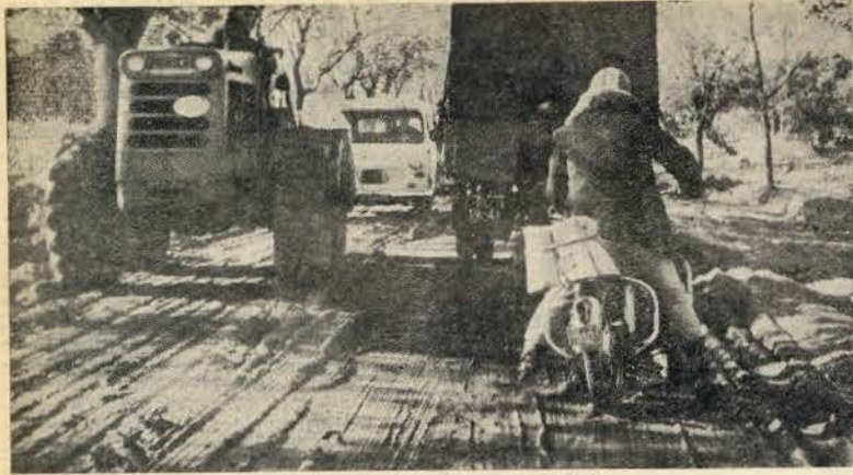
Alhandra: Ruas e estradas dificilmente transitáveis