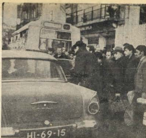
De manhã, junto das estações das linhas de Cascais e de Sintra, as pessoas que queriam vir para Lisboa saíam-se dos automóveis que concediam boleias

«Como consequência das inundações e das enxurradas, há roturas de esgotos e a possibilidade de contaminação dos de-