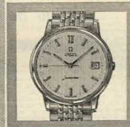
Seamaster O relógio de desporto mais desejado no mundo Automático, impermeável

Nas grandes ourivesarias, onde se encontram jóias de valor e de prestígio — encontra-se, também, essa jóia que é o relógio OMEGA