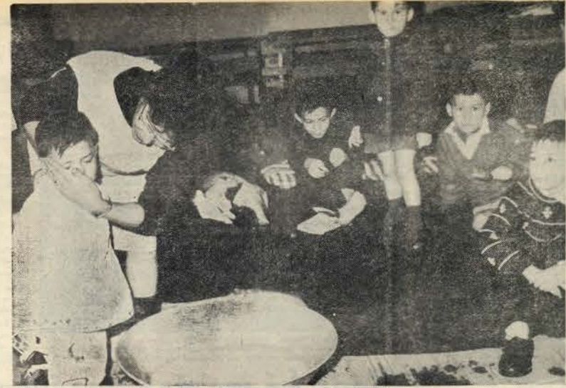
Escola João de Deus, em Vila Franca de Xira: crianças desoladas são assistidas

Aponta-se, por exemplo, e a fim de se aquilatar melhor das dificuldades que se apresentam aos serviços técnicos da C.P., que o desmoronamento derrubou por completo 12 postes da cantenária, os quais ainda se encontram sobre o peso enorme das terras movimentadas.