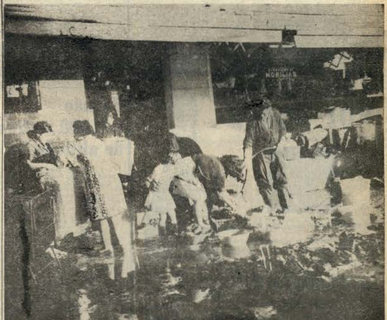
A luta pela sobrevivência leva pessoas a tentar salvar géneros que a enxurrada arrastou. Os mercados em zonas baixas foram fortemente afectados

• Ler mais noticiário nas páginas 11 a 15