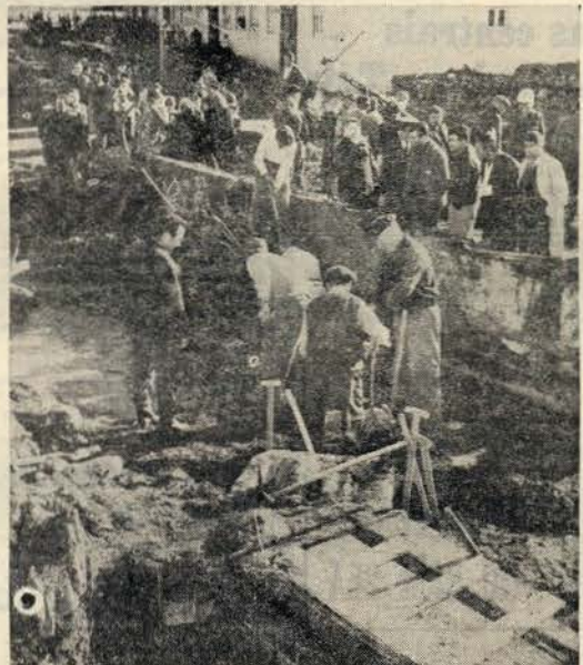
«Está uma mulher presa nesses troncos», dizia-se em Odivelas. Mas não era verdade. As pesquisas continuam para localizar trinta desaparecidos

O «Diário de Lisboa» encontra-se à venda nas tabacarias de Leça, Matosinhos, Foz, Avenida da Boavista, Carvalhosa, Carvalhido, Rotunda da Bonavista, Praça Marquês de Pombal, Rua de Costa Cabral, Constituição, Praça da República, Bonfim e Antas, a partir das 19 e 30, e na Tabacaria do Bar-Restaurante do Aeroporto em Pedras Rubras, a partir das 20 horas.