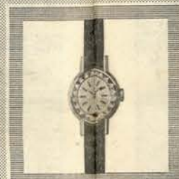
Clasic Modelo de estilo clássico — Vidro anti-artificial, facetado, e que não se riscia

Nas grandes ourivesarias, onde se encontram jóias de valor e de prestígio — encontra-se, também, essa jóia que é o relógio OMEGA