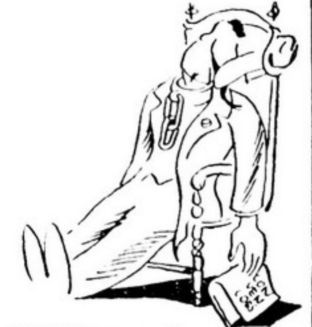
O "PARECEMAL" ARREPELOU A CARECA E CAIU DESMAIDO PELO SUCESSO DO CONCURSO.