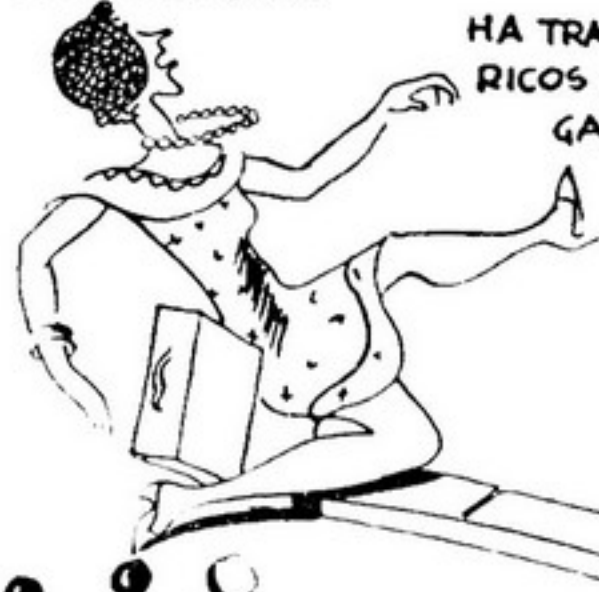
HA TRAMBULHÕES HISTERICOS NA RUA ESCORREGARRETT.