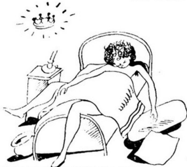
A RESPEITO DE PREGAREM OLHO NEM ELAS NEM OS VISINHOS

AS COSTUREIRAS ANTES E DEPOIS DO CONCURSO