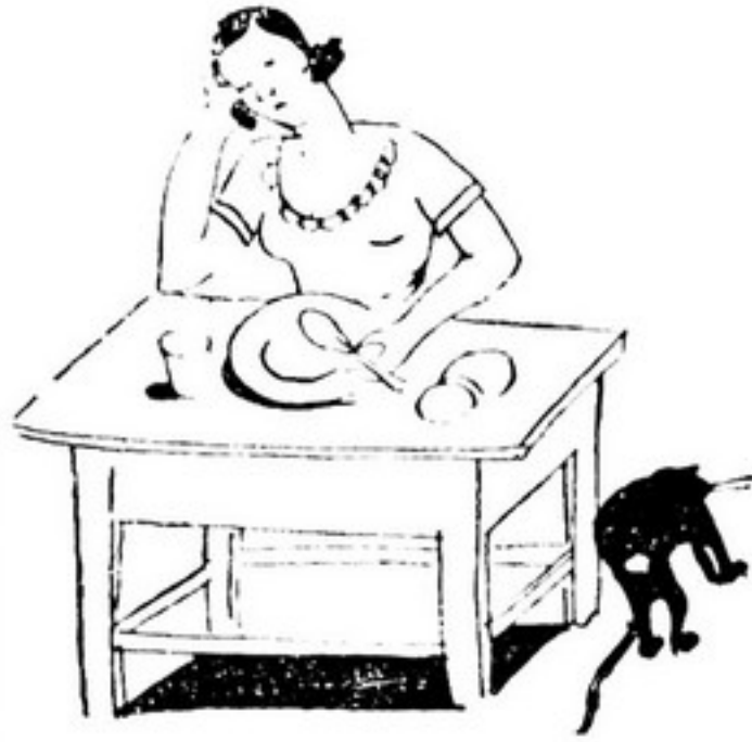
FICAM ZUCAS E NÃO MANDUCAM.