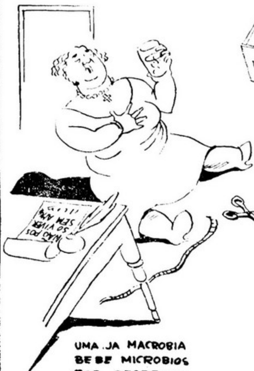
UMA JA MACROBIA BEBE MICROBIOS POR DESPEITO (SE BEM QUE TENHA PEITOS)