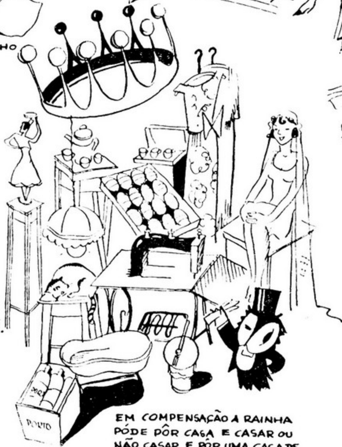
EM COMPENSAÇÃO A RAINHA PÓDE PÔR CASA E CASAR OU NÃO CASAR E PÔR UMA CASADE UTILIDADES