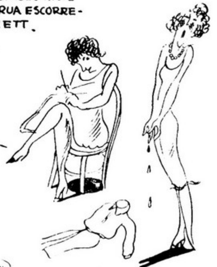
NEVROTICAS PKAM OS DEDOS COMO CHOURICOS.