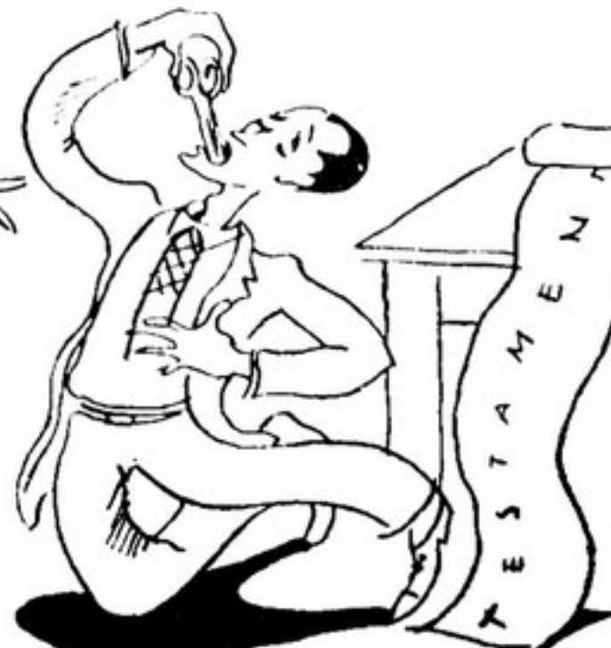
UM ALFAIATE, BELEZA DE RA PAZ, PELO MESMO MOTIVO SUICIDA-SE TRAGICAMENTE.