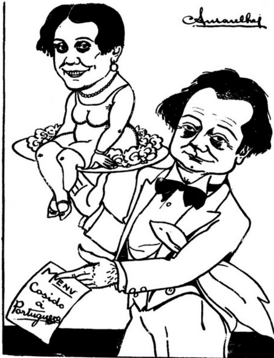
O prato mais apetitoso do Cosido á Portuguesa