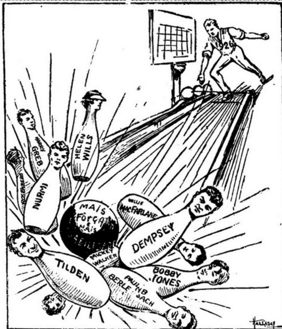
1926 — O vencedor de todos os campeões