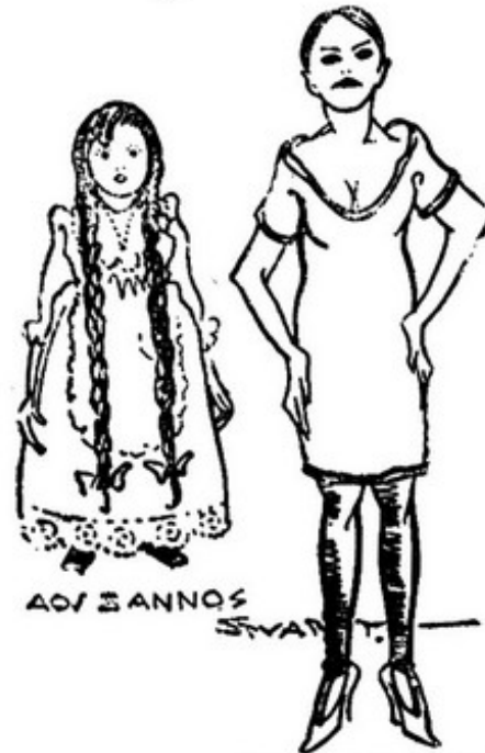
A miniatura grandiosa dum Genio