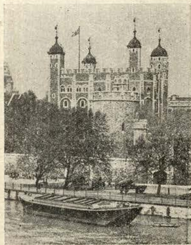
Vista da Tôrre de Londres, de fatídica memória, em cujas caves tantos desgraçados foram torturados, durante séculos...

um agrupamento, o eterno, o ingénio, o papalvo agrupamento de Londres — frente a uma porta. Empoleirados num degrau de pedra — três homens, fregolizados numa fantasia carnavalesca, pregam, gesticulam e distribuem prospectos, como pantomineiros de feira. Dois dêtes envergam o traje clássico dos guardiões da Tôrre de Londres, calções curtos e tuifados, meias até ao alto da perna, vestes listradas de vermelho e negro, golas altas com bofes brancos, lanças muçulmanas nas mãos enluvadas de couro. O outro macaqueava um verdugo medieval, de mangas arregaçadas para que o «sangue das vítimas» não lhe jorrasse para a camisa; capuz enfiado até ao pescoço e esburacado na altura dos olhos. Encimando o portal, que tinha o n.º 81 (a), estava uma longa tira de pano, à laia de tabuleta improvisada com o reclamo ao espectáculo: «Os Mistérios da Tôrre de Londres» — «Reconstituição impressionante dos tormentos e torturas do tempo de Henrique VIII».