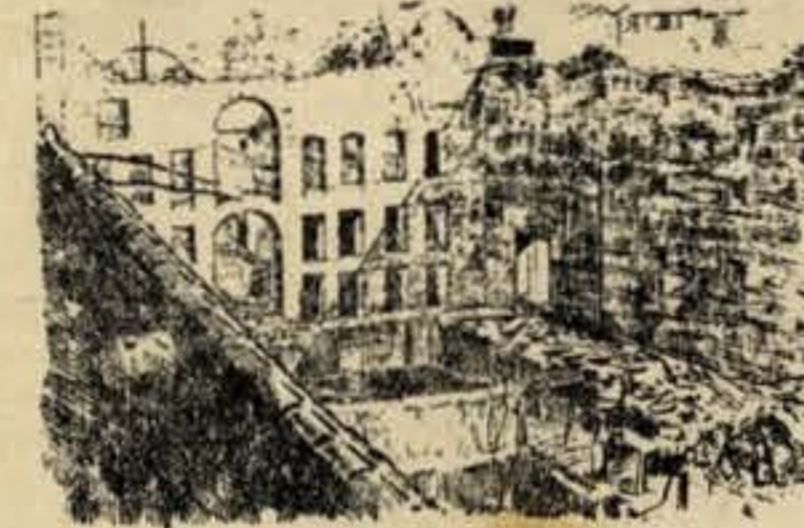
O interior do Teatro Baquet, depois do incêndio

«Em todos eles — conta-nos Sousa Rocha — foram consideradas imprescindíveis umas certas e determinadas obras e medidas e muito principalmente no Baquet, que a referida comissão chegou a condenar, achando mais acertado que este teatro não voltasse a funcionar do que nele fossem introduzidos os melhoramentos apontados. Pois, apesar de tudo isto, os teatros abriram as suas portas ao público sem que as obras con-