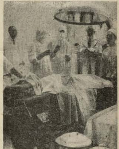
Cirurgiões com máscaras para uma operação difícil