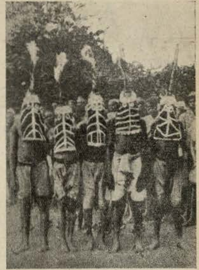
Os negros do Sudão mascararam-se com estas máscaras para executarem as suas danças selvagens

pela qual se verifica que a hipocrisia humana, tão velha como o mundo, apenas se transforma com as civilizações