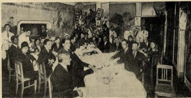
A assistência à ceia de homenagem a Reinaldo Ferreira, Director do «Reporter X»

Brindaram pelo nosso prezado Director, enaltecendo-lhe as suas extraordinárias qualidades de trabalho, carácter e inteligência, e felicitando-o pelo triunfo da Dama do Sud , D. Virginia Quaresma,