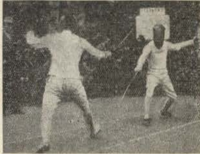
As máscaras dos espadachins esgrimistas

pela qual se verifica que a hipocrisia humana, tão velha como o mundo, apenas se transforma com as civilizações