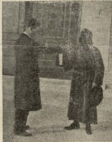
Disfarce usado pela Setta da Misericórdia, fazendo o pedtório á porta duma igreja em Pisa (Italia)