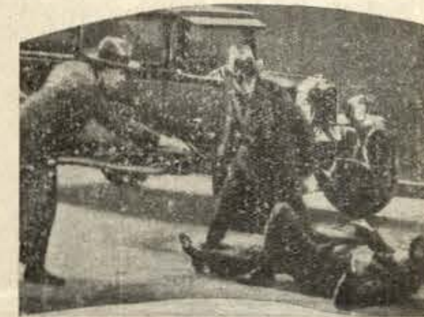
Uma proeza dos Camorristas

sistido por dois segundos. (Tôdos aprendem a esgrima da navalha, sendo as armas de fogo consideradas cobardes).