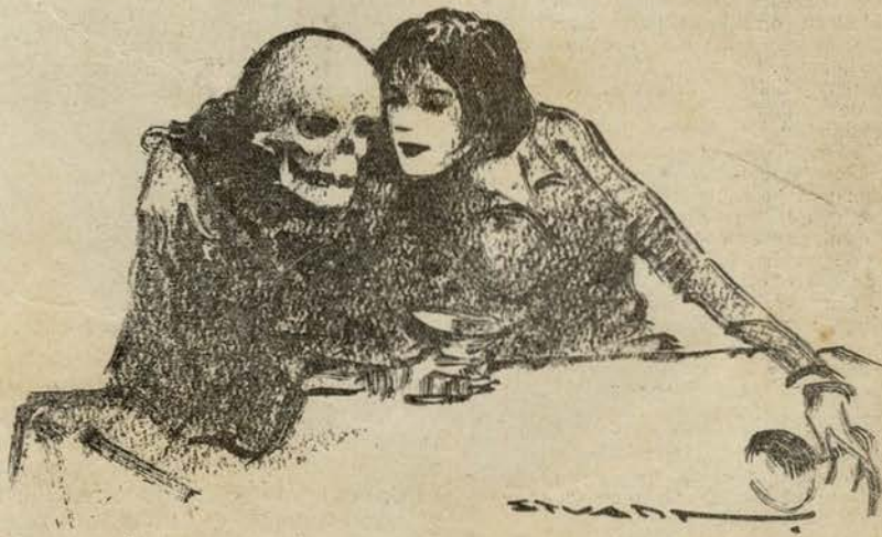
— A eterna máscara...