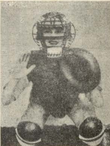
A máscara nos sports. O «catcher» (apanhador) do jogo de base-ball, sport nacional dos americanos