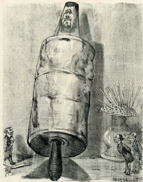
S. EX. ARAGÃO BULÇÃO SERINGÃO PALITÃO, ão! ão! ão!

Instrumento de irrigação parlamentar. Quando o entrudo está na Camara, porque não ha de estar na rua? É um vulcão que, pela fórma, se apaga a si mesmo. Está sempre a acender-se e a apagar-se. Que seringação, bulcão, palitão!