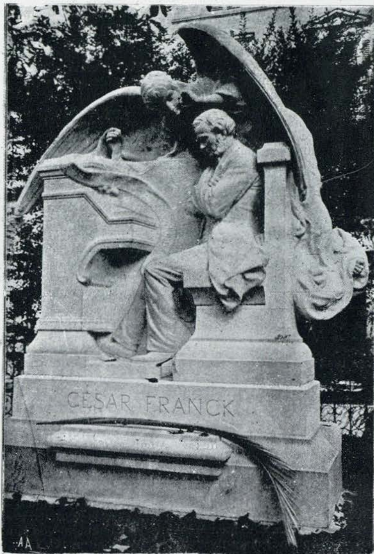
Monumento a CESAR FRANCK

Hoje, a França musical, tão justamente ciosa dos seus heroes (1). proclama o genio incomparavel de Cesar Franck e levanta-lhe