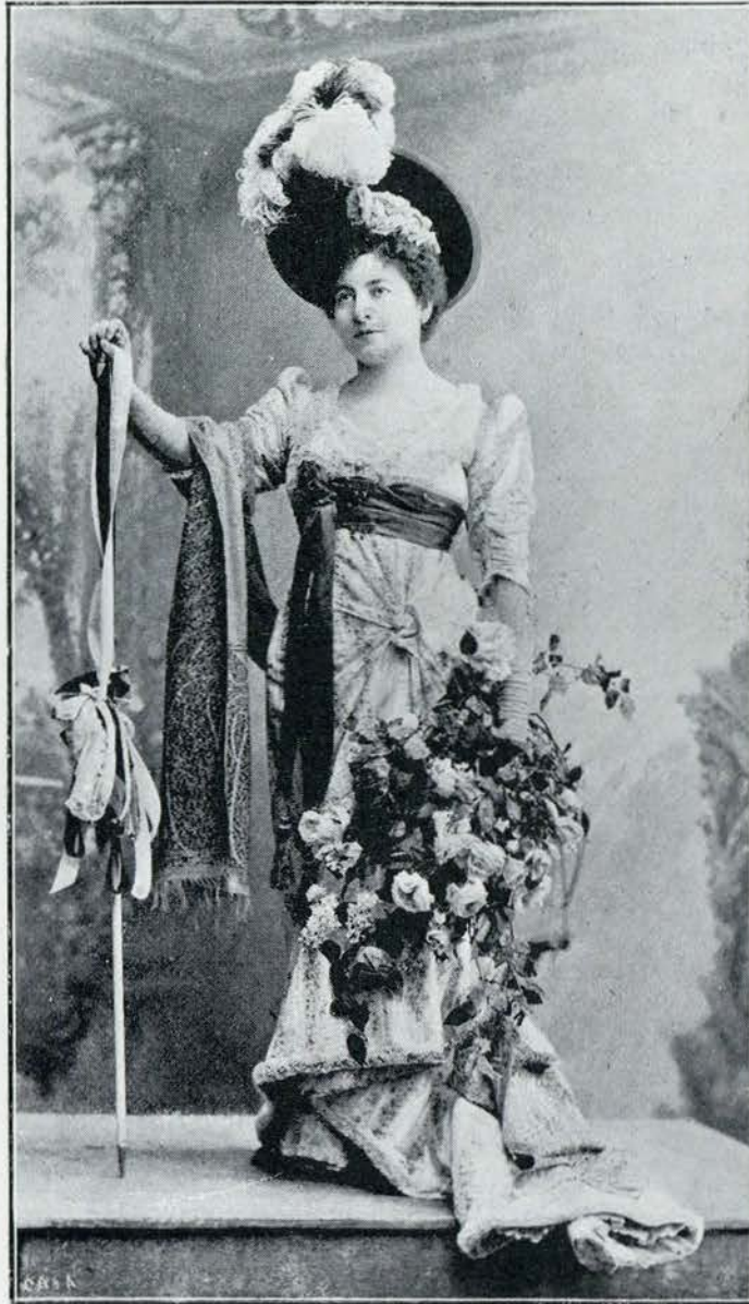
HARICLÉE DARCLÉE (Na Tosca)

primeira ordem não vemos nós o horrivel chevrottement das notas. Não nos é preciso provar o que acabamos de dizer apontando o nome d'artistas que os dilettanti de S. Carlos teem ouvido e applaudido sincera e calorosamente. Nem antigamente podia fazer